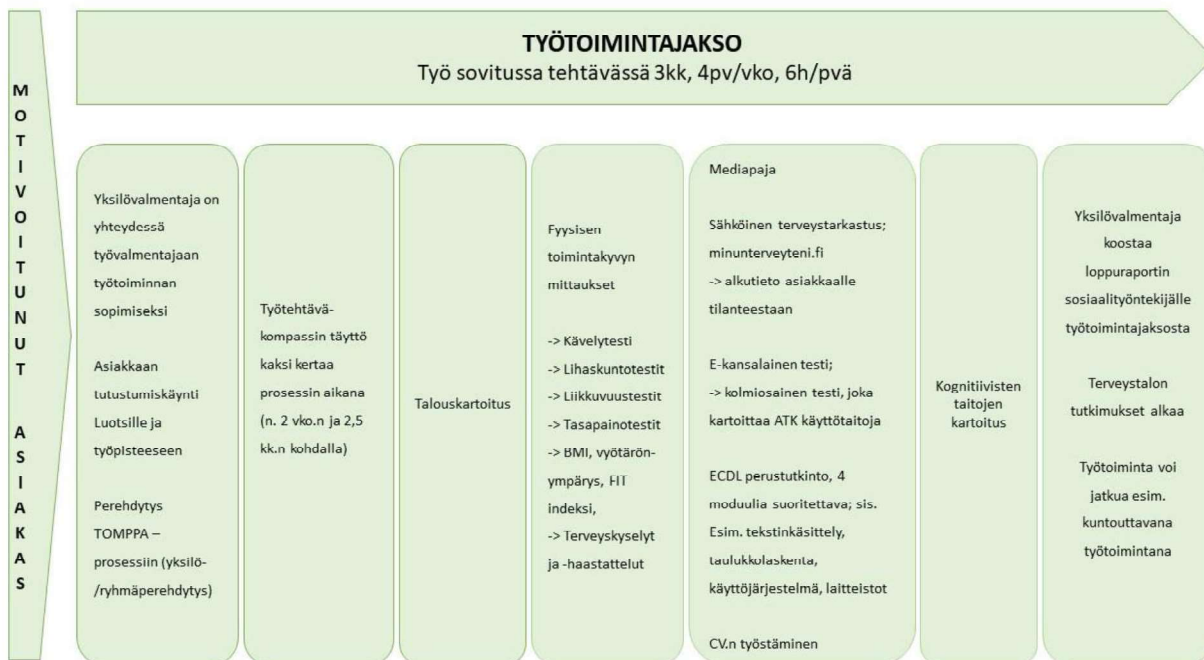
Kuvio 2 Työtoimintajakson kuvaus