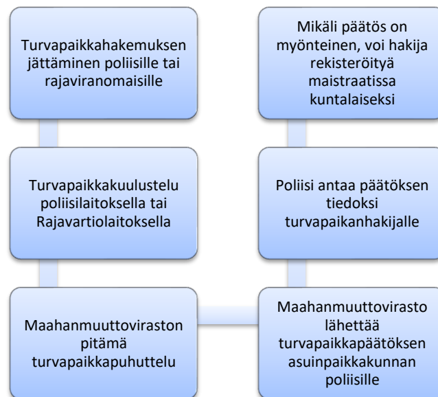
Kuva 1. Turvapaikkaprosessista kuntalaiseksi

Alla kaavio vielä turvapaikkaprosessista kuntalaiseksi (Kuva 1).