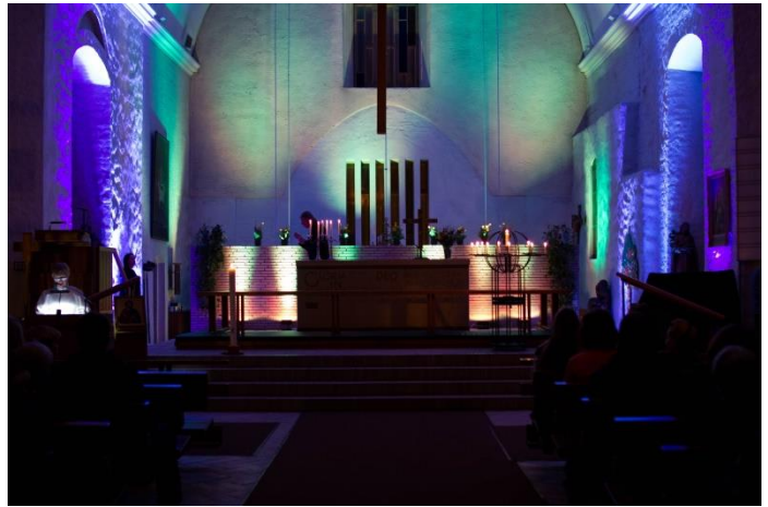
Kuva 1: Valoristi (Milo Savolainen 2017)