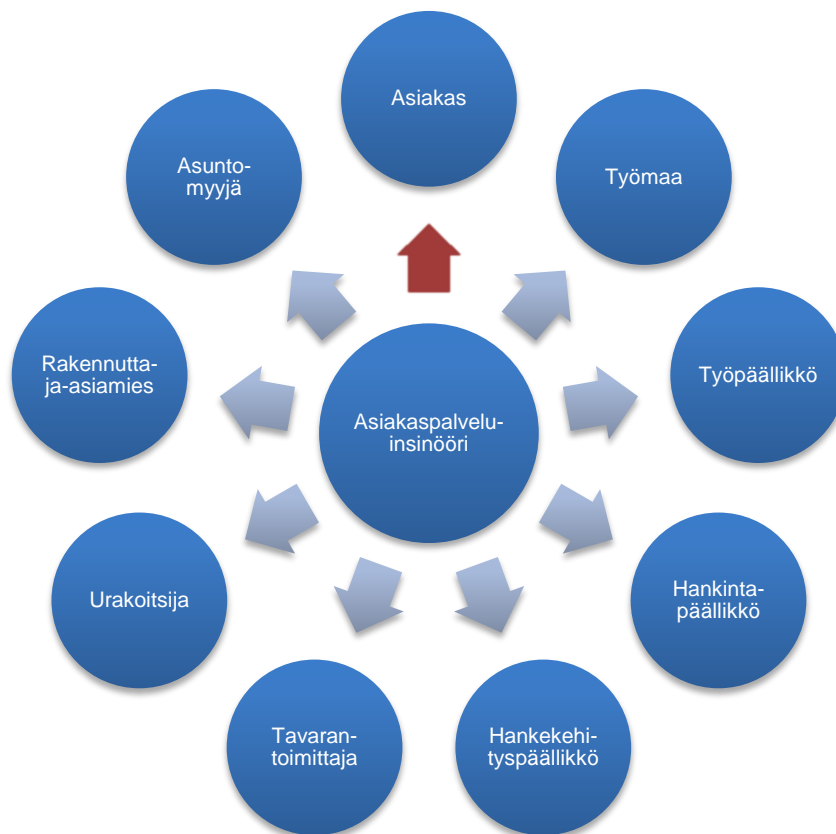
Kuva 3. Asiakaspalveluinsinöörin sidosryhmät ja asukasmuutostöiden nykyinen kulku Turun yksikössä.