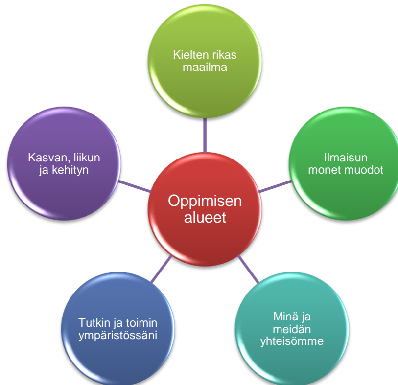
Kuvio 1. Oppimisen alueet (Varhaiskasvatussuunnitelman perusteet 2016).

Kielten rikas maailma tukee varhaiskasvatuksen tehtävää, eli vahvistaa lasten kielellisten taitojen ja valmiuksien sekä kielellisten identiteettien kehittymistä. Lasten uteliaisuutta kieliin, teksteihin ja kulttuureihin vahvistetaan. Kehittyvät kielelliset taidot antavat lapsille uusia vaikuttamisen keinoja ja vahvistaa heidän mahdollisuuksia osallisuuteen ja aktiiviseen toimijuuteen. Ilmaisun monet muodot sisältävät musiikillisen, kuvallisen, sanallisen ja kehollisen ilmaisun kehittymisen ja niihin tutustumisen. Lasten ilmaisulle on luonteenomaista sen kokonaisvaltaisuus ja eri ilmaisun muotojen yhdisteleminen. Ilmaisun eri muodot antavat lapsille keinoja hahmottaa ja kokea maailmaa innostavalla ja heitä puhuttelevalla tavalla. Minä ja meidän yhteisömme – oppimisen alue sisältää eettisen ajattelun ja katsomusten valmiuksia sekä lähiyhteisön menneisyyden, nykyisyyden ja tulevaisuuden ymmärtämisen valmiuksia. Varhaiskasvatuksen yhtenä tehtävänä on antaa lapsen havainnoida ja ymmärtää ympäristöään. Tätä tukee Tutkin ja toimin ympäristössäni – oppimisen alue, jonka tavoitteena on ohjata lapsia tutkimaan ja toimimaan