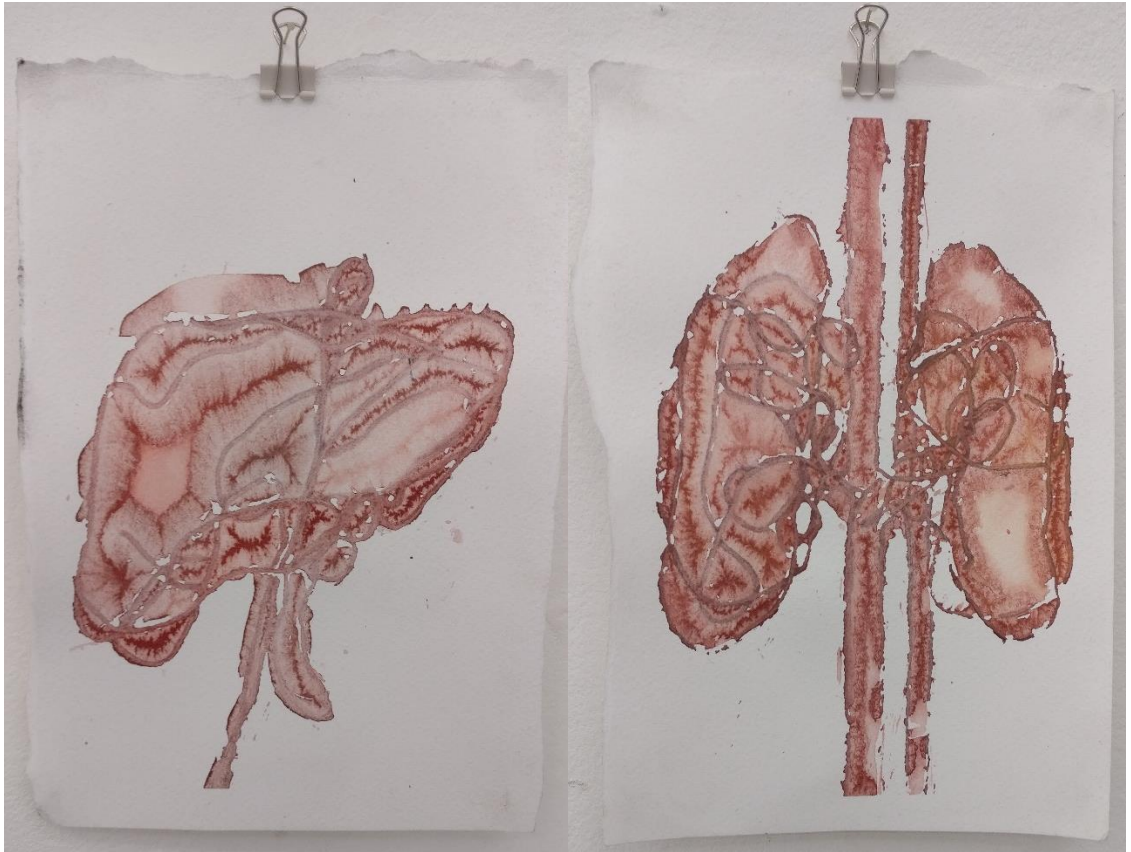
Kuva 3. Sini Kähönen, Sisäelinsarja 5–6, 2017

Teossarjassa halusin tunteen siitä, että se kantaa ajatusta sisälmyksistä kuitenkin tuomatta niitä lähelle katsojaa. Sarja loi näin mielenkiintoisen vastakkainasettelun kauuneuden, herkkyyden ja vastenmielisyyden välille nostaen samalla esiin teemoja ruumiillisuudesta ja kuolevaisuudesta. Olen aiemmissa teoksissani käsitellyt tätä aihealuetta tuoden rumia elementtejä esiin kauniiksi tulkitussa kontekstissa. Uusissa sarjoissa olen lähtenyt työstämään teemaa, jossa aiheen luoma vastenmielisyys saadaan kevenemään teoksen visuaalisen miellyttävyyden ansiosta.