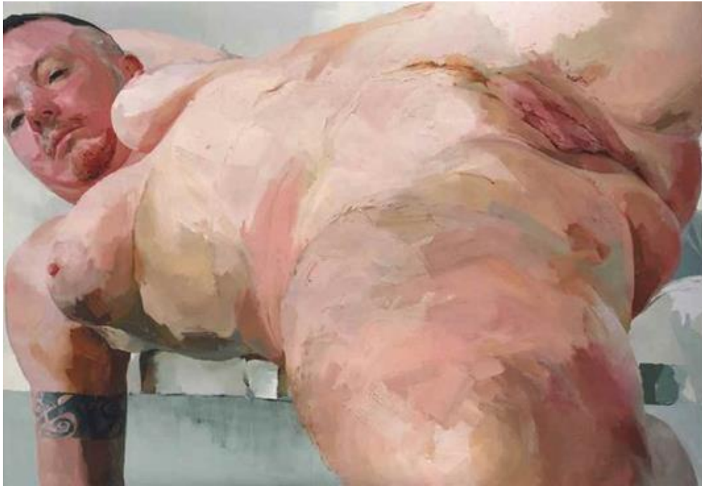
Kuva 4. Jenny Saville, Matrix , 1999. 10

Jenny Savillen teos Matrix ei nostata yhtä voimakkaasti vastenmielisiä tunteita kuin monet muut teokset Savillen tuotannosta, mutta se kantaa siitä huolimatta samoja teemoja. Teoksessa yllättää eniten se, miten siinä yhdistyvät maskuliinisuuden ja feminiinisuuden piirteet kuitenkin liittymättä toisiinsa saumattomasti.