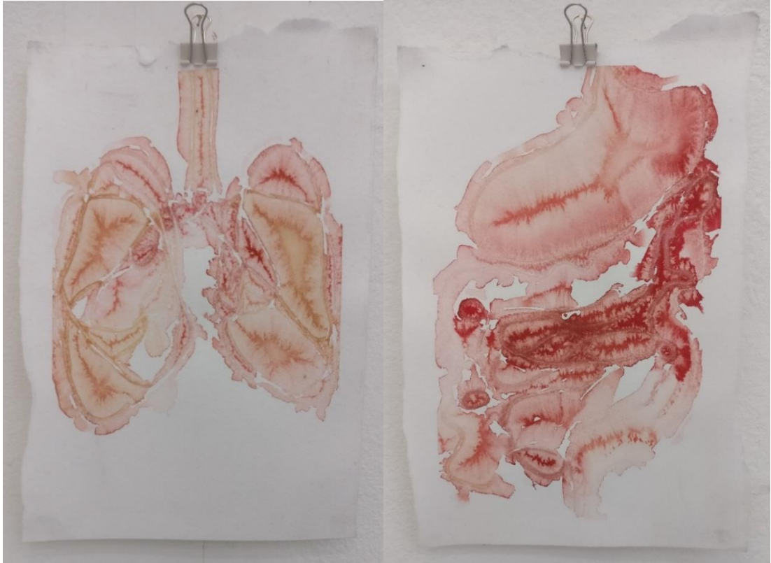
Kuva 1. Sini Kähkönen, Sisäelinsarja 1–2, 2017