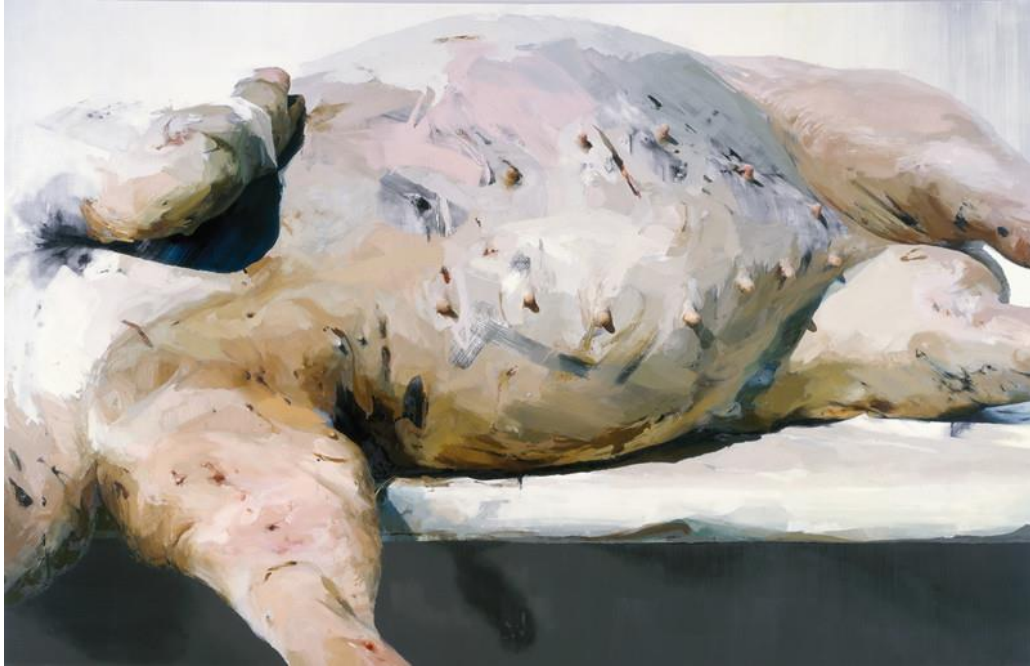
Kuva 5. Jenny Saville. Host. 2000 13

Kirjassaan Savoring the Disgust, the Foul and the Fair Carolyn Korsmeyer käyttää Jenny Savillen maalausta Host esimerkkinä siitä, miten teos voi nostattaa hienovaraisia vastenmielisyyden tunteita. Teoksesta ei käy heti ilmi, mihin lajiin torso kuuluu, sillä sen rinnus on korvattu nisillä ja lantio on turvonnut. Korsmeyer viittaa Saatchi Galleryn teoksen narratiivista antamaan selitykseen, jossa Host perustuu Marie Darrieussecqin novelliin Pig Tales . Tarina kertoo naisesta, joka oman libidonsa vapauduttua ja tyydyttävämmäksi tultua huomaa muuttuvansa pikkuhiljaa siaksi. Jenny Saville tuo tässä teoksessa esiin nais-sian melkein sensuellin vatsan, joka on turvonnut ja valmis imettämään. Pelkästään maalaus ei siis aiheuta ihmisessä vastenmielisyyden tunnetta, vaan siihen liittyy vahvasti teoksen nimi ja gallerian tarjoama narratiivi. Teos ei ole kauhea tai kuvottava, mutta se yllättää kuitenkin hyvin luotaantyydyttävillä vastenmielisyyden keinoilla, joita siinä käytetään. Myös pelkästään teoksen nimi, Host , johdattelee jo katsojaa tutkimaan teosta näkökulmasta, jossa teoksen objekti elättää jotain toista tai tekee itsestään ”emän”, joka on vapaana imemiselle. 14