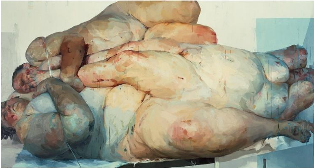
Kuva 6. Jenny Saville. Fulcrum. 1999 16

Host teoksena, kuten muutkin Savillen teokset, on vaikuttava ja värimaailmaltaan kauniin viehättävä. Savillen teoksissa täytyy ihailta tapaa, jolla taiteilija käyttää maalia ja luo erittäin realistista pintaa kuitenkin onnistuen pysymään vahvasti ekspressionismin kentällä. Työt vetävät katsojaa puoleensa ja samalla toimivat hyvin poistyyntävästi, kun niitä tarkastellaan pidempään.