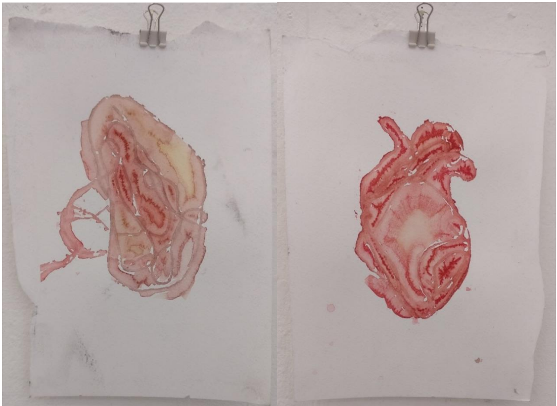
Kuva 2. Sini Kähkönen, Sisäelinsarja 3–4, 2017