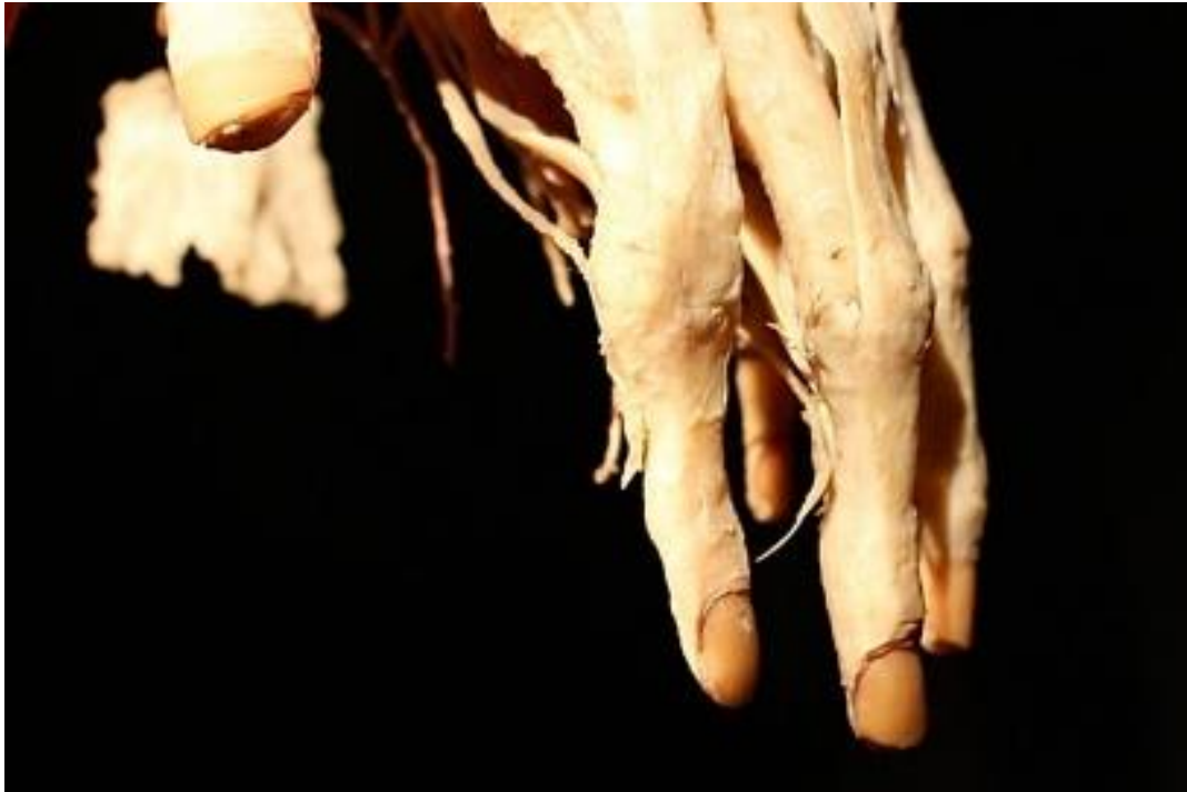
Kuva 7. Body Worlds. 2015. Koko rumiin plastinointi, yksityiskohta sormista. 20

Näyttely oli täynnä epämuodostuneita, pilkottuja tai osiksi purettuja teoksia ihmisistä. Tämä oli kammottavaa ja kaunista samaan aikaan, ja Body Worlds toisti omalla taval- laan teemaa hirviöistä.