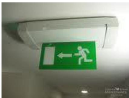
KUVIO 1. Poistumistie kyltti (Country & town maintenance 2010)

Paloriskit ovat merkittäviä myös siksi, koska niitä voidaan pienentää usein kohtuullisilla kustannuksilla. Ennaltaehkäisyn merkittävimmät toimenpiteet ovat kuitenkin oikeat asenteet ja turvalliset toimintatavat. Tulipalo on erittäin vaikea sammuttaa, mutta se on helppo ehkäistä. (PK-RH 2010.) Paloriskit ovat helppoja ehkäistä, koska ei tarvitse kuin huolehtia, että työpiste on siisti sekä työntekijät ovat koulutettu suorittamaan alkusammutus. Alkusammutusvälineitä on myös oltava helposti saatavilla. On myös vaurauduttava siihen, että tulipalo syttyy. Silloin on muun muassa poistumistiet oltava selvästi merkitty ja niin, että ne näkyvät jokaiselle työpisteelle. (KUVIO 1) Poistumistielle on myös oltava esteetön pääsy jokaisesta työpisteestä. Tämä sen takia, että työntekijät voivat poistua turvallisesti ja nopeasti. Työntekijöiden on osattava toimia oikein tulipalon syttyessä.