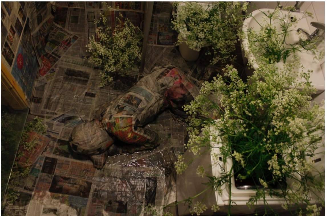
Kuva 2. Mira Vornanen 2014.