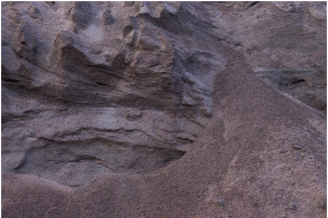
Kuva 7. Mira Vornanen 2016.