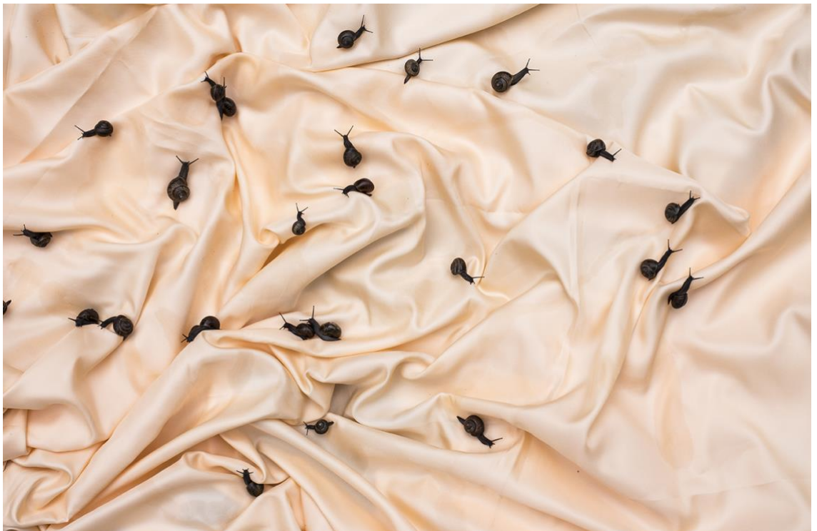
Kuva 4. Mira Vornanen 2016.