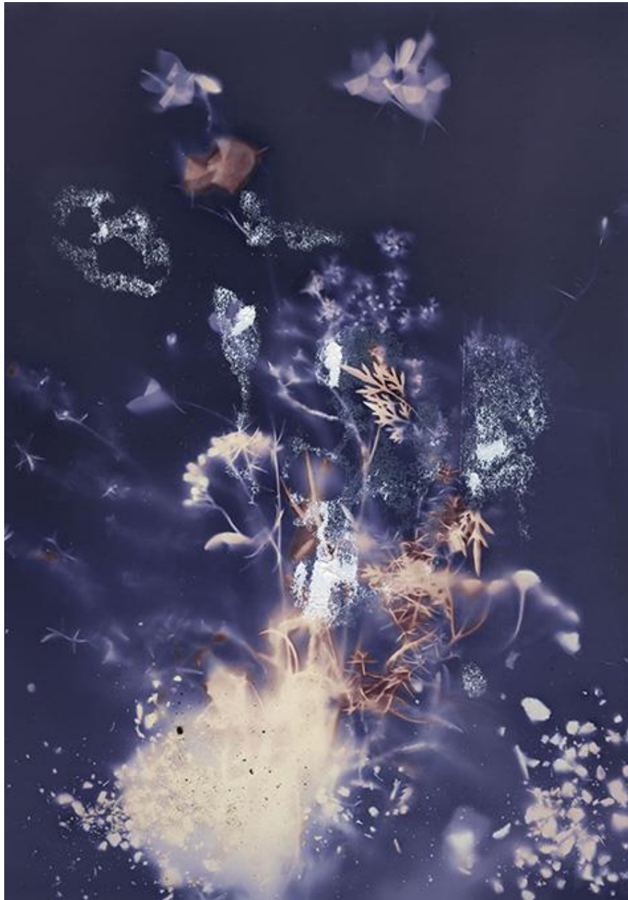
Kuva 6. Mira Vornanen 2016.