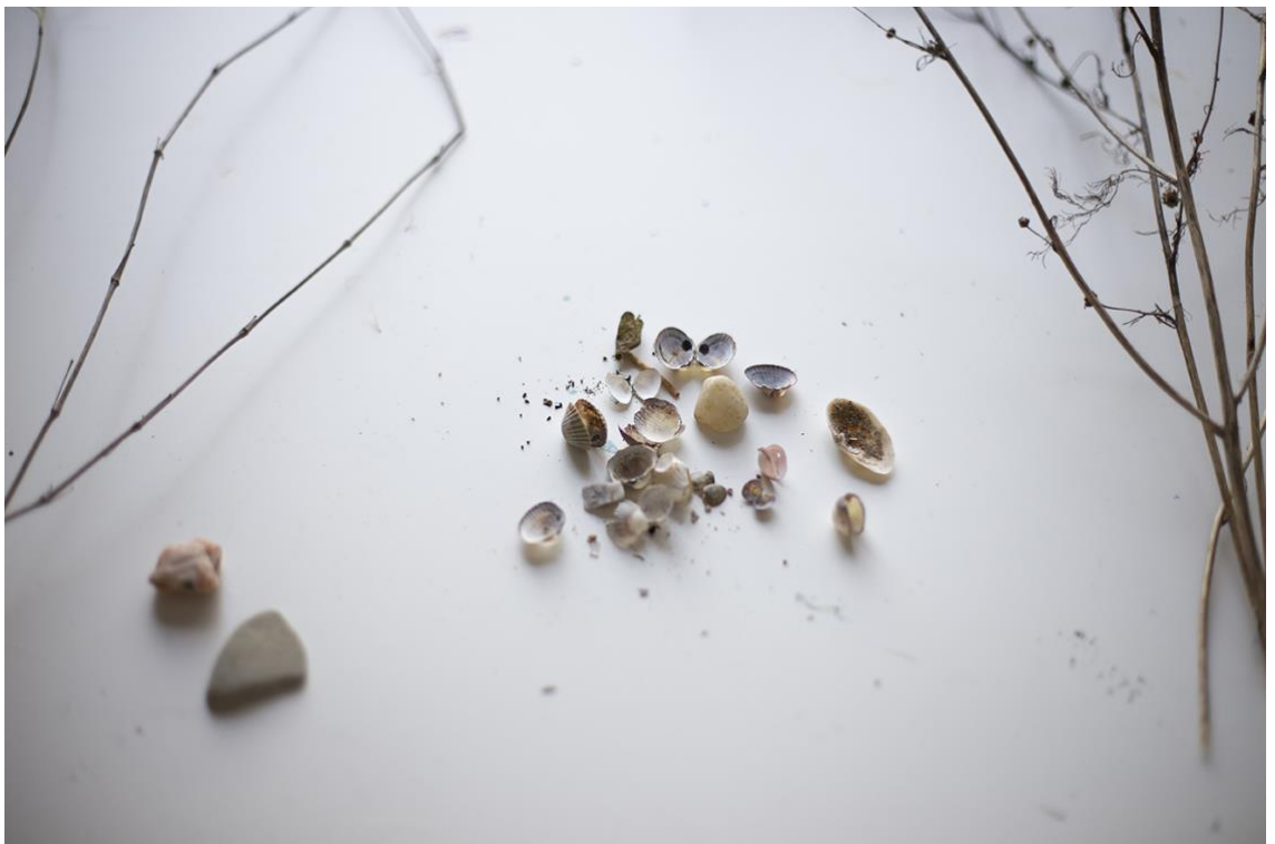
Kuva 1. Mira Vornanen 2016.