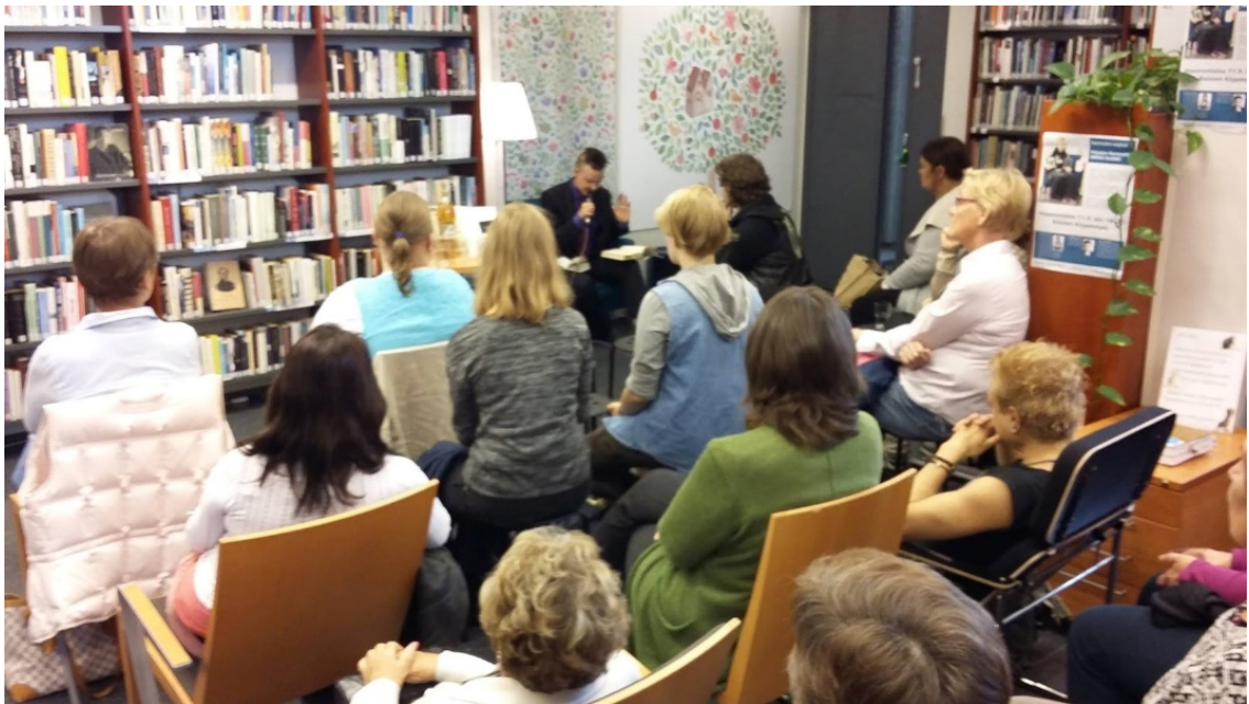
Kuva 2. Runonurkan avajaiset.