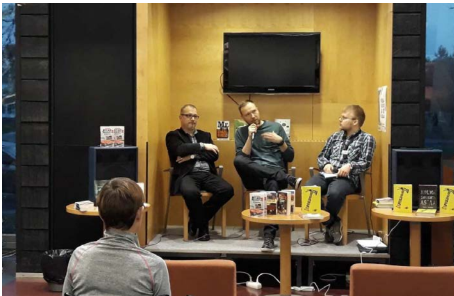
Kuva 4. Mieskirjailijat lavalla.