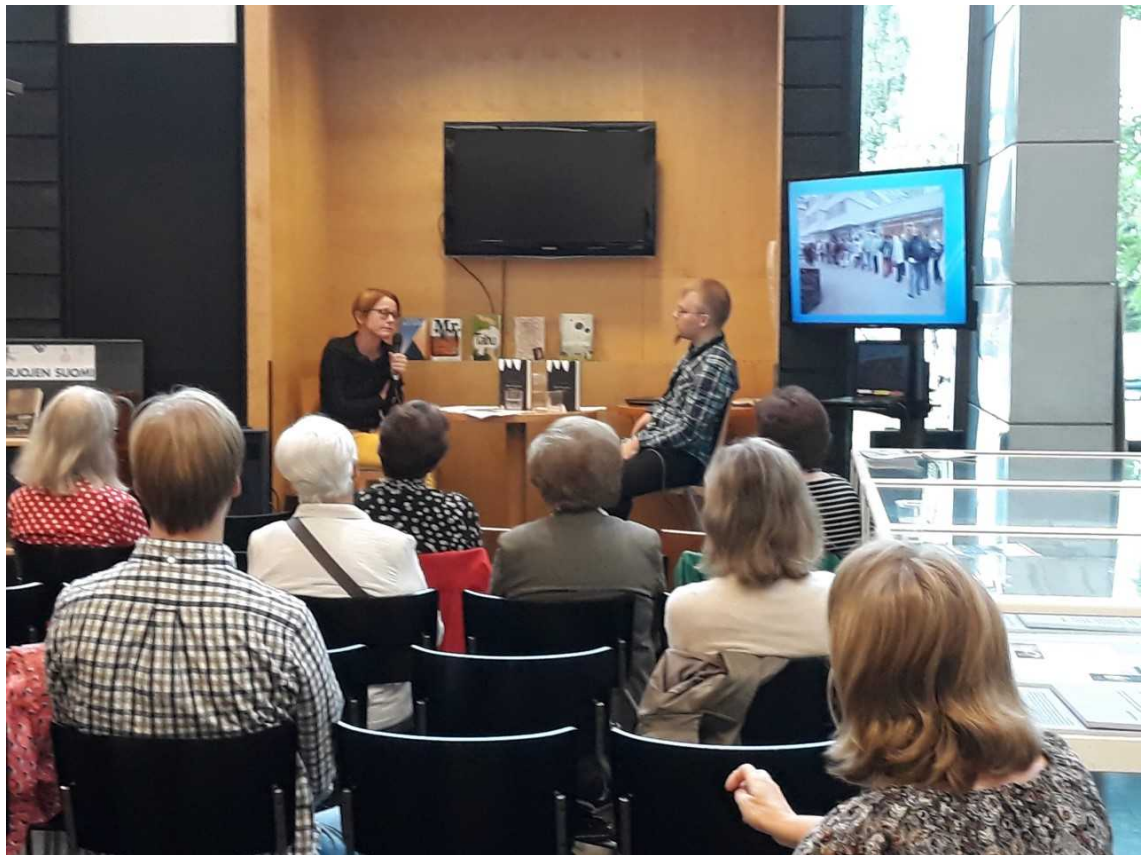
Kuva 3. Tietokirjailijan haastattelu.