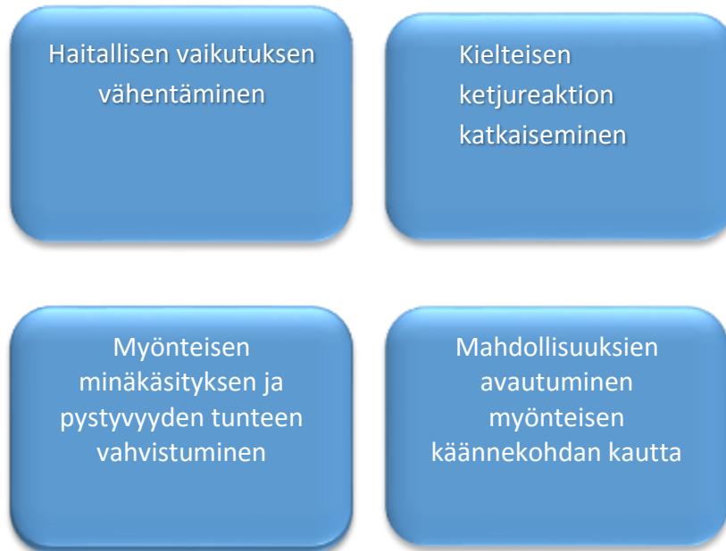
Kuvio 2 Neljä selviytymistä tukevaa prosessia

merkitystä heikentämällä tai estämällä sille altistumista; kielteisen ketjureaktion katkaiseminen, myönteisen minäkäsityksen ja pystyvyyden tunteen vahvistuminen (kannustavat ihmissuhteet; tehtävien suorittamisessa menestyminen) sekä mahdollisuuksien avautuminen myönteisen käännekohtan kautta.