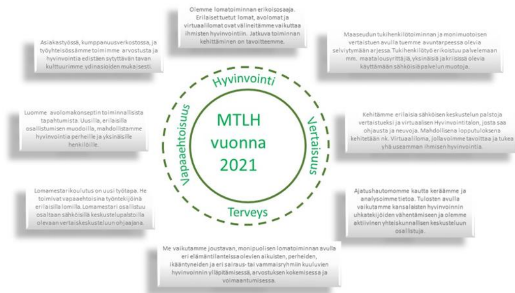
Kuvio 3: Maaseudun Terveys- ja lomahuolto ry:n strategia

Vuonna 2016 MTLH:n tuettua lomaa haki 34 163 henkilöä, ja loma myönnettiin 17 630 henkilölle (50,3%). Ensikertalaisia kaikista lomalaisista oli noin puolet. Tuettuja lomaa järjestettiin vuoden 2016 aikana 570 lomaviikkoa, joista 347 lomaa järjestettiin yhteistyössä potilas- ja vammaisjärjestöjen, näihin kuuluvien paikallisyhdistysten sekä muiden yhteistyökumppaneiden kanssa (MTLH 2016, 5.) Lomatukea myönnetään taloudellisiin, sosiaalisiin ja terveydellisiin perusteisiin. Vuonna 2016 merkittävimmit myöntämisperusteiksi nousivat pienet tulot (20%), fyysiset sairaudet joko hakijalla tai perheenjäsenellä (13%) sekä vertaistuen tarve (12%) (MTLH 2016, 7).