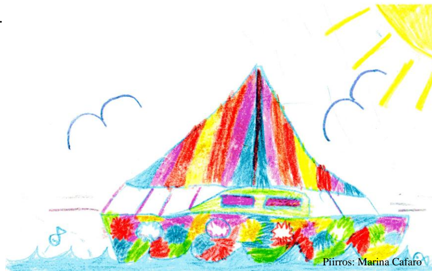
Piirros: Marina Cafaro

Lasten kanssa toimittaessa on oleellista, millä tavoin aikuinen toimii. Lapselle tunne on tärkein. Lapsi elää tunteiden kautta, tässä ja nyt. Hän ei osaa ajatella syitä ja seurauksia. Lasten hoitotyössä tarvitaan luovuutta, herkkyyttä, joustavuutta ja eettistä osaamista. Oleellista on ymmärrys lapsen kokemusmaailmasta, yksilöllisyydestä ja temperamentista. Pieni muutos aikuisen toimintatavassa voi aiheuttaa suuren muutoksen lopputuloksessa. Lapsi on herkkävaistoinen, ja hän vaistoa helposti tunnetilamme. Lapsen maailmalle on vierasta ja pelottavaa kohdata aikuisten tosiasiat, ”järjen ääni” ja kiire. Lapsi ymmärtää asiat mielikuvituksensa kautta. Hoitotyössä sadut ja tarinat sekä leikki auttavat lasta ymmärtämään ympärillään ja itsessään tapahtuvia asioita.