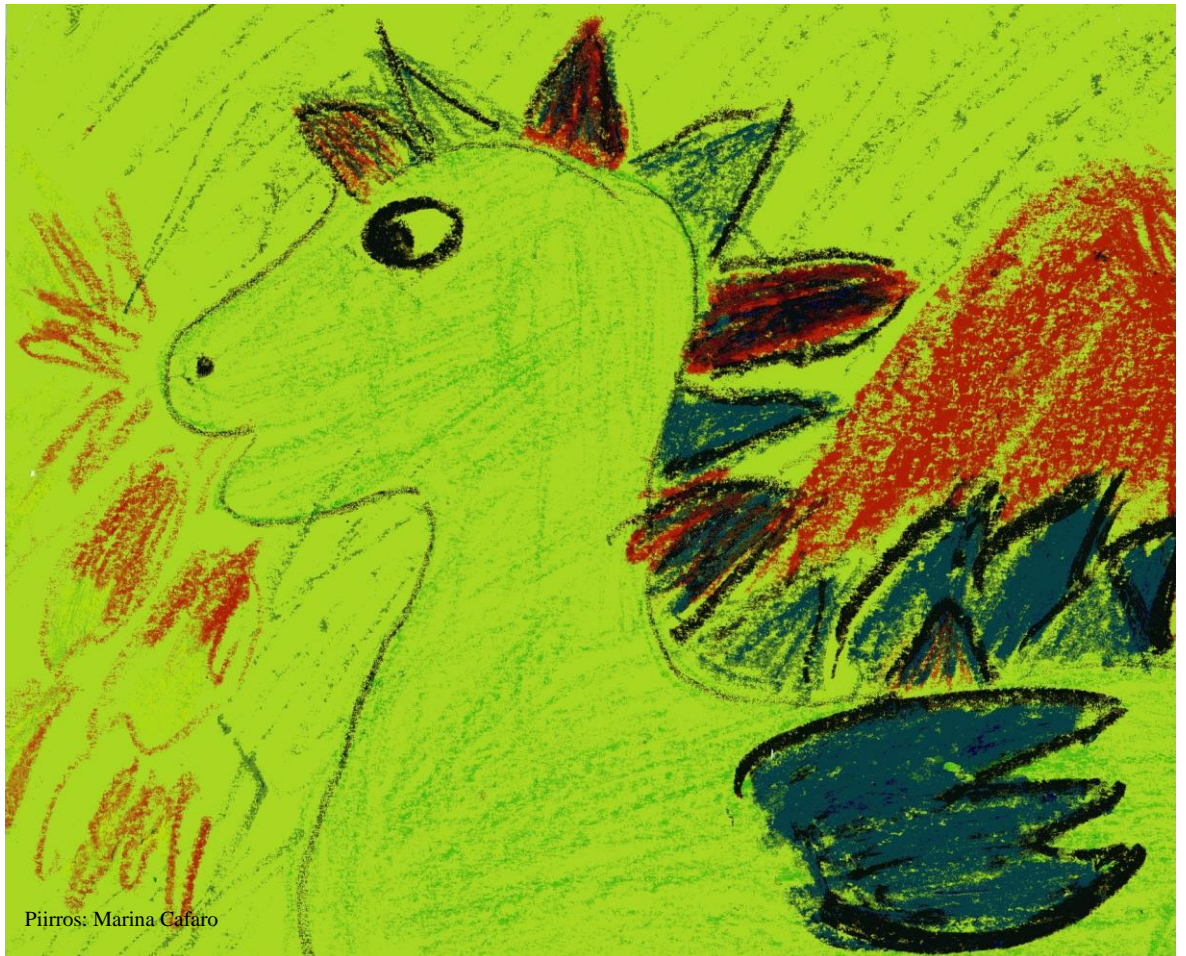
Piirros: Marina Cafaro