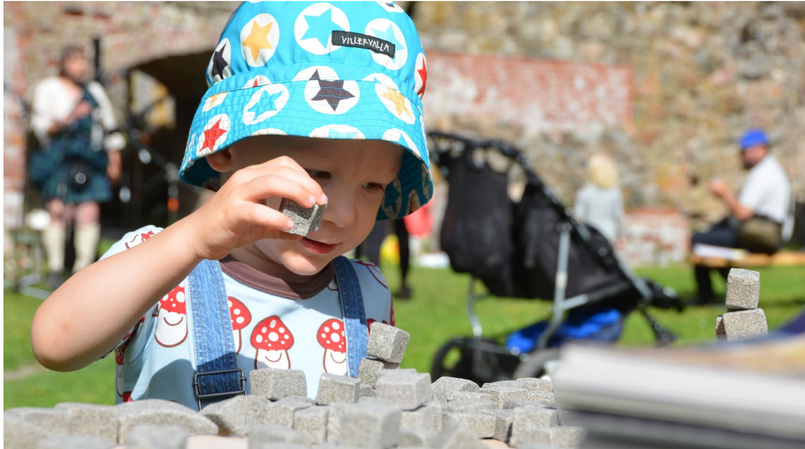
Kuva 1: Linnanrakennusta lapsille Kuusistossa.

Raaseporin linnanraunioilla, jossa ilta huipentui kuoro- ja tanssiesitysten, joen hengen vierailun, yhteisen illallisen, bändien musiikin ja lasten monien ohjelmanumeroiden jälkeen linnan muuriin heijastettuun valotaideteokseen, joka toi valoilla eläväksi linnan historian dramaattiset käänteet käärmeiden kärjäkivistä valkeaan neitoon.