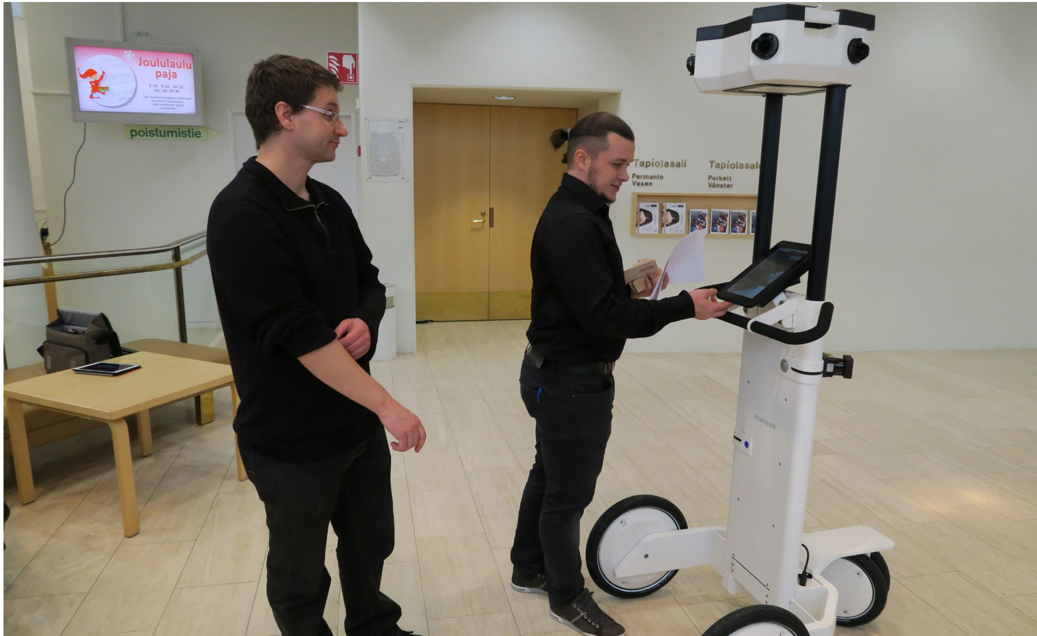
Uudenlaisilla 3D-mittauslaitteilla tuotetaan 3D-malleja kulttuuri- ja tapahtumatuotannon paikoista, esineistä ja hahmoista.