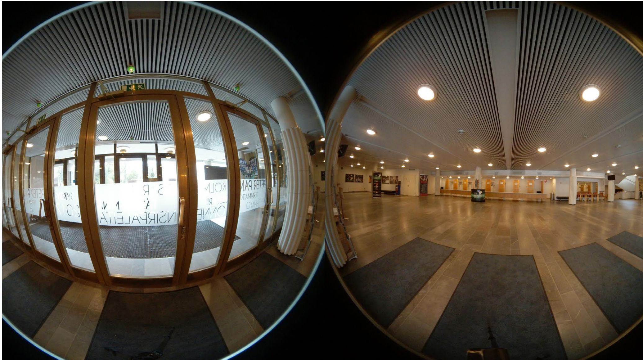
360-kuvat mahdollistavat virtuaalikierrroksia.

yleisesti se, että tuotantosuunnitelmat tehdään kaksikin vuotta etukäteen ja nopeaan reagointiin ei ole helposti tilaa. Nuoret taas reagoivat herkästi ja tarttuvat usein innokkaasti kaikkeen uuteen. Jyväskylän kaupunginteatterin tavoitteena on, että nuoret pääsevät hankkeen kautta kiinni uuteen teknologiaan ja sen mahdollisuuksiin. Tarkoituksena on nuorten osallistaminen teatterissa toimimiseen niin, että teatterin toimintaa lähestytään totutusta näkökulmasta poikkeavasti – nuorten näkökulmasta.