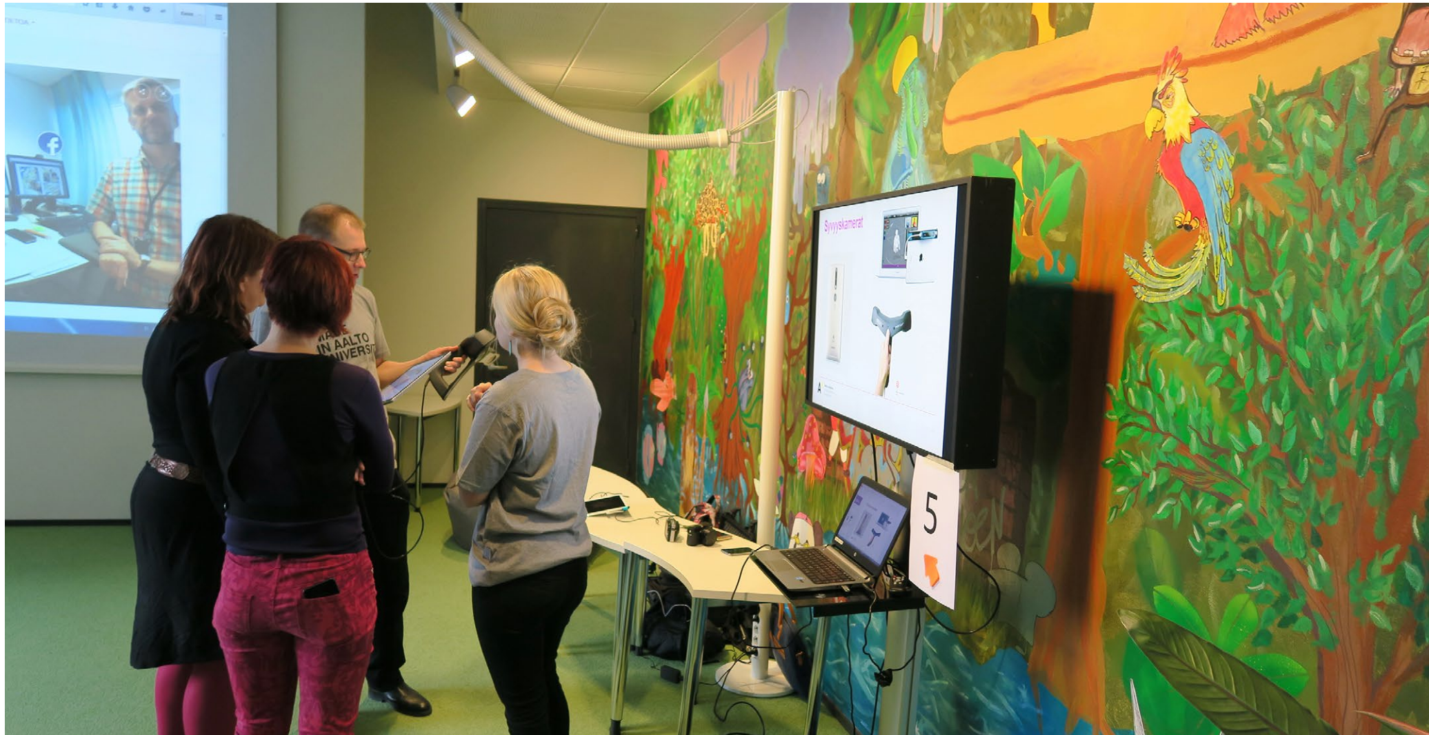
Lisää todellisuutta -päivä yhdisti Humakin Aallon ja Omnian osaamista.

kulttuurituottajan mahdollisuuksia toimia tiedetuottajana yliopisto- ja ammattikorkeakoulualalla. Kirja loi pohjaa keväällä 2017 haetulle 3D-kulttuurihubi EAKR-hankkeelle. Projektityhteistyö konkretisoitui 1.11.2017 käynnistyneessä hankkeessa.