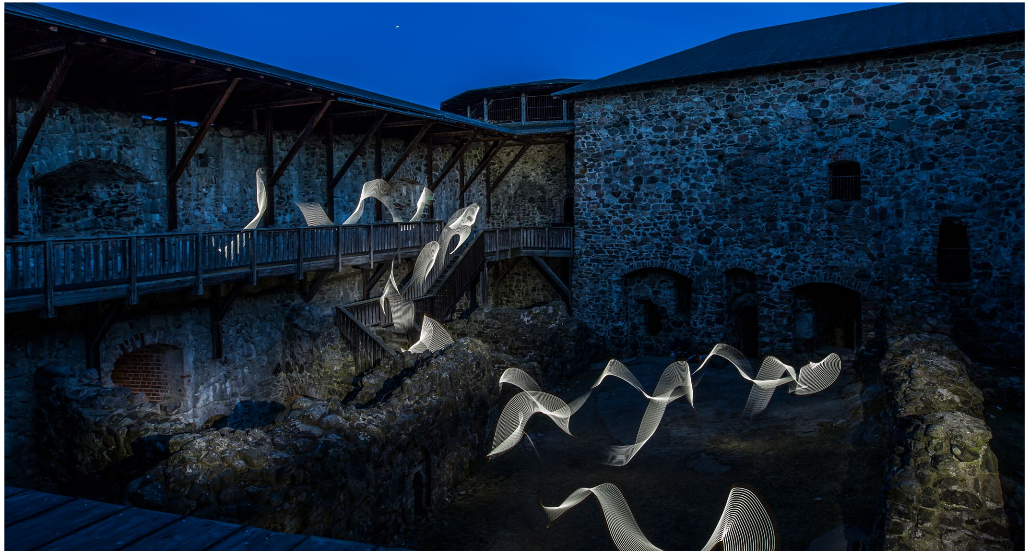
Kuva 3. Hengen jäljillä Raaseporissa (valomaalaus: Kirsi MacKenzie & Sari Vahersalmi, kuva: Sari Vahersalmi)

Kaikkien tapahtumien yleisömäärä ylitti järjestäjien odotukset ja sekä yleisöpalautte että medianäkyvyys olivat hehkuttavia. Syntyi valojen tuiketta historiallisilla paikoilla ja kivaa kipinöintiä paikallisten toimijoiden parissa siitä, mihin kaikkeen nämä miljööt taipuvatkaan. Onnistunut ilta kokonaisuutena – tosin tuotannollisessa mielessä voi jälkiviisaana todeta, että neljän ison yleisötilaisuuden järjestäminen samanaikaisesti neljässä eri osoitteessa on teoriassa ihan kiva idea, mutta kulttuurituotannollisesti painajainen, jossa kummituksia tulee muualtakin kuin historian hämäristä.