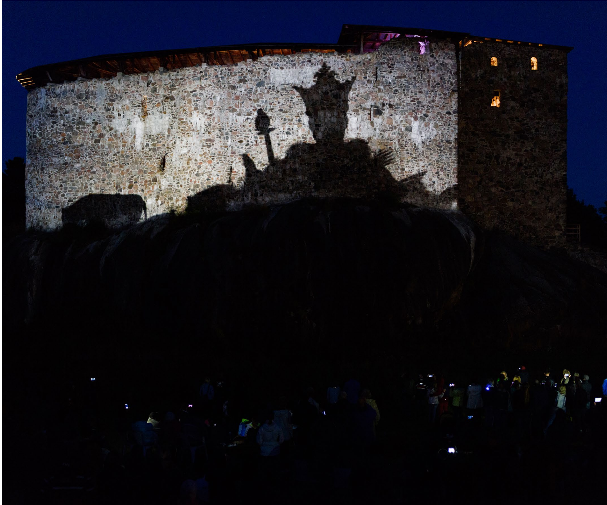
Kuva 4. Valotaideteos Reflection of History

Joulukuussa kokeiltiin Kuusistossa ja Raaseporissa vierailukauden laajentamista valon avulla myös joulunaikaan. Raunioiden hämärissä voi kulkea lyhdyn valossa ja kuulla kuorojen joululauluja, hiljentyä hartaushetkeen, nähdä tulitaidetta, tiernapojat tai Lucia-neidon kuoroineen, tavata historiallisia hahmoja ja tuoda oman koristeensa valaistuun joulukuuseen. Vuonna 2018 nähdään virolaisilla linnavuorilla Viro 100-hengessä heidän päätapahtumansa tämän vuoden tarinakävelyiden ja muiden pienimuotoisempien tempausten jatkoksi.