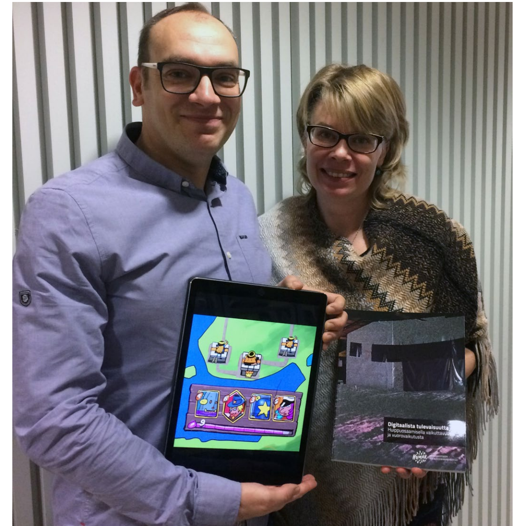
Yhteistyön yhtenä kulmakivenä on innovatiivinen julkaisutoiminta.

Virtuaaliseikkailu teatterin maailmaan -hankkeessa tehdään sähköisten kulttuuripalveluiden tuotantokokeilu sisältäen kolme osaprojektia teatteriympäristössä. Lisäksi mallinnetaan kehiteltyjä tuotantotapoja muualla hyödyn-