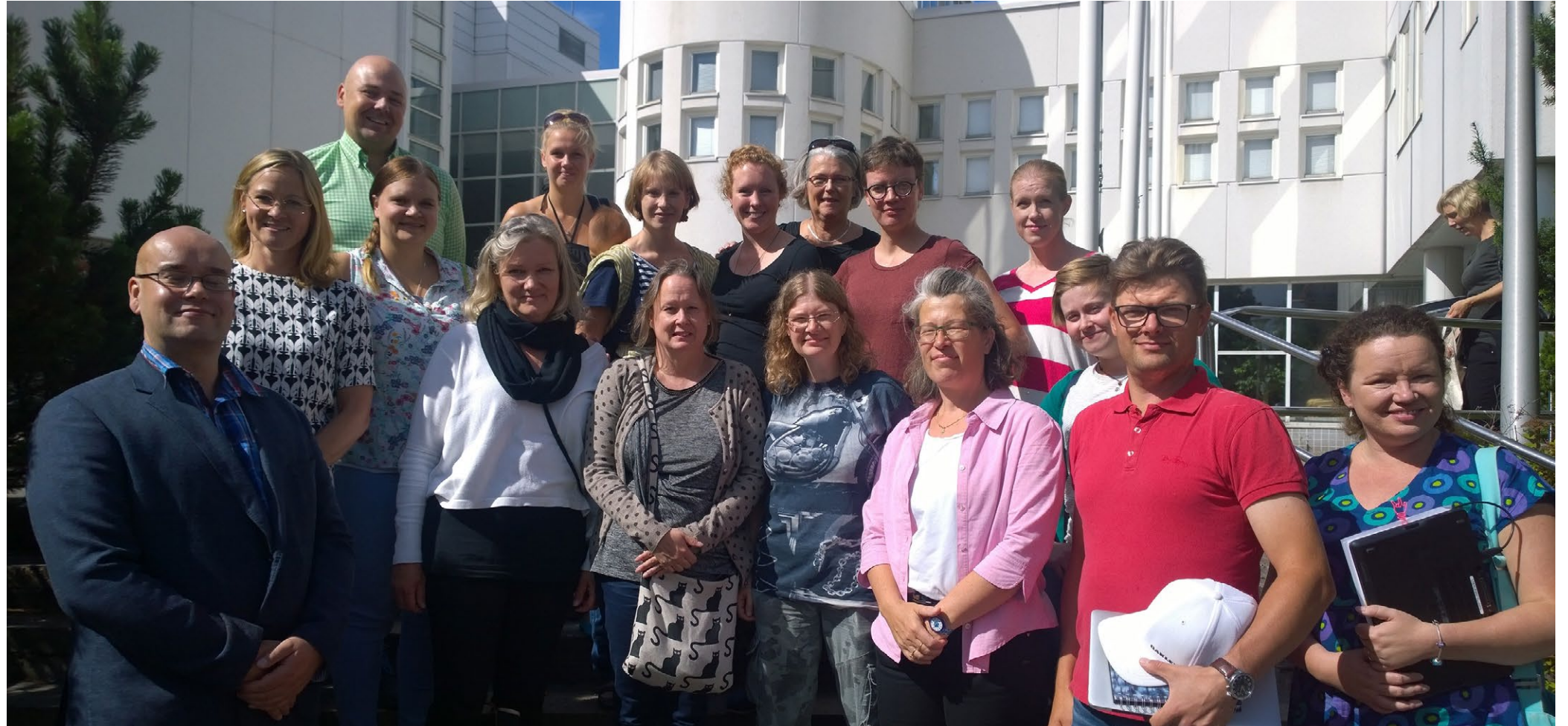
Livs - hankkeen kouluttajia ja opiskelijoita. Ensimmäiset suomenruotsalaisen viittomakielen asiantuntijat valmistuivat syksyllä 2017.

Viime vuosina kuurojen tulkkien tarpeeseen on herätty Euroopassa, sillä esimerkiksi maahanmuuttajille tulkkauksessa vaaditaan erittäin korkeatasoista kielitaitoa. Kuurot tulkit toimivat reletulkkeina, jolloin he tulkaavat asiakasta (jonka tuottama kieli voi olla hyvin haastavaa ymmärtää) kuulevalle tulkille. Kuuro tulkki toimii siis ns. ”syöttötulkkina” ja tulkaa kielensisäisesti. Kuuleva tulkki vastaanottaa viestin, jota kuuro tulkki on selventänyt ja huolehtii viestin tulkaamisesta puheelle. Samaa ketjua käytetään myös toisin päin: kuuleva tulkki tulkaa kuulemaansa viittomakielelle, kuuro tulkki taas selventää viestiä maahanmuuttajalle, jolle suomalainen viittomakieli on useimmiten vieras tai jopa täysin tuntematon kieli. Kyse on paitsi tulkkauksen kehittämisestä, mutta myös kielellisen saavutettavuuden edistämisestä kaikkein haavoittuvaisimmassa asemassa olevien henkilöiden parissa.