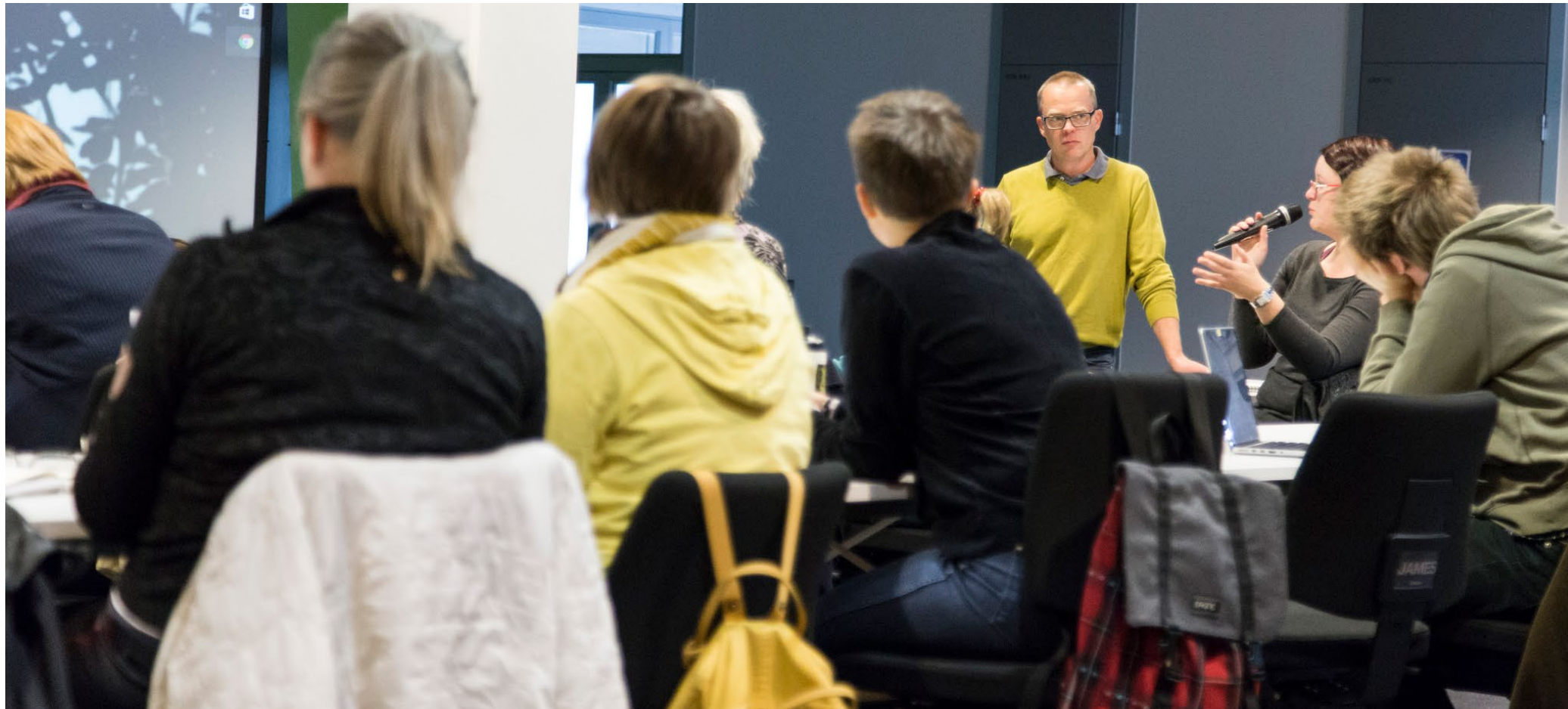
CCF - Culture Creative Fund kasvattaa luovan alan yritysten, tuottajien ja toimijoiden rahoitusosaamista ja etsii uusia rahoitusratkaisuja. Maksuttomia rahoitusvalmennuksia toteutetaan eri puolella Suomea. Lisätietoa löydät osoitteesta www.ccfund.fi