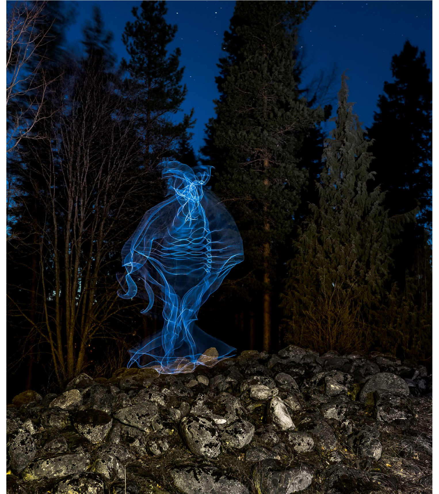
Video 1: Valotaideteos Reflection of His-tory https://vimeo.com/238382387