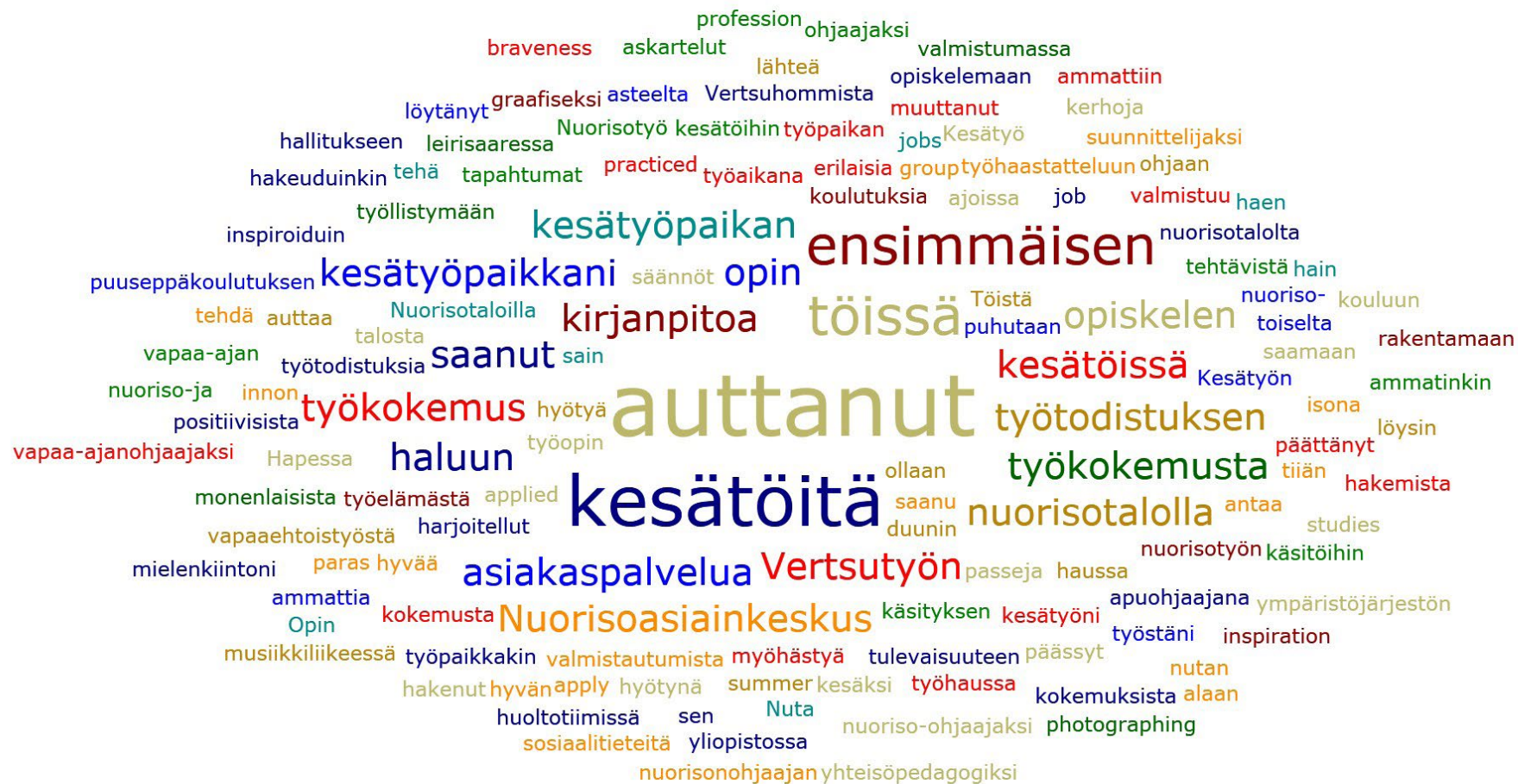
Kuva 1. Suomalaisen nuorten mainintoja, jotka liittyvät nuoren omaan työllistymispolkuun nuorisotyön avulla

prosessissa on se, että eri ryhmissä joudutaan neuvottelemaan nuorisotyön merkityksellisyydestä. Kyseessä on yhteinen oppimisprosessi, joka tuottaa yhteistä ymmärrystä nuorisotyöstä. Samalla tämä menettelytapa on hyvä esimerkki siitä, miten nuorisotyöntekijät, nuorisotyön hallinto ja tutkijat voivat kiinteässä yhteistyössä selvittää nuorisotyön laatua ja vaikuttavuutta.