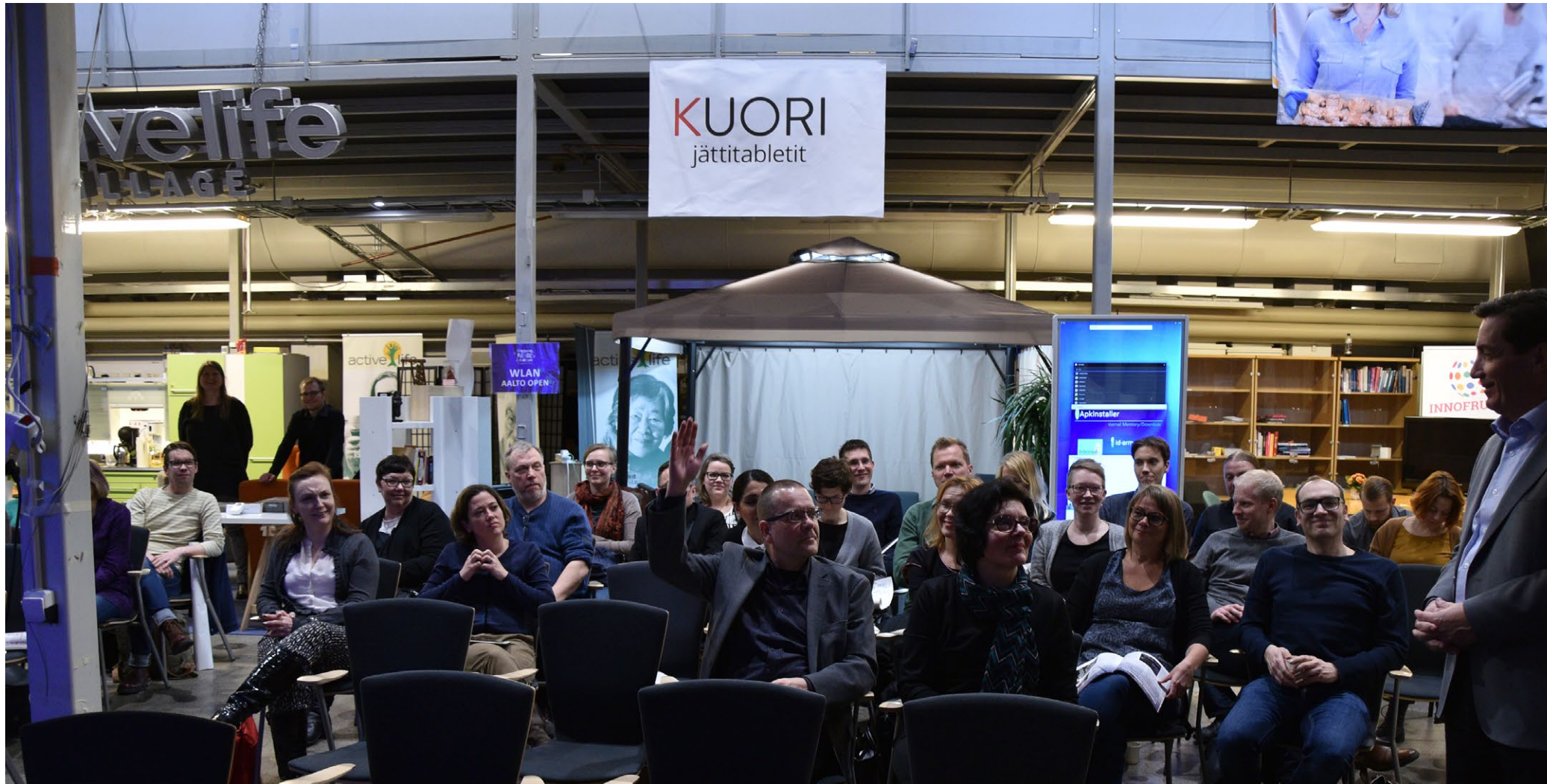
Humakin ja Aallon kulttuurituotannon muuttuvat toimintaympäristöt teemapäivä jatkoi yhteistyötä.

ta teknologiaa, tiedettä ja taidetta”. Näytelyssä tuotiin esille yhteistyötä Humakin kanssa esittelemällä yhteisiä avauksia ja tekemistä sekä yhteisiä hankkeita. Näyttelyn tarkoitus oli lisätä kaupunkilaisten tietoa 3D:stä, laserkeilauksesta ja fotogrammetriasta sekä niiden roolista ja vaikutuksesta yhteiskunnan ja kulttuurin kehitykseen.