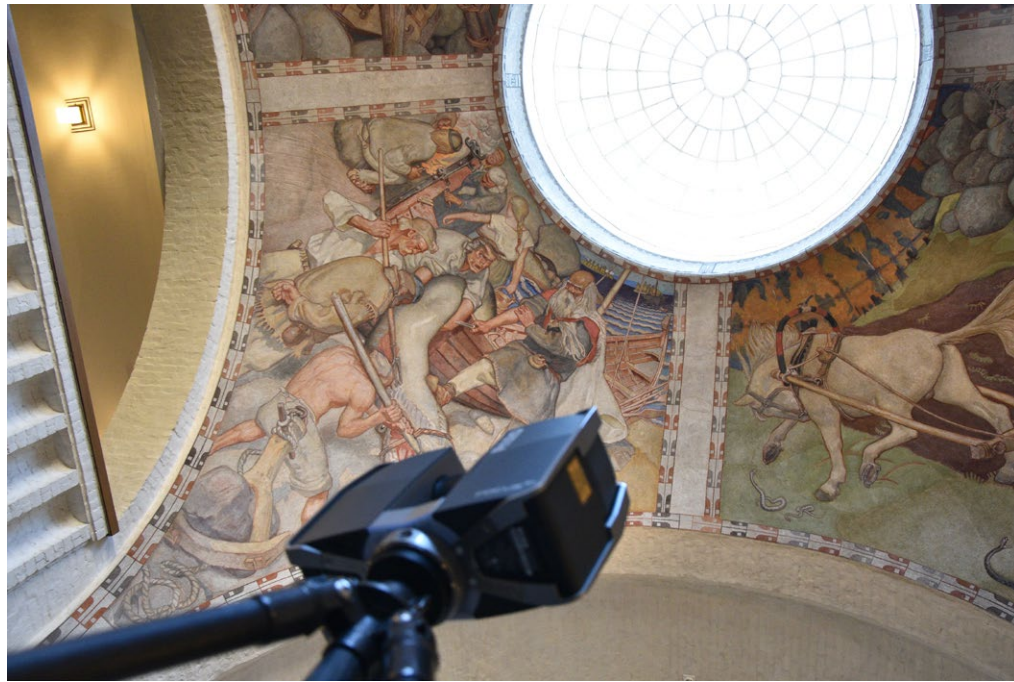
3D-kulttuurihubi toimii yhdistävänä kokeilualustana tuottaen lisäarvoa palveluiden kautta.