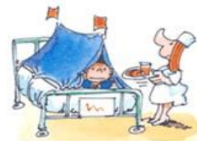
Kuva 1. Lasten ja nuorten oikeudet sairaalassa (Suomen NOBAB n.d.)

Lapsia tulee kohdella hienotunteisesti ja ymmärtäväisesti ja heidän yksityisyyttään tulee poikkeuksetta kunnioittaa.