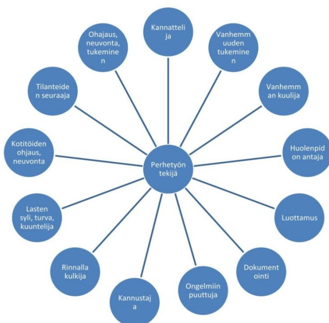
KUVIO 2. Perhetyöntekijän roolikartta

Laadin perhetyöntekijän roolikartan (kuvio 2), jossa pohdin perhetyöntekijän tehtäväkuva. Perhetyöntekijän työkuva on monialainen ja laaja. Se rakentuu yksilöllisesti perheen mukaan. Perhetyössä jokainen päivä on erilainen. Perhetyöntekijän rooli perheessä on olla auttavana kätenä ohjaamassa perhettä toimimaan lapsiperheiden arjen askareissa.