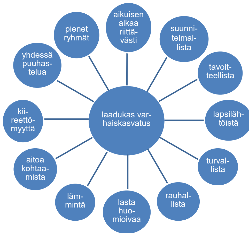
Kuvio 2. Lastentarhanopettajien laadukas varhaiskasvatus.

Haastateltavien näkemys laadukkaasta varhaiskasvatuksesta on hyvin yhtäläinen. Heidän mielestään laadukas varhaiskasvatus perustuu pieneen ryhmäkokoon ja siihen, että aikuisella olisi tarpeeksi aikaa lapsen aitoon kohtaamiseen sekä toiminnan suunnitteluun ja toteuttamiseen. Haastateltavien mukaan laadukkaan varhaiskasvatuksen tulee olla myös rauhallista ja turvallista yhdessä puuhastelua. (Kuvio 2.)