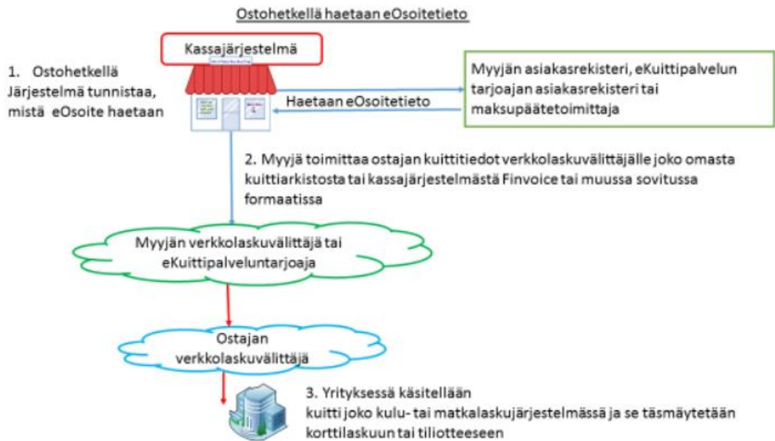
Kuvio 2. eOsoitetiedon hakeminen ostohetkellä (Liikenne ja viestintävirasto 2017, 24).

Ostotapahtumassa kassajärjestelmä hakee siis tietojen jakamista muista järjestelmistä tai palveluista, jotta eKuitti-data saadaan toimitettua ostajalle oikein tiedoin. Kassajärjestelmä lähettää kyselyn vastaanottajan tiedoista Finvoice-rakenteen mukaisesti. Yrityksiin kohdalla ostajan tiedot jaetaan kassajärjestelmälle, jolloin kassajärjestelmän ei tarvitse lisätä kyseistä tietoa itse, vaan se lähettää esitäytetyn sanoman. Esitäytetty sanoma palautetaan myyjän kassajärjestelmään, jolloin se on täydentynyt ostajan verkkolaskuosoitteella. Osoitteen kautta kerätään yrityksen alv-tunnus, nimi ja yhteystiedot sekä lupa lähettää tiedot takaisin kassajärjestelmälle. Kerätyt tiedot voidaan silloin lisätä myös kuittiin kassajärjestelmän toimesta ostotapahtumassa. Rakenne palautuu kassajärjestelmään ja voidaan välittää oikeilla tiedoilla taloushallintoon. (Web-rajapintakuvaus 2017, 1–2.)