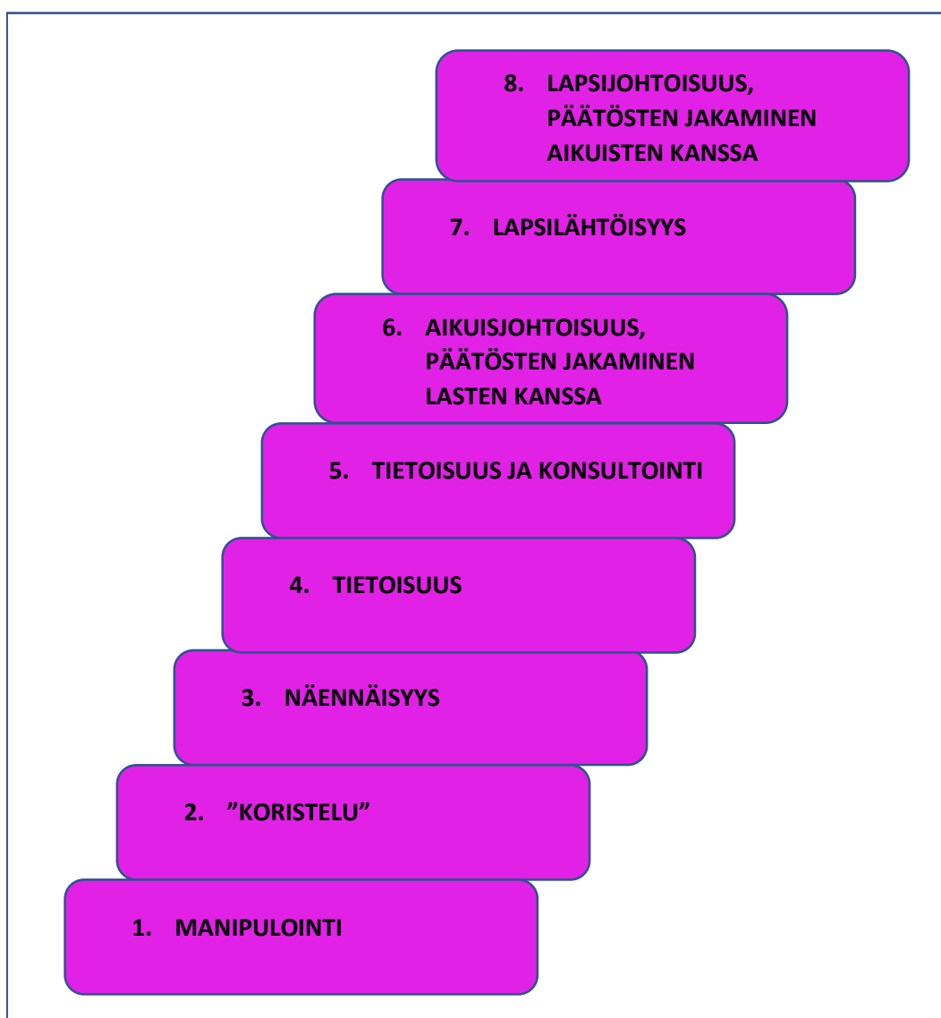
KUVIO 1. Osallisuuden tikapuut (Hart 1992, 8.)

(assigned but informed) lapsi ymmärtää projektin aikomukset ja on tietoinen siitä, kuka tekee päätökset ja miksi. Toiminta on lapselle mielekästä ja osallistuminen on vapaaehtoista. Tikapuiden viidennellä askelmalla (consulted and informed) toiminta on edelleen aikuisjohtoista, mutta lapsi ymmärtää, mistä toiminnassa on kyse ja lapsen mielipiteisiin suhtaudutaan vakavasti. Tällöin lapsen osallisuus alkaa lisääntyä. Kuudes askelma (adult initiated, shared decisions with children) on jo todellista osallistumista, koska lapset saavat osallistua myös päätöksentekoon. Seitsemännellä askelmalla (child initiated and directed) osallisuus on jo korkealla tasolla, koska toiminta on jo lapsilähtöistä ja -johtoista ja lapsi toimii yhteistyössä muiden kanssa. Viimeisellä eli kahdeksannella askelmalla (child initiated, shared decisions with adults) toiminta on lapsen aloittamaa ja johtamaa, ja päätöksiä jaetaan aikuisten kanssa.