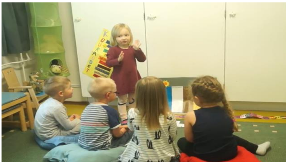
KUVA 7. Aamupiiri lasten leikkimänä.

Koska lapset heittäytyivät leikkiin niin hyvin, saimme kuvattua suoraan riittävän määrän videomateriaalia esittelyvideota varten. Näin meidän ei tarvinnut tehdä erillistä käsikirjoitusta lapsille tähän kohtaukseen. Luovaa leikkiä kuvatessamme, saimme parhaan kuvan siitä, millainen aamupiiri on lapsen näkökulmasta katsottuna. Oli hauska huomata, kuinka tarkkaan osa lapsista otti itselleen vetäjän roolin. Näytelmässä oli havaittavissa paljon samoja tapoja, eleitä ja ilmeitä, joita aamupiirin vetäjä ohjauksessaan käyttää.