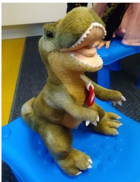
KUVA 3. Dinosaurus Martta