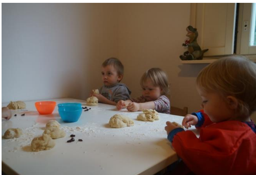
KUVA 5. Pullien leipominen.

Toiminnan havainnointi ja arviointi: Kaikki lapset lähtivät hyvin mukaan toimintaan. Pyrimme luomaan työpajassa kannustavan ilmapiirin ja näyttämään oman kiinnostuksemme lasten töitä kohtaan. Kehuimme myös jokaisen työtä toiminnan aikana, jonka uskomme rohkaisseen hieman epävarmojakin piirtäjiä. Eräs lapsista kertoi, että haluaisi piirtää pullan ja emännän suun, joka hymyilee näin (näyttäen itse esimerkkiä), muttei oikein osaa piirtää. Kannustimme häntä kuitenkin piirtämään ja korostimme, että tärkeintä on mitä hän itse piirustuksessaan näkee, jolloin hän jatkoi piirustuksen tekoa. Ensimmäisen ryhmän "vuoropenkki" sijaitsi työpajan vieressä ruokailutilassa. Tila oli hieman rauhaton, koska oma emäntä oli keittiössä työn touhussa. Siirsimme "vuoropenkin" päiväunitiloihin, jossa kävimme muiden ryhmien tuotokset läpi. Osa lapsista oli videokuvauksesta innoissaan esitellen omaa työtään innokkaasti kameralle työn eri vaiheissa. Yksi lapsista vierasti kameraa, eikä halunnut tässä tilanteessa kertoa omasta työstään. Kysyimme myöhemmin hänen työstään ilman kameran läsnäoloa. Lasten toiveita ruoanlaittoon liittyen olivat porkkana, appelsiini, hillo, letut, leipä, maito sekä pullat. Päädymme henkilökunnan kanssa siihen, että teemme yhdessä lasten kanssa pullia (kuva 5), koska tämä toive tuli esille useammalta lapselta. Lisäksi sovimme, että leipomispäivänä tarjolla on myös porkkanoita ja appelsiineja.