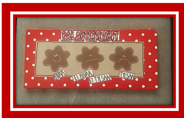
Kuva 2. Palautepipareiden ohjetaulu

Jokaisen kokkikerhokerran jälkeen osallistujat saivat antaa ohjetaulun (kuva 2) mukaisesti palautetta pienillä piparinaamatarroilla. Valintansa mukaisesti he ilmaisivat, oliko kerho kerralla ollut heidän mielestään kivaa , ei kivaa/ei tylsää vai tylsää . Yhteensä keksipurkkeja (kuva 3) tuli neljä ja kaikkiin purkkeihin ker- holaisilta ja apukokeilta ilmestyi pelkkiä hymynaamapipareita. Palautepiparei- den lisäksi pyysin heiltä kerhotapaamisten aikana, kerhokertojen välillä ja ker- hon päättymisen jälkeen suullista palautetta.