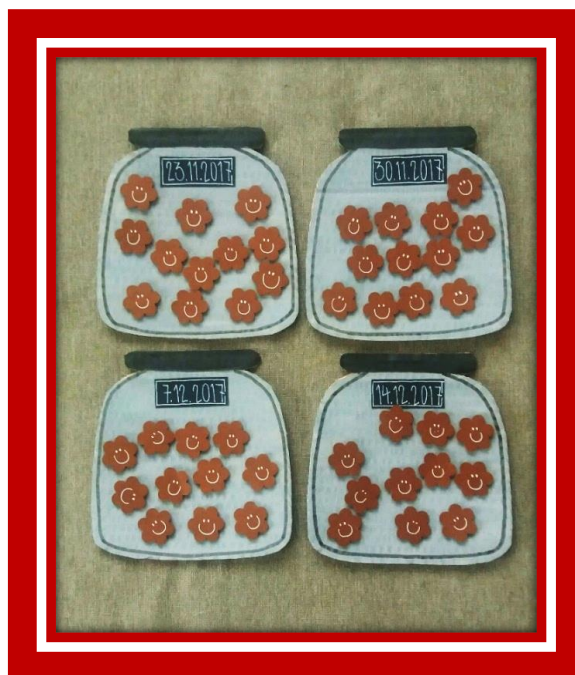
Kuva 3. Palautepareiden keksipurkit kaikilta kokoontumiskerroilta

Palautetta kerättiin vielä lopuksi haastattelemalla kerholaisia noin kuukausi kerhopilotin päättymisen jälkeen. Haastattelujen perusteella kerholaiset muistelivat kerhoa erittäin myönteiseksi kokemukseksi. Suurin osa oli sitä mieltä, että kerhokertoja oli ollut sopivasti, yhden haastatellun mielestä kerhokertoja olisi saanut olla enemmän. Tilaa muisteltiin vähän ahtaaksi ja apukokkeja mukaviksi. Uutena opittiin pikkuleipien tekemistä, erilaisia kattamistapoja sekä uusia tyylejä taitella lautasliinoja. Opittiin myös isojen veitsien käyttöä, täytettyjen sämpylöiden leipomista ja aurajuuston yhdistäminen makeaan leivonnaiseen. Kaikki haastateltavat toivoivat, että kokkikerho jatkuisi jossain vaiheessa.