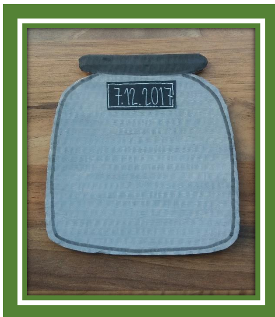
Kuva 1. Kexipurkki palautepipareille

Suullisen palautteen pyytäminen kyseiseltä asiakasryhmältä oli luontainen valinta, sillä kaikki eivät olleet luku- ja kirjoitustaitoisia. Suullista palautetta oli myös helppoa ja nopeaa saada, ja siinä samalla pystyi havainnoimaan kerholaisten ja apukokkien ilmeitä, kehonkieltä ja äänenpainoja. Suullisen palautteen lisäksi keräsin palautetta niin sanottujen palautepipareiden avulla. Jokaiselle kerhokerralle askartelin oman keksipurkin (kuva 1), johon kerholainen sai tapaamiskerran jälkeen valita omasta mielestään kerhokertaa kuvailevan piparin ilmeineen. Palautepipareiden käytöllä oli tarkoitus lisätä kerholaisten osallisuutta palautteenantotilanteessa.