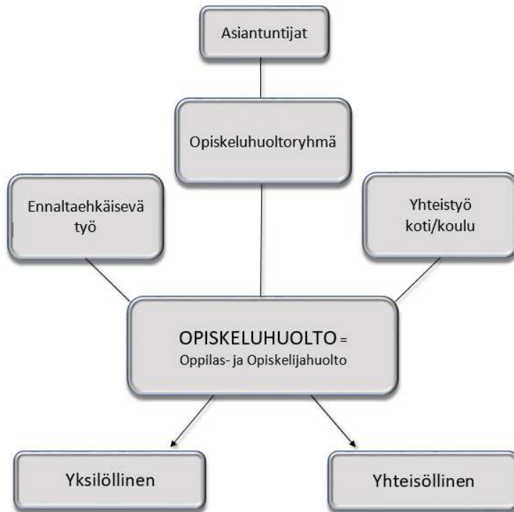
Kuva 1. Opiskeluhuollon kaavio

Yhteisöllisellä tasolla terveyden edistäminen edellyttää erilaisia toimintatapoja, mutta edelleen näiden toimien tulee pohjautua samaan arvopohjaan. Oppilas on palvelukokonaisuuden keskeinen toimija. Oppivelvollisuus määrittää nuorelle oikeuden opetukseen ja koulun, nuoren päivittäiseksi toimintaympäristöksi. Tämän perusteella oppilaalla tulee olla oikeus terveelliseen ja turvalliseen opiskelu-ympäristöön. Opetuksen järjestämisen lähtökohtana on oppilaiden ja henkilökunnan turvallisuuden takaaminen kaikissa tilanteissa. Turvallisuuden ja hyvinvoinnin edistäminen on osa oppilaitoksen toimintakulttuuria, ja se otetaan huomioon kaikessa oppilaitoksen toiminnassa. (L629/1998.)