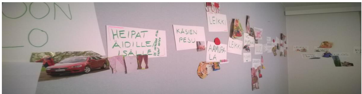
Kuva 1. Päiväkarta.

Kävimme päivää läpi hoitoon tulosta kotiinlähtöön, aluksi keskustellen ja sitten lapset etsivät kuvia tai tekivät piirroksia kutakin hetkeä havainnollistamaan. Päiväkarta koottiin päiväkodin tyhjimmälle seinälle (kuva 1). Todellisuus kuitenkin on, että päivässä on olemassa tietyt ”rakenteet” joita ei loputtomiin voi siirtää tai jättää pois ja liikkumavara on näiden ympärillä (aamupala, ruokailu, lepo, välipala). Päiväkarta rakentaessa kävi ilmi, että varsinkin isommat lapset löysivät päivästä nämä tilanteet sekä sen, miksi niitä ei voi jättää kokonaan pois. Pohdinnat lisäävät varsinkin Turjan (2016) mainitsemaa tieto-osallisuutta. Kun päivän rakentuminen on lapsille selkeästi hahmottunut, on heidän myös helpompi olla vaikuttamassa sisältöihin ja tehdä sellaisia ehdotuksia, jotka on mahdollista toteuttaa ja näin huomata oma vaikuttamisensa.