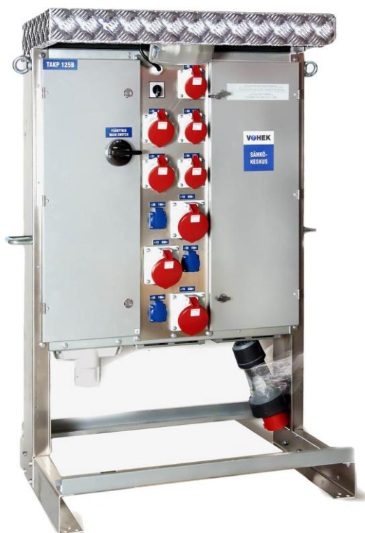
Kuva 2. 125A:n työmaakeskus.

Työmaakeskukset valitaan aina sen mukaan, minkälaisia koneita siihen kytketään. Rakennustyömailla käytetään yleensä 125A:n, 63A:n, 32A:n ja 16A:n työmaakeskuksia. VOHEK:n 125A:n keskuksessa on kolme 63A:n (400V) lähtöä, kaksi 32A:n (400V) lähtöä, kolme 16A:n (400V) lähtöä ja kolme 16A:n (230V) lähtöä. VOHEK:n 63A:n työmaakeskuksessa on lähtökohtaisesti yksi 63A:n (400V) lähtö, kaksi 32A:n (400V) lähtöä ja keskuksesta riippuen eri määrä 16A:n lähtöjä (400V ja 230V). 32A:n työmaakeskuksessa on keskuksesta riippuen eri määrä 230V ja 400V 16A:n lähtöjä. Kuvassa 2 on esitetty tyypillinen 125A:n työmaakeskus.