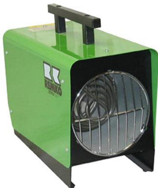
Kuva 7. 9kW:n sähkölämmitin.