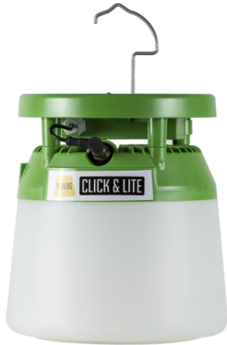
Kuva 6. 48V:n LED-valaisin (vihreäkantaisessa akkuvarmenne).