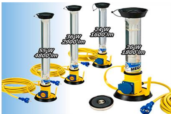
Kuva 4. 230V:n loisteputkivalaisimet.

LED-työmaavalaisin on ämpärin mallinen. Sitä ei ole tehty siirrettäväksi vaan ripustetaan sillä periaatteella, ettei tarvitsisi hirveästi siirtää. LED-valaisin tarvitsee myös muuntajan väliin. Muuntaja käyttää 230V:n syöttöä. Kuvissa 4-6 on esitetty tyypillisiä työmailla käytettäviä valaisinkalustoa.