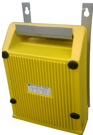
Kuva 5. LED-muuntaja.