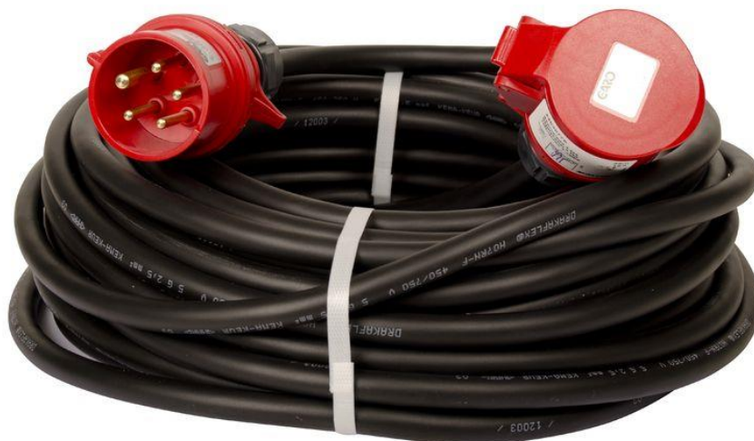
Kuva 3. 63A:n jatkokaapeli uros- ja naaras-tulpalla.

Kaapelit valitaan sen mukaan, mistä lähdöstä jaetaan mihinkin keskukseen: valittava kaapeli aina sen kokoinen, mikä lähtökin on. Eli esimerkiksi 63A:n lähtöön valitaan aina 63A:n jatkokaapeli. Kaapelien kummassakin päässä on tulppa, jollei toista päätä kytketä johtimilla. Kaapelin toiseen päähän kytketään pistotulppa eli ns. ”uros”-tulppa ja toiseen päähän kytketään jatkopistorasia ns. ”naaras”-tulppa. Kuvassa 3 on esitetty tyypillinen 63A:n jatkokaapeli.