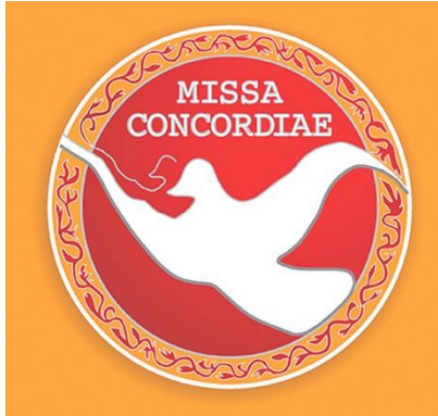
Kuva 1. Alkuperäisen Missa Concordiaen mainoskuva. ( http://www.lasse.net/index.php/our-store/cd/missa-concordiae-detail )