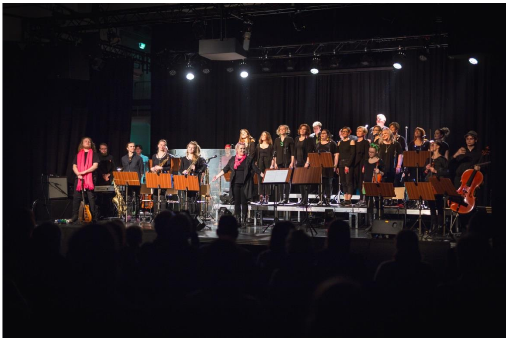
Kuva 7.