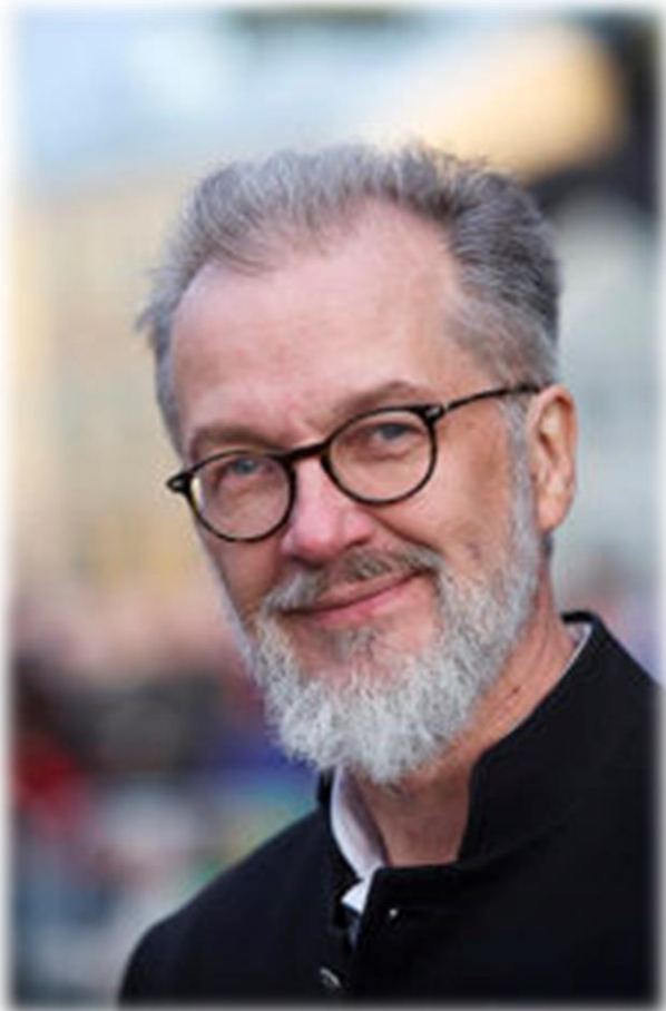
Kuva 2. Lasse Heikkilä, ( www.uusitie.com/suomalaisen-messun-sanoma-vetoaa-yha/ )

Lasse Heikkilä on vuonna 1961 syntynyt Tamperelainen muusikko. Hän on säveltänyt messuja, musikaaleja ja kirjoittanut lukuisia hengellisiä ja yhteiskunta-aiheisia lauluja eri artisteille.