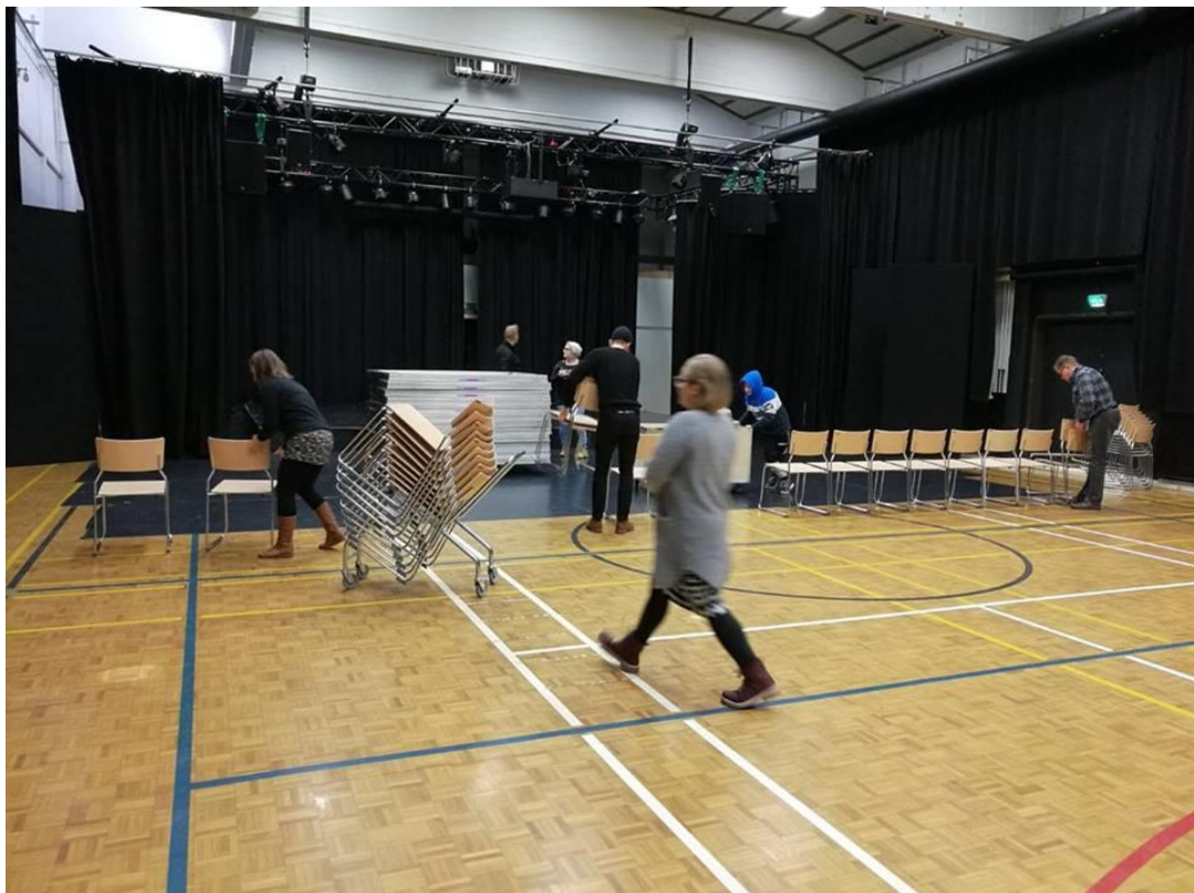
Kuva 12. Lavan ja katsomon rakentamista.