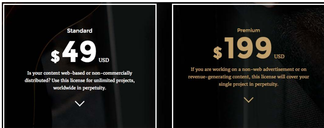
KUVA 4. Hinnoittelukaavake Premium Beatin lisensseistä.

Lisenssejä löytyy kaksi erilaista, joiden erottavana tekijänä on projektin kaupallisuus ja tv-esitys, poislukien pilotit. (Premium Beat 2017.)