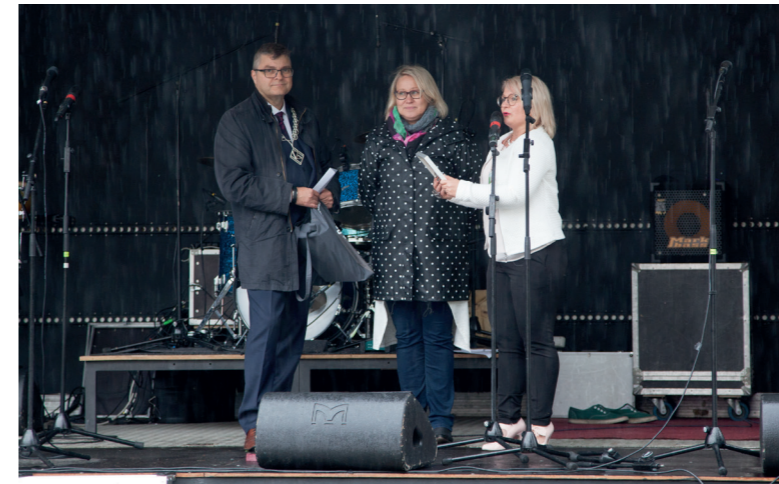
← ↓ Lukuvuoden avajaisissa palkittiin ensimmäistä kertaa vuoden alumni, työntekijä, työpari, työttiimi sekä vuoden opiskelija ja opiskelijaryhmä.