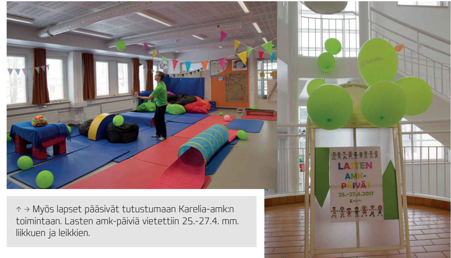
↑ → Myös lapset pääsivät tutustumaan Karelia-amk:n toimintaan. Lasten amk-päiviä vietettiin 25.-27.4. mm. liikkuen ja leikkien.

kulttuuri-iltapäivään osallistuneesta Karelian työntekijästä Karelia lahjoitti 10 euroa/osallistujaa Joensuun Pelastakaa lapset ry:lle käytettäväksi vähävaraisten perheiden lasten lukiokirjahankintoihin. Juhlavuosi huipentui henkilöstön juhlagalaan marraskuussa, johon osallistui 155 henkilöä. Juhlagaalassa palkitsimme 31 karelialaista 25 vuoden työurasta Keskuskauppakamarin hopeisin ansiomerkein. Juhlavuoden viimeinen tapahtuma oli joulukuussa Helping Hand -tapahtuma, jossa teimme puoli päivää vapaaehtoistyötä päiväkodeissa, kouluissa ja Siun Sotessa ikäihmistien palveluissa. Vuoden aikana järjestimme studia generalia -luentosarjan, joka käsitti yhteensä kahdeksan luentoa.