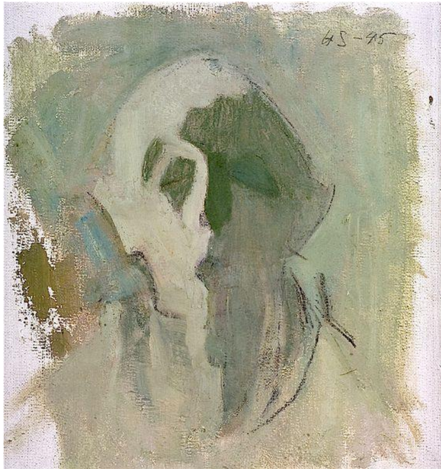
Kuva 2 Helene Schjerfbeck Omakuva, 1945, yksityiskokoelma

Hänen elämänsä ei ollut itsestään selvä, eikä yksinäisyys ollut välttämättä toivottu, ainakaan niin suuressa roolissa, jossa se loppujen lopuksi oli. Yksinäisyydestä tuli Schjerfbeckin historian ja taiteen merkittävä tekijä. Hänen äitinsä menehdyttyä hän muutti yksin Tammisaareen vuonna 1925. Siellä hän maalasi yksin- paljon ja intensiivisesti, välittämättä mistään mitä muualla hänen ympärillään tapahtui.