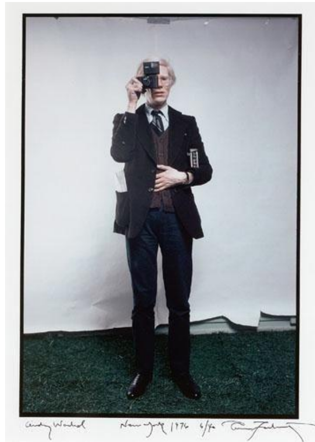
Kuva 3, Andy Warhol, 1976

Francisco de Goya, Helene Schjerfbeck ja Andy Warhol ovat eri aikansa ihmisiä, mutta on mielenkiintoista ajatella kaikkien näiden taiteilijoiden kokemuksia yksinäisyydestä ja sitä miten taide yksinäisyydessä eli. He pääsivät mahdollisesti juuri yksin ollessaan jonkun elämellisen vietin vapaaksi ja pystyivät kohdistamaan sen taiteeseen. He täyttivät myös yksinäisyyden luoman tyhjän olon ja tilan taiteella.