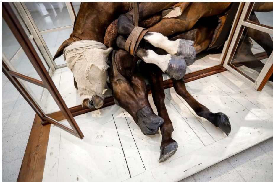
No life lost - Berlinde de Bruyckeren / Sara Hilden 2018

Välillä törmäämme taidenäyttelyissä hyvinkin vaikeisiin aiheisiin, joita taiteilijat haluavat taiteellaan nostaa esiin. Ne voivat olla psyykkisesti tai fyysisesti rankkoja, joskus jopa katsojaa shokeeraavia ja järkyttäviä. Ja monesti tapaamme melkein tynnen taiteilijan, joka kertoo taiteellisesta prosessistaan. Hän on kuin kartoittanut itsensä aiheeseen sitä tehdessään ja avaa tynnosti ajatuksiaan. Nostan esimerkiksi Kuvanveistäjä Berlinde de Bruyckeren. Hänen mykistävät veistoksensa kuolleista hevosista saa katsojansa seisautumaan. Kiinnitin huomiota hänen haastatteluunsa, joka sattumalta näin televisioista hänen avatessaan näyttelyä Tampereelle Sara Hildenin taidemuseoon. Hän oli hyvin tynni ja rauhallinen selittäessään hevosten symboliikkaa ja niiden roolia sodan kauhuissa.