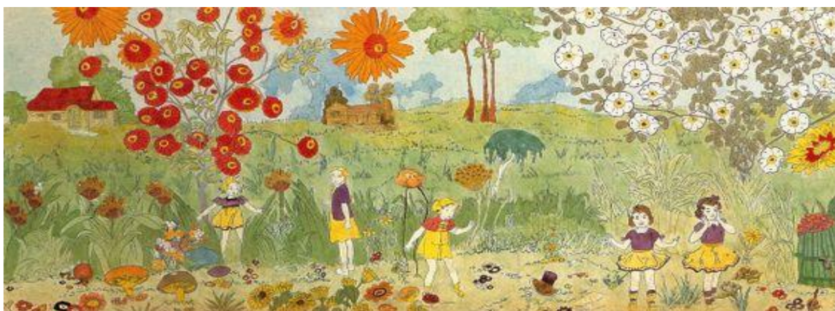
Henry Darger (1892-1973) Watercolor, pencil, carbon tracing and collage on pieced paper, 24x108 1/4 in. Collection of the American Folk Art Museum, New York

Henry Darger, kirjan kolmas taiteilija on hieman outona pidetty taiteen tekijä, joka löydettiin roskakatoksesta 80-vuotiaana. Hän oli viettänyt siellä elämästään noin parisen kymmentä vuotta, piileskellen yksin eristäytyneenä yhteiskunnalta. Hän kuitenkin sairastui elämäntavoistaan ja hänet pelastettiin sekä pakotettiin katolilaisen kirkon suojiin pois kadulta. Kirkossa asuessaan hänelle järjestettiin niin puhtaat vaatteet, ruokaa kuin oma huoneisto. Ajan kuluessa kävi myös ilmi hänen outo himonsa tehdä maalauksia.