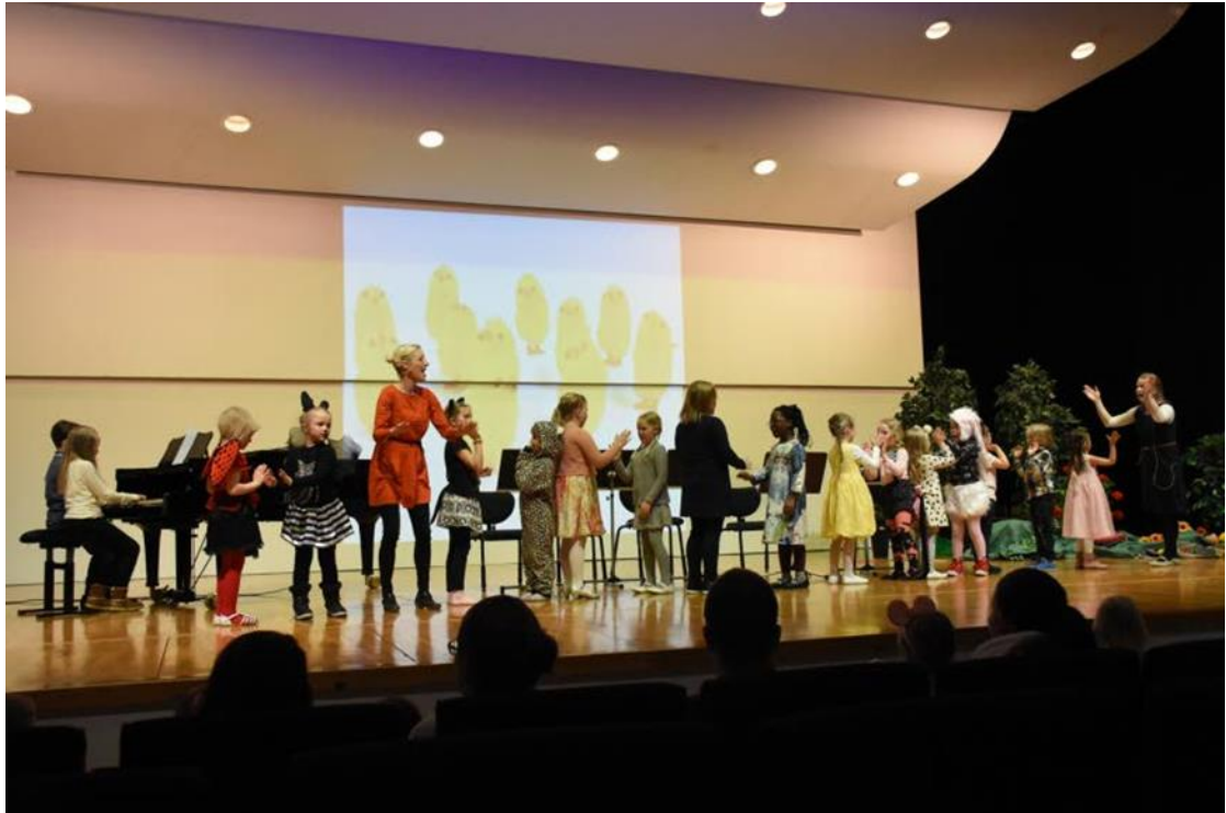
Kuvio 1: Eläinten vuosi -konsertti, Rouva kanan jumppa.

ten välillä. Konsertin jälkeen pää oli tavanomaisesti pyörällä, mitähän tässä juuri tapahtui, menikö kaikki niin kuin piti ja ovatko lapset löytäneet vanhempansa? Mieli oli iloinen ja helpottunut.