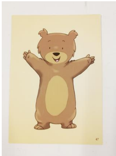
KUVIO 2. Yksi lapsista valitsi Nallekortin nro. 47 kuvastamaan vapaaehtoista.

Lapsi: "Nooooh että se vilkuttais tai että se vaikka tulee halaamaan." (kuva 2)