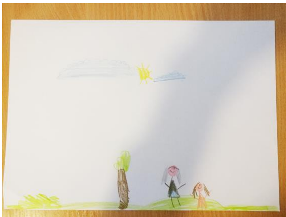
KUVIO 1. Yksi lapsista piirsi itsensä ja vapaaehtoisen ulkoilemassa.

Lapsi: "Nooo sen kans käydään kaikissa paikoissa, se ku käydään vaik elokuvissa tai ku se tulee tänne."