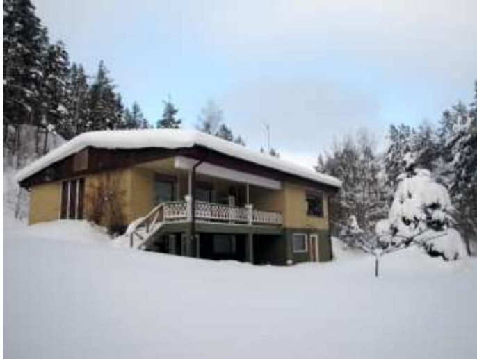
Kuva 1: Kalliopuron pienryhmäkoti

Tiloja ei ole suunniteltu aggressiivisia lapsia varten, joka tarkoittaa mm. sitä, että Kalliopuron ikkunat eivät ole iskun kestäviä. Hätätilanteita varten Kalliopuron keittiö on lukittavissa. Muita lukittavia tiloja ovat lääkekaappi ja ohjaajien toimisto. Lasten omia huoneita ei ole mahdollista lukita. Kalliopuron palo- ja pelastussuunnitelma sekä omavalvontasuunnitelma päivitetään 6 kk välein. Kalliopuron johdon vastuulla on huolehtia suunnitelmien voimassaolosta. (Broman, D. Broman, S., haastattelu)