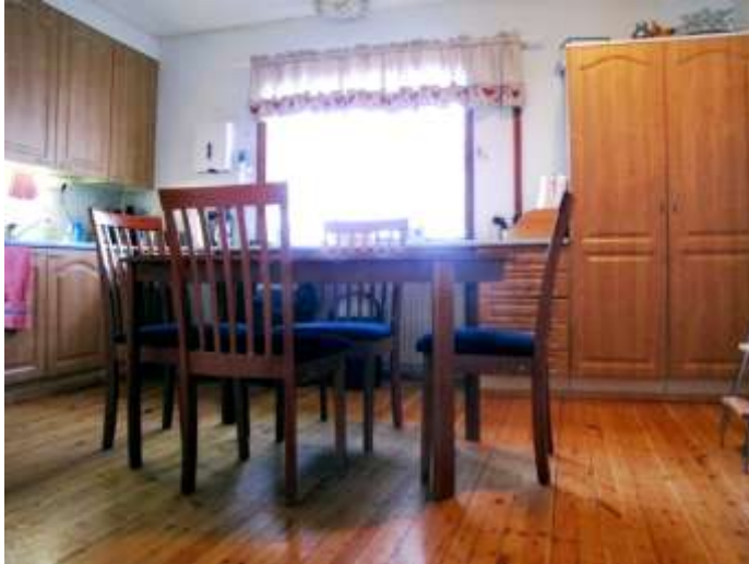
Kuva 5: Kalliopuron pienryhmäkodin keittiö