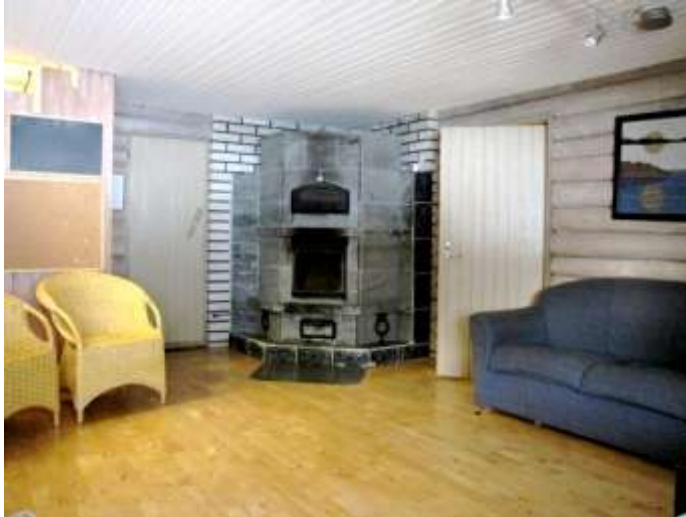
Kuva 3: Kalliopuron pienryhmäkodin takkahuone