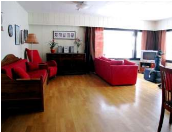
Kuva 2: Kalliopuron pienryhmäkodin olohuone

Tiloja ei ole suunniteltu aggressiivisia lapsia varten, joka tarkoittaa mm. sitä, että Kalliopuron ikkunat eivät ole iskun kestäviä. Hätätilanteita varten Kalliopuron keittiö on lukittavissa. Muita lukittavia tiloja ovat lääkekaappi ja ohjaajien toimisto. Lasten omia huoneita ei ole mahdollista lukita. Kalliopuron palo- ja pelastussuunnitelma sekä omavalvontasuunnitelma päivitetään 6 kk välein. Kalliopuron johdon vastuulla on huolehtia suunnitelmien voimassaolosta. (Broman, D. Broman, S., haastattelu)