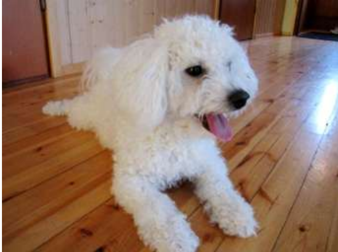
Kuva 4: Napoleon - koira

Kalliopurossa jokaiselle lapselle nimetään omaohjaaja, jonka tarkoituksena on olla lapselle lähin aikuinen sijoituksen ajan. Omaohjaaja nimetään lapselle, kun tämän on katsottu jo asettautuneen sijoituspaikkaansa, jolloin lapselle annetaan mahdollisuus vaikuttaa siihen kenestä tulee hänen omaohjaajansa. Omaohjaajan tehtävänä on hoitaa lasta koskevia päivittäisiä asioita, kuten koulun käyntiin ja terveydenhoitoon liittyviä kysymyksiä ja mahdollisesti yhteyksiä harrastustoimintaan. Kalliopurossa on ollut käytössä ns. omaohjaajapäivä, jolloin ohjaaja ja lapsi viettävät aikaa yhdessä. Omaohjaajapäiviä järjestetään lapsen omien toiveiden mukaan. (Broman, D. Broman, S., haastattelu) Omaohjaaja pyrkii toimimaan omaohjattavansa kanssa tiiviissä vuorovaikutussuhteessa, huomioiden lapsen yksilölliset tarpeet. Kalliopurossa pyritään kuitenkin siihen, että lapselle annetaan mahdollisuus ja tuetaan saavuttamaan tiivis ja luottavainen vuorovaikutussuhde myös muihin pienryhmäkodin työntekijöihin. Kokonaisvastuu lapsen kasvatuksesta ja kehityksestä on koko henkilökunnalla. (Kalliopuron hoitokoti Oy, asiakirja)