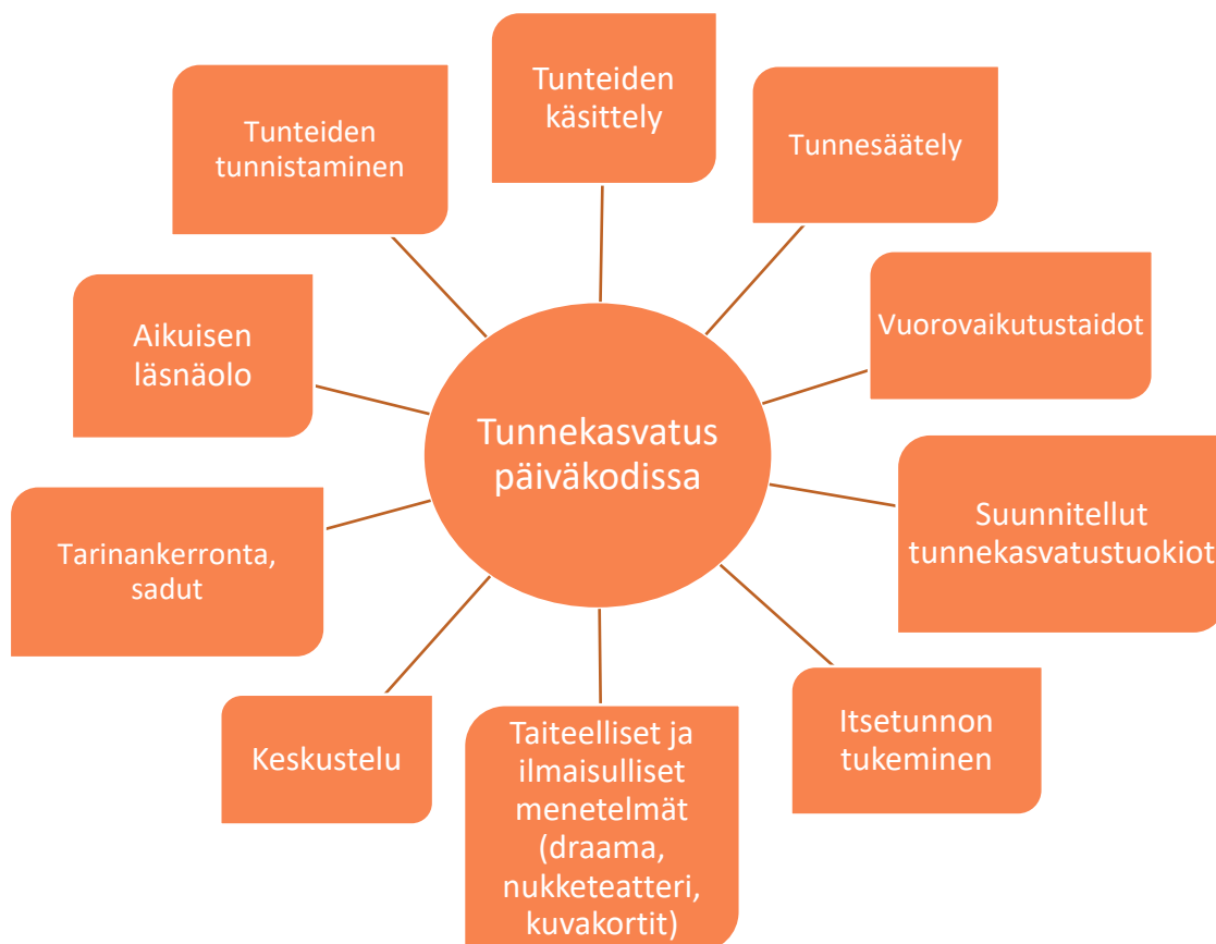
Kuva 2. Tunnekasvatus päiväkodissa

Tunteita käsitellään vastaajien mukaan päivittäin tai useamman kerran viikossa lasten kanssa päiväkodissa. Tällä hetkellä päiväkodissa ei ole käytössä tunnetaitoihin liittyvää menetelmää tai opetusohjelmaa. Päiväkodilla ei myöskään ollut kyselyn ajankohtana tarkasti määriteltyä, kuinka useasti tunnekasvatusta ja tunteiden käsittelyä tulisi harjoittaa arjessa. Päiväkodin työntekijöiden henkilökohtaiset eroavaisuudet vaikuttivat siihen, kuinka paljon tunnekasvatusta käytiin läpi ja millaisin keinoin.