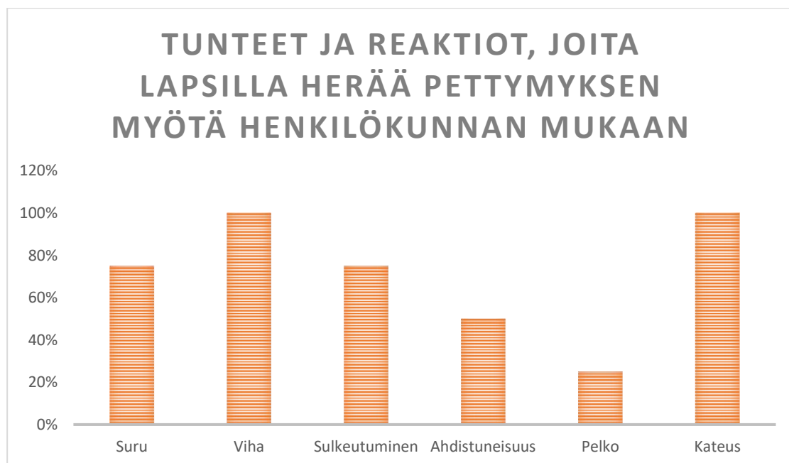
Kuva 3. Tunteet ja reaktiot, joita lapsilla herää pettymyksen myötä henkilökunnan mukaan

teeseen. Aikuisen tehtävänä pettymyksen käsittelyssä on olla avoimesti tukena ja sanoittajana lapsen tunteille. Pettymys herättää lapsissa vihan, surun, pelon, kateuden, sulkeutuneisuuden ja ahdistuneisuuden tunteita ja siksi pettymyksen käsittelyä on vastaajien mielestä lisättävä.