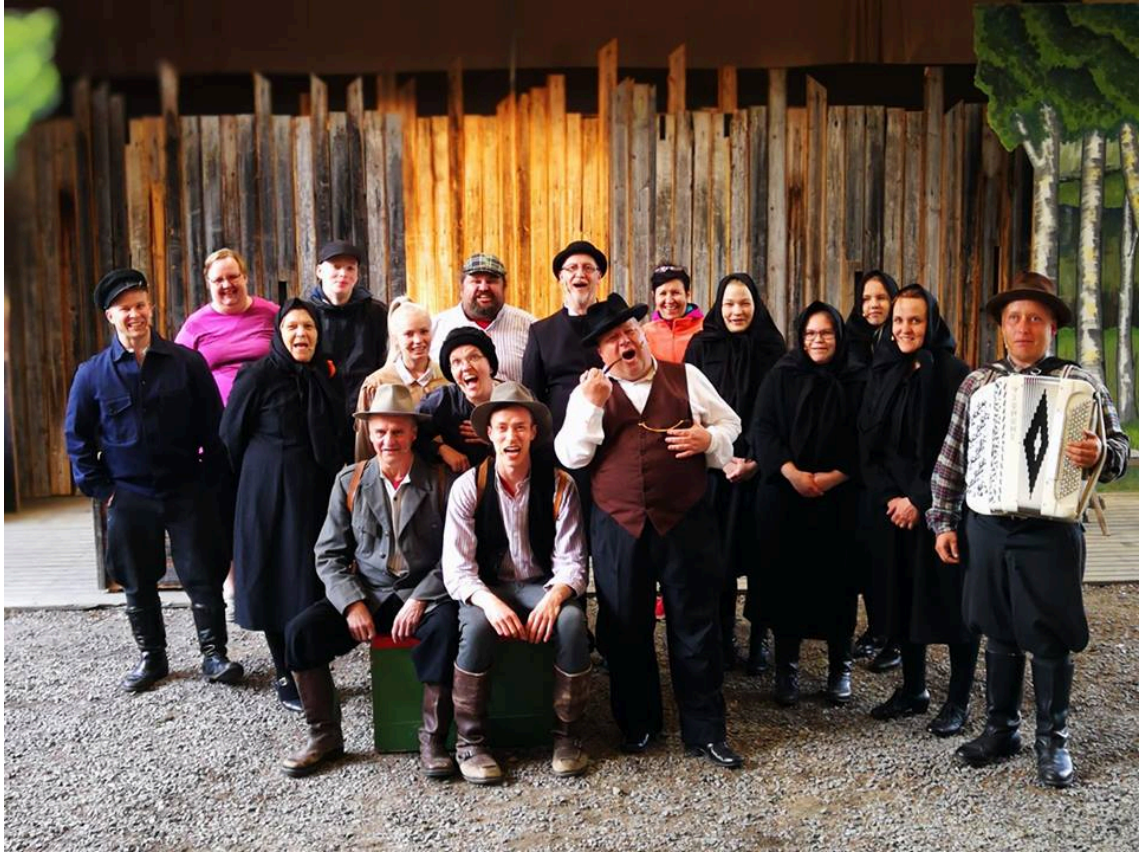
Kuva 2. Kuvaaja. Mervi Venäläinen

https://scontent-arn2-1.xx.fbcdn.net/v/t1.0-9/19511242_1893585014241903_5985466167022531048_n.jpg?nc_cat=0&oh=122a400bb6fca577555bb5063b221119&oe=5B557CD5