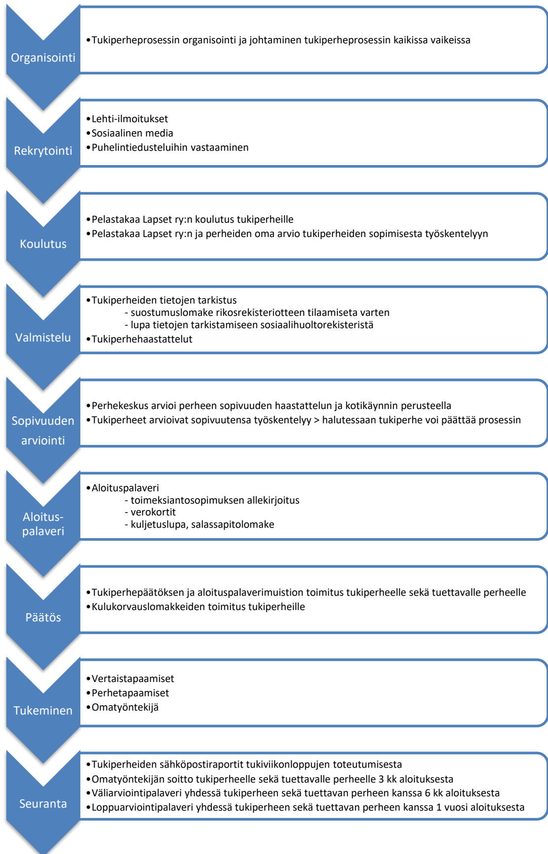
Kuva 1 Tukiperhetyöskentelyn prosessikaavio