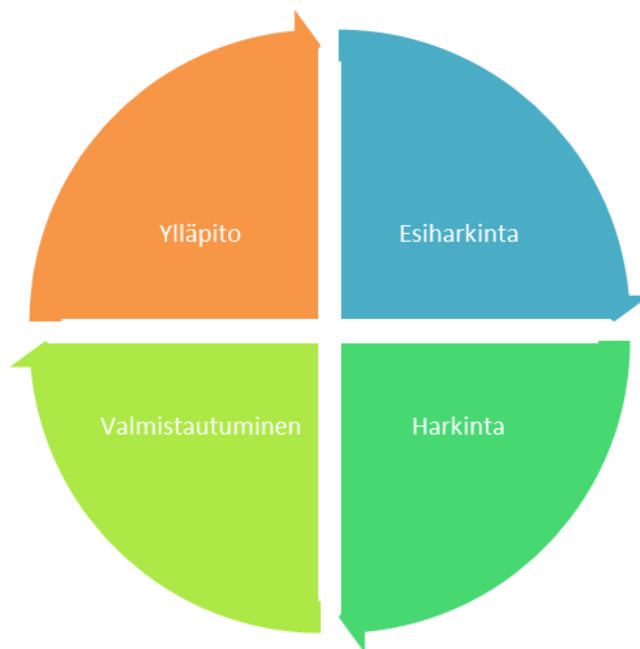
Muutosvaihemalli (Prochaska ja Diclemente 1983). (Kuvio 1)

Ylläpitovaiheessa ihminen on jo toteuttanut muutoksen ja keskittyy jatkamaan sen ylläpitämistä. Hän tarvitsee kannustavaa palautetta onnistumisesta sekä tukea muutoksen ylläpidossa. Ihminen on kuitenkin inhimillinen olento ja muutosvaihemalli saattaa välillä ottaa takapakkia; repsahduksia voi tulla ja ihminen saattaa esimerkiksi palata takaisin harkintavaiheeseen. Se ei välttämättä ole epäonnistuminen, vaan voi tarkoittaa mahdollisuutta etsiä entistä parempi ja toimivampi suunnitelma (Marttila 2010.)