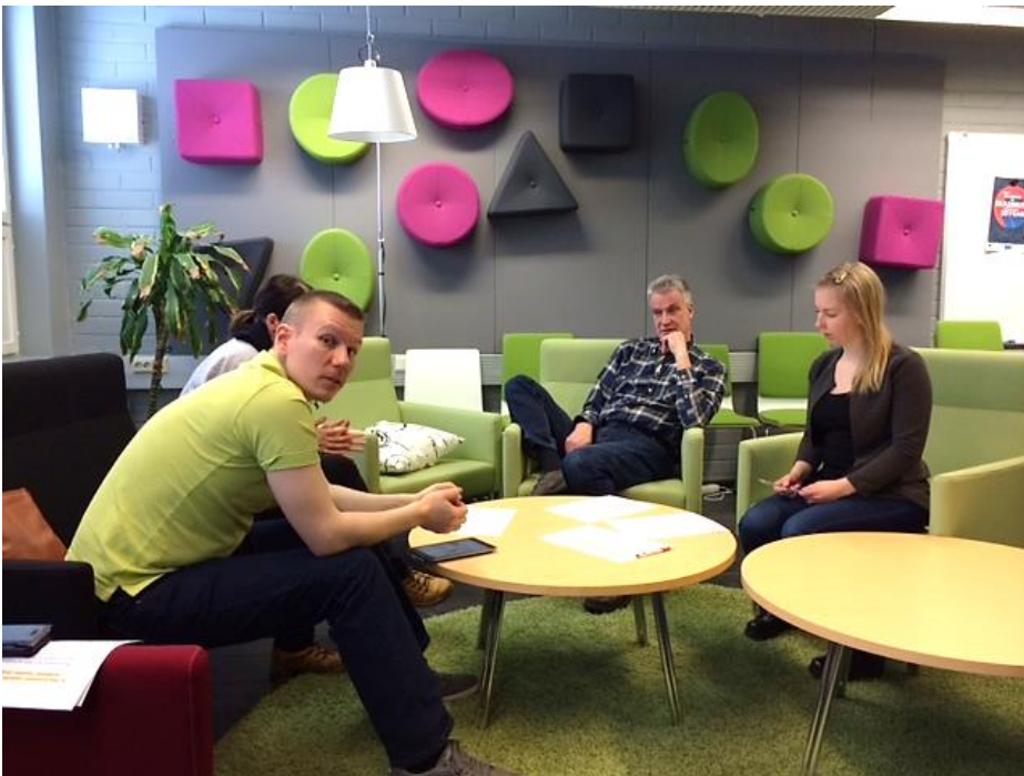
KUVA 1. Opettajaopiskelijät suunnittelemassa henkilökohtaista opintopolkuaan (kuvaaja: Iris Happo)

Osaamisperusteinen koulutus edellyttää opiskelijalta itsearviointi- ja reflektointitaitoja ja vastuunottoa oman osaamisen tunnistamisesta, hankkimisesta ja osoittamisesta. Samalla se edellyttää opettajalta taitoa osallistaa opiskelija oman opintopolkunsa suunnitteluun ja toteutukseen (kuva 1). Henkilökohtaisen opintopolun laatimisen haasteena voi olla opiskelijan epävarmuus oman osaamisensa tunnistamisessa. Opettajalta vastaavasti vaaditaan taitoa ja rohkeutta tunnistaa ja tunnustaa opiskelijan aiemmin hankittu osaaminen. Opiskelijan osallistaminen omien opintojensa suunnitteluun ja toimeenpanoon vaatii opettajalta myös taitoa ottaa ohjauksessa huomioon opiskelijan valmius itseohjautuvuuteen. [1]