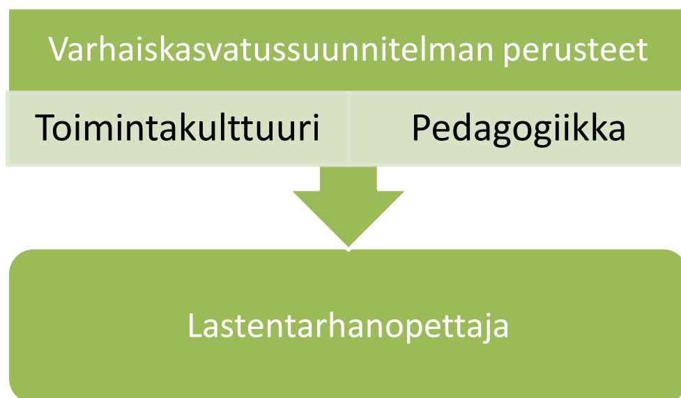
Kuva 4. Opinnäytetyön viitekehys

Lähtökohtani opinnäytetyön aiheeseen ”varhaiskasvatussuunnitelman merkitys lastentarhanopettajan työssä” ovat mielestäni hyvät. Olen nähnyt lastentarhanopettajan konkreettisen työkentän ja itsekin noudattanut vasua työssäni. Olen saanut työkokemusta niin julkisen kuin yksityisen päiväkodin toiminnasta. Olen suorittanut harjoitteluni ja ollut töissä kuvataiteellisesti sekä liikunnallisesti painottuvissa päiväkodeissa. Koen, että olen jo nyt ansainnut erittäin arvokasta työkokemusta lastentarhanopettajan työstä. Näiden kokemusten pohjalta pystyn arvioimaan ja pohtimaan opinnäytetyötäni monipuolisesti.