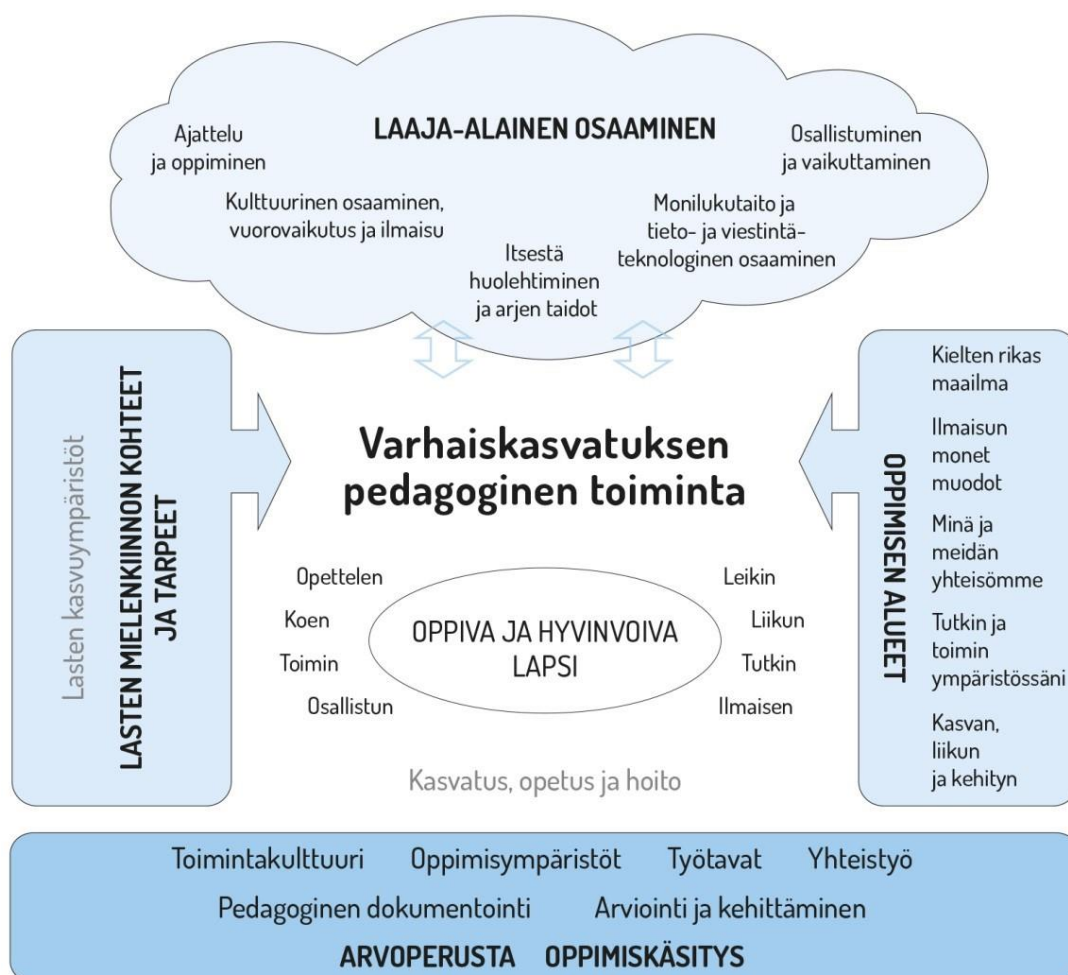
Kuva 1. Pedagogisen toiminnan viitekehys (Varhaiskasvatussuunnitelman perusteet 2016)

Pedagoginen viitekehys vasun perusteissa kuvaa varhaiskasvatuksen toimintaa kokonaisvaltaisesti. (Kuva 1.) Pedagoginen toiminta tapahtuu lasten ja varhaiskasvattajien välisessä vuorovaikutuksessa sekä varhaiskasvatuksen yhteisessä toiminnassa. (Varhaiskasvatussuunnitelman perusteet 2016, 36.) Kokonaisvaltaisuuteen kuuluu lapsia motivoiva työote unohtamatta pedagogista tavoitetta. Kokonaisvaltaista toimintaa on lapsen monipuolisen kehityksen huomioiminen erilaisten taitojen harjoittelun kautta. Siinä huomioidaan myös paikallinen toimintakulttuuri. (Ahonen 2017, 134.)