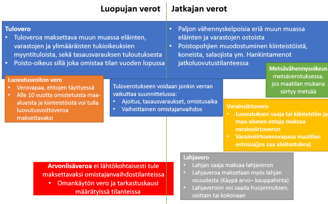
KUVIO 3. Luopujan ja jatkajan verojen jakautuminen [1]

Omistajanvaihdoksen verotuksen ohjeistus on monimutkaista ja epätietoisuus siitä nousee aina esille. Omistajanvaihdos voidaan tehdä myös vaiheittain. Vaiheittain tehtävällä omistajanvaihdoksella voidaan vaikuttaa jatkajan vieraan pääoman määrään. Samalla yrityksessä on mukana luopujan kokemus ja jatkajan rohkeus ja into viedä tilan toimintaa eteenpäin. [10] [8]