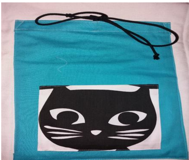
Kuva 6: Kissan kuvalla varustettu tasku

Tähän toimintatuokioon en pyytänyt arviointia suorittavalta asiantuntijalta kirjallista mielipidettä, koska koin, että on helpompi keskustella hänen kanssaan ja saada palaute suullisena. Lasten into toimintaa kohtaan oli havaittavissa. Kaksi lapsista oli oppinut laulamaan vuoronjako värssyä. Yli-innokkuutta ilmeni ja yksi lapsista ilmoitti ennen vuoroaan, mikä on hänen taskunsa. Kyseessä oli kissan kuvalla varustettu tasku. Tässä kyseisessä taskussa oli aiemmin löytynyt iPad, joten päätelimme työkaverin kanssa, että hän kuvitteli sieltä nytkin löytyvän Ipadin. Ilmoitin lapselle, ettei taskuja voi varata itselleen. Hiekkapurkkia lapset selvästikin mielsivät maustepurkiksi, koska yksi lapsista oli valmiina kämmenet yhdessä. Yhdelle lapsista oli voimakkaasti jäänyt mieleen Intian norsu, koska hän toisti sen yhdessä välissä. Toiminta kesti noin kymmenen minuuttia.