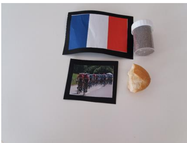
Kuva 7: Taskujen sisältöä Ranskasta

Lapset tulivat istumaan Aistimaton äärelle ja vaikuttivat innostuneilta. Patonkia sisältävä tasku valittiin harmillisesti ensimmäiseksi. Leipän syöminen kesti kauan ja päätin jatkaa toimintaa seuraavalle taskulle, vaikka leivän syönte oli vielä osalla kesken. Yksi lapsista nousi ylös hakeakseen lisää leipää. Leipä selvästikin maistui lapsista hyvältä ja he olisivat halunneet sitä lisää. ”Ilmapöyräily” ei tuntunut kiinnostavan leivän syönnin jälkeen ja osalla saattoikin vielä olla hieman leipää suussa. Rivieran hiekka ei maistunut hyvältä ja toinen lapsi teki perässä, koska vieressä oleva oli mennyt maistamaan hiekkaa. Lopuksi muutama lapsi olisi halunnut vielä kurkistaa muihin taskuihin.