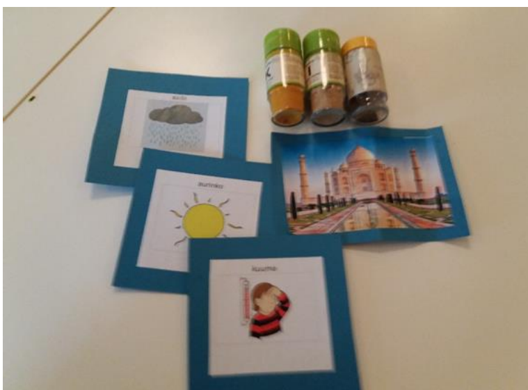
kuva 3: Taskujen sisältöä

Toinen lapsi ei uskaltanut valita omaa taskua ja valitsi saman kuin edellinen lapsi. Lapset myös valitsivat taskun, joka oli lähellä minua. Luulen että se johtui siitä, koska taputtelin lähinnä olevia taskuja joita voi tulla avaamaan. Tarkoitukseni oli rohkaista lapsia, jotka arastelivat vielä uutta toimintaa. Taskujen avaaminen oli haastavaa vaikeiden avausmekanismien takia. Yllätyksekseni lapset katsoivat kuvaa hyvin tarkasti, eikä vaan nopeasti vilkaisseet. Taskunsuun hahmottaminen olisi helpompaa, jos matto olisi ollut seinälle ripustettuna. Jotkut lapsista yrittivät löytää taskunsuuta umpeen tikatulta sivulta. Lapset jaksoivat mielestäni hyvin keskittyä. Yksi lapsista lähti hakemaan leluja kesken tuokion.