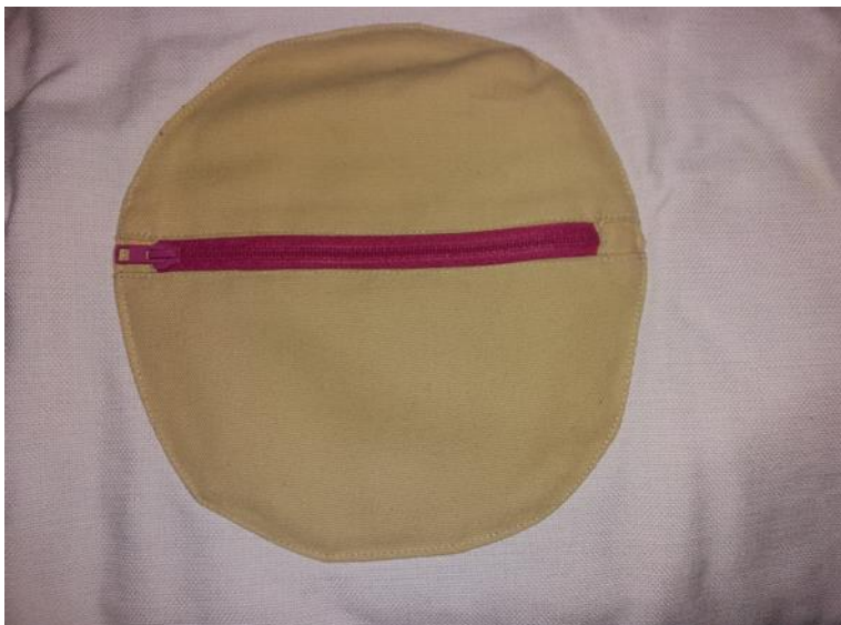
Kuva 2: Tasku vetoketjulla