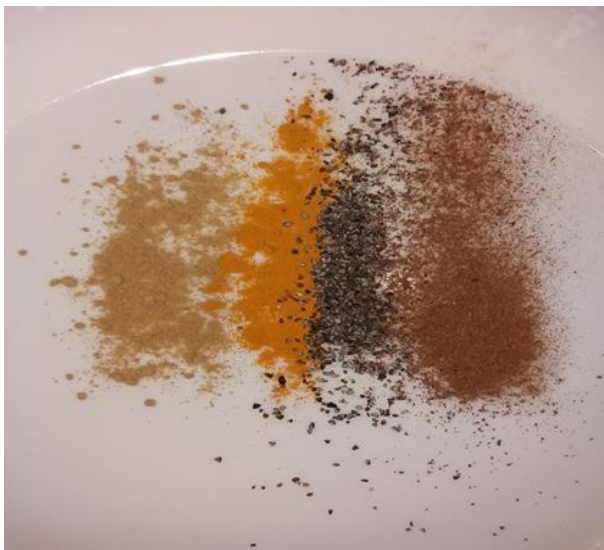
Kuva 5: Mausteita