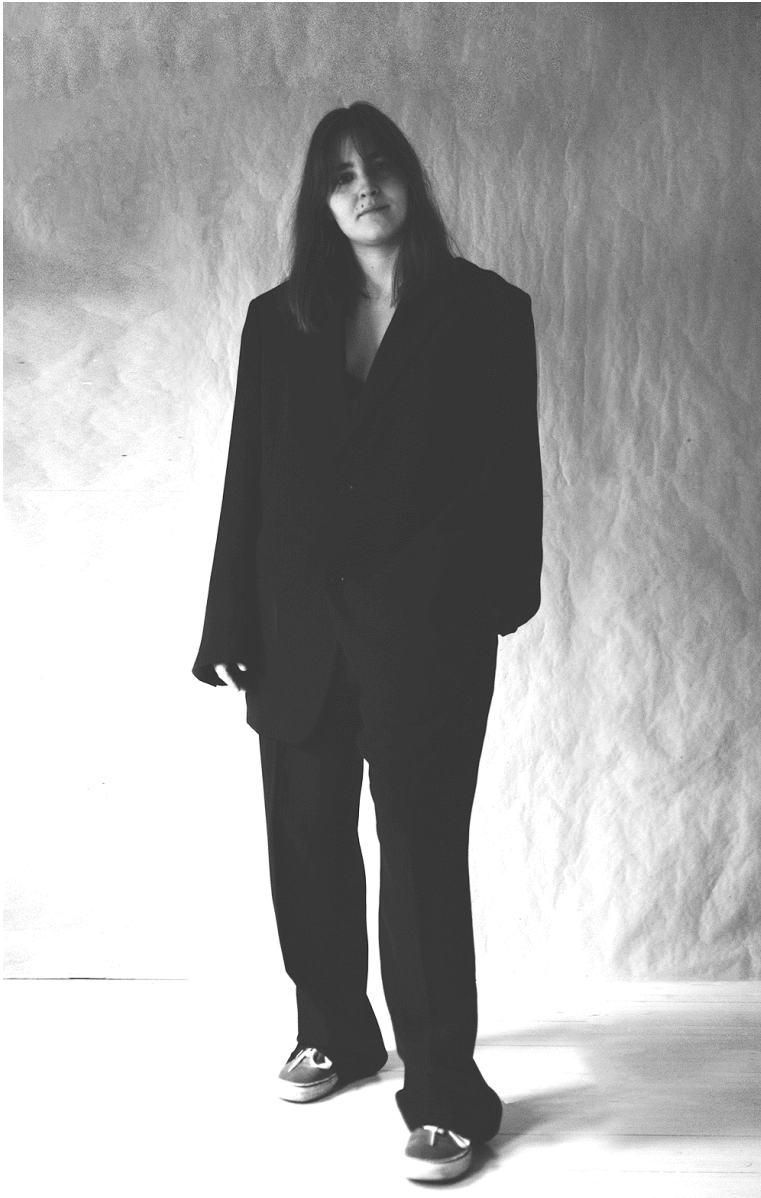
Figur 14. Confident.

Modellen bär kostym och gympaskor. Kostymen är ett klädesplagg som länge associerats enbart med män och maskulinitet. Även Long (2013) anser detta eftersom kostymen till en början burits främst av män för att accentuera axlar och bröstorg och därmed framhäva en maskulin kroppsform. Kindersley (2012) berättar också att kvinnor började använda kostymen mycket senare än männen.