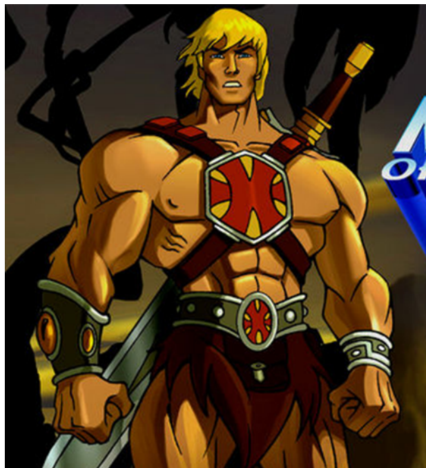
Figur 5. HeMan