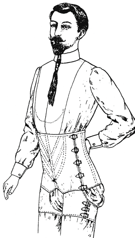
Figur 9. Man i korsett.

Den franska revolutionen var en slags revolution för klämodet också. Det innebar att samtidigt som ytterkläderna förändrades så blev underkläderna annorlunda. Eftersom kvinnorna började använda mer lösa klänningar i tunnare och lättare material så hände det ofta att klänningen blåste upp. För att skydda sin värdighet började kvinnorna också använda underbyxor. Före detta hade underbyxorna burits enbart av män och setts som ett maskulint plagg. Under den tiden blev det också mode för män att använda de kvinnliga korsetterna eftersom de gav dem smalare midja och framhävde breda axlar (se Figur 9). (Ruby, 1996, ss.26-28)