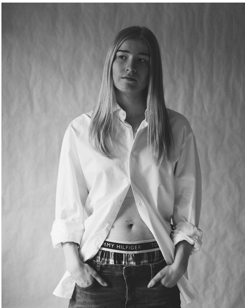
Figur 15. Steady.

Gympaskorna associeras med sportighet som även hör till ett så kallat manligt attribut. Håret hänger bara rakt och ansiktet ser osminkat ut vilket ger ett obrytt intryck. Modellen är avspänd och självsäker med en blick som tittar rakt i kameran. Poseringen är bredbent och stadig. Poseringen är manlig eftersom män har en tendens att stå bredbent för att ”göra plats åt skrevet”.