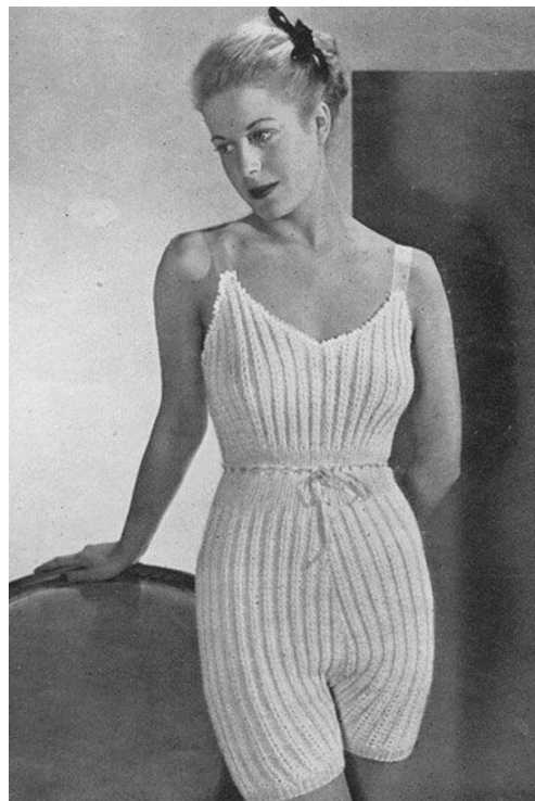
Figur 10. Underkläder i ylle ( thevintageknittinglady.com, 2018 ).

När kvinnorna efter det första världskriget började klä sig mer maskulint så ändrades även underklädernas utseende. Brösten skulle vara platta och höfterna smala. Den ideala kroppsformen för kvinnor var rak. Därför skapades också ett större urval av underkläder och med nya teknologier, så som dragkedjan, blev de också mycket bekvämare att använda. Under 1930 introducerades storlekar till kvinnors underkläder. Det var också då man började kalla brösthållare för ”bh” (se Figur 11) och underbyxor för ”trosor” och de började ha liknande form som de har än idag. Männens underkläder genomgick inte så stora förändringar efter kriget. Lite mer färger och mönster smög sig fram men annars bestod de fortfarande av ett linne som underskjorta och ett par underbyxor. Dock var det år 1934 i filmen Det hände en natt som Clark Gable tog av sin skjorta och avslöjade att han inte hade ett linne där under. Denna scen startade modet för män att gå med endast underbyxor och bar överkropp. (Ruby, 1996, ss.42-44)