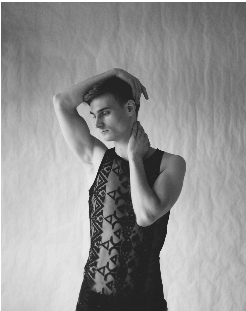
Figur 16. Graceful.