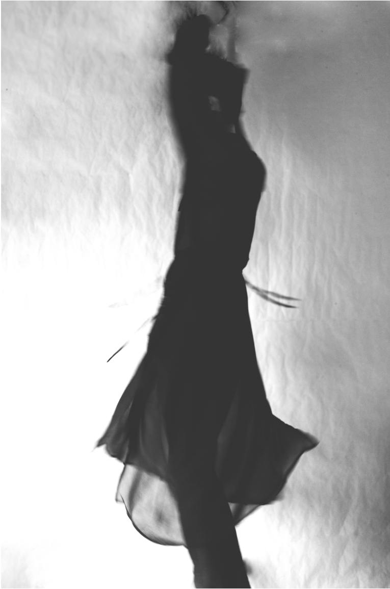
Figur 17. Elegant.

Modellen bär en knälång klänning i tunt, skirt tyg. Lövgren och Collings (2016, 2014) påpekar att enligt kulturellt meningsskapande är klänningen ett klädesplagg som i dagens läge associeras starkt med kvinnan. Kindersley (2012) berättar att redan i slutet av 1300-talet förblev klänningen enbart med kvinnan då männen började bära byxor istället.