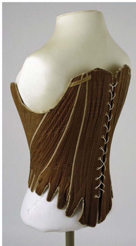
Figur 6. Trä korsett (Commons.wikimedia.org, 2017)

Den sista funktionen har varit att attrahera det motsatta könet. Att avslöja ett underkläderplagg har setts som provocerande eftersom det symboliserar att klä av sig. Nuförtiden med alla mini-kjolar och korta shorts har man svårt att föreställa sig att en kvinna på 1700-talet kunde få sin älskare att rodna endast genom att visa en liten bit av sin långa underkjol. (Ruby, 1996, s.5)