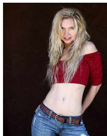
Figur 2. Kvinna med kropps nära och avslöjande kläder samt långt hår.