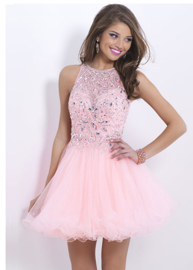
Figur 1. Kvinna med klänning och långt hår (Guillemin, 2014).

Det som formar maskulinitet och femininitet är inte något biologiskt eller psykologiskt utan det är kulturellt meningsskapande som bestämmer att män blir maskulina och kvinnor feminina. I de flesta kulturer anses det viktigt att skilja på de båda könen och tydligt visa vilket kön som har större status, makt och privilegier. Kvinnor och femininitet är inte något man föds med utan det är något man formas till. Femininitetens yttre attribut visas ofta tydligt enligt den sociala konstruktionen. Kroppshår är en stor markör, dess färg, längd, frisyr och vilka kroppsdelar som är tillåtna att ha hår (se Figur 1 & 2). Klädesplagg så som klänning, kjol och byxor är andra markörer (se Figur 1 & 2). Det är inte bara själva plaggen som markerar femininitet utan också hur kropps nära, exponerade eller lösa de är (se Figur 2). (Lövgren, 2016, ss.7-8)