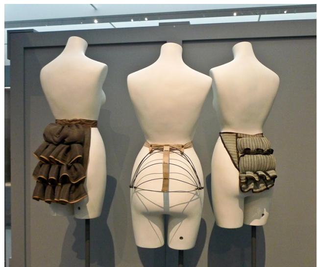
Figur 8. Kuddar som framhäver bakdelen.

Redan under 1600-talet började underkläderna få sin stämpel som något att attrahera det motsatta könet med. Det blev mode att gå med delar av sina ytterkläder oknäppta så att den vita underskjortan fick titta fram. Framåt i tiden, under 1700-talet, ändrades modet igen och då var det viktigt för kvinnor att ha onaturligt smala midjor och upptryckta bröst. Korsetterna med inbyggda brösthållare orsakade många kvinnor blåmärken och ryggproblem eftersom de var så spända. Även om de var smärtsamma så hade ändå flera kvinnor på korsetterna till och med i sängen eller när de födde barn, bara på grund av att korsetterna höll värmen uppe. Samtidigt ville de också framhäva bakdelen och bar ovanpå korsetten en slags metallställning med inbyggda kuddar (se Figur 8). Då var det inte bara kvinnor som ville ändra på sina kroppsdelar, även män använde stoppningar på sina vader eftersom muskulösa ben var ett eftertraktat utseende. (Ruby, 1996, ss.18-25)