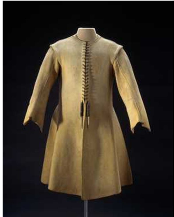
Figur 7. Medeltida underskjorta för män (Wikipedia.org, 2018).

Redan under 1600-talet började underkläderna få sin stämpel som något att attrahera det motsatta könet med. Det blev mode att gå med delar av sina ytterkläder oknäppta så att den vita underskjortan fick titta fram. Framåt i tiden, under 1700-talet, ändrades modet igen och då var det viktigt för kvinnor att ha onaturligt smala midjor och upptryckta bröst. Korsetterna med inbyggda brösthållare orsakade många kvinnor blåmärken och ryggproblem eftersom de var så spända. Även om de var smärtsamma så hade ändå flera kvinnor på korsetterna till och med i sängen eller när de födde barn, bara på grund av att korsetterna höll värmen uppe. Samtidigt ville de också framhäva bakdelen och bar ovanpå korsetten en slags metallställning med inbyggda kuddar (se Figur 8). Då var det inte bara kvinnor som ville ändra på sina kroppsdelar, även män använde stoppningar på sina vader eftersom muskulösa ben var ett eftertraktat utseende. (Ruby, 1996, ss.18-25)