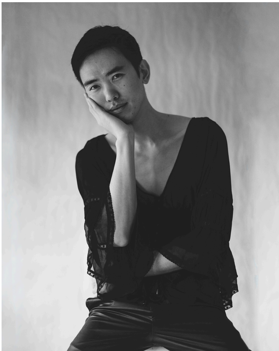
Figur 18. Soft.

Modellen bär en tunn transparent blus med V-ringning, volanger och spets. V-ringningen visar mycket hud och enligt Collings och Jokinen (2014, 2001) uppfattas volangerna och spetsen i blusen som feminina detaljer. Stadin (2010) lyfter fram att dessa uppfattningar om vilka kläder och detaljer som anses feminina eller maskulina uppstått på grund av att kvinnors och mäns kläder länge varit tämligen olika till utseende här i Västvärlden.