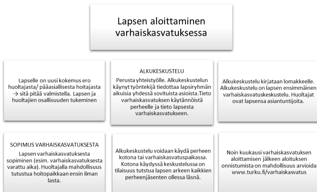
Kuvio 3. Lapsen aloittaminen varhaiskasvatuksessa - huomioitavia asioita. (Turun kaupunki 2017, 16.)

Alkukeskustelussa on mukana lapsen oma tuleva kasvattaja. Mukana voi olla myös työpari tai päiväkodinjohtaja. Perheestä osallistuvat lapsi ja ainakin toinen vanhempi, mieluiten molemmat vanhemmat. Myös sisarukset tai muu lapsen läheinen ihminen voivat olla mukana perheen niin halutessa. Alkukeskustelun keskeinen tavoite on rakentaa luottamuksellista suhdetta perheen ja päivähoiton välille. Vanhempien kokemus kuulluksi tulemisesta luo pohjaa tälle suhteelle. (Kaskela & Kekkonen 2006, 127.)