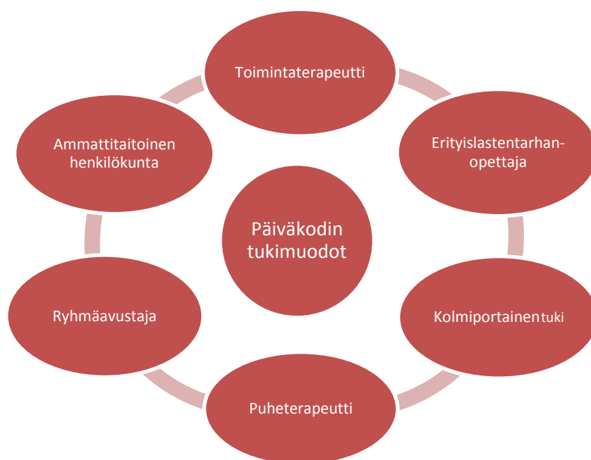
Kuvio 4. Päiväkodin mahdollisuudet tukea lastensuojelun piirissä olevaa lasta.

Erityisen tuen tarpeen ilmettyä päiväkodin varhaiskasvattajat alkavat tukea lasta erilaisin tukimuodoin. Varhaiskasvattajat mainitsivat heidän päiväkodin käyttävän seuraavia tukimuotoja (ks. kuvio 4).