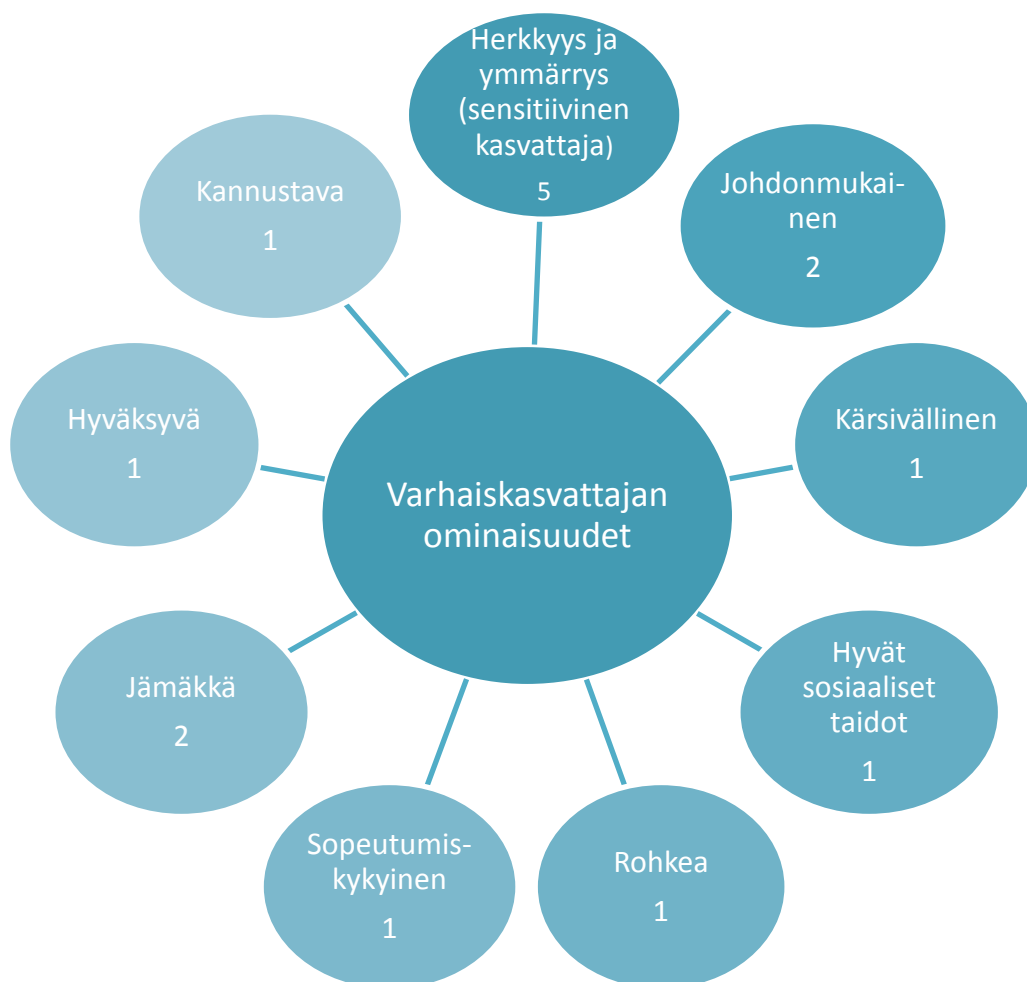
Kuvio 1. Varhaiskasvattajan ominaisuudet lastensuojelun asiakasta kohdatessa.

Toisen teeman aiheena oli varhaiskasvattajan ominaisuudet ja osaaminen. Teema aloitettiin kysymällä: Millaisia ominaisuuksia varhaiskasvattajilla tulisi olla lastensuojelun asiakasta kohdatessa? Vastaukset luokiteltiin yhdeksään eri ominaisuuteen (kuvio1).