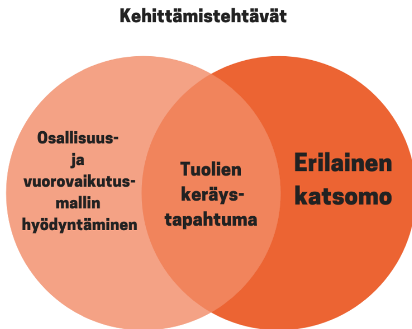
Kuvio1. Opinnäytetyön kehittämistehtävät.

nousi kolme selkeää kokonaisuutta, 1) erilainen ja kestävä tapahtumatuotannon periaatteita noudattava katsomo 2) osallisuusmallin hyödyntäminen osana tapahtumatuotantoa SuomiAreenassa 3) Tuolienkeräystapahtuman suunnittelu ja toteutus. Alla kuvattuna (kuvio 1) opinnäytetyöni kehittämistehtävät.