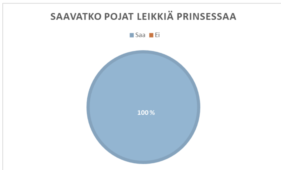
Kuvio 1. Saavatko pojat leikkiä prinsessaa.

Varhaiskasvattajat olivat vastauksissaan kertoneet myös ratkaisuehdotuksia, miten toimisivat tilanteessa jossa, lapsi leikkii ehkä jonkun mielestä sukupuolelle sopimattomia leikkejä. Yhdellä vastaajista ei ollut ehdotuksia tilanteen ratkaisemiseksi. Kolme vastaajista keskustelisi aiheesta lapsiryhmässä. Kaksi vastaajista kehittäisi prinsessaleikin yhdessä lasten kanssa. (Taulukko 1.) Osa vastaajista koki tärkeäksi, ettei sukupuolella ole merkitystä siinä mitä leikkejä lapsi leikkii.