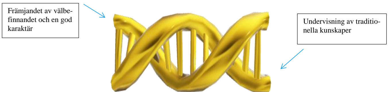
Figur 1. Positiva pedagogikens dubbelspiral

Den positiva pedagogiken grundar sig på synen om barnet som en aktiv aktör och meningsbyggare (Kumpulainen et al. 2014 s.225). Man kan gott säga att det är Seligman som myntat begreppet positiv pedagogik som har som uppgift att utmana den moderna skoluppföstran där endast uppnådd kunskap uppskattas. Seligman et al. (2009) menar att man kan tala om den positiva pedagogikens dubbelspiral som består av två överlappande strängar: undervisning av de traditionella kunskaperna och färdigheterna (akademiska) samt främjandet av välbefinnandet och en god karaktär.