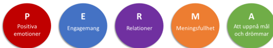
Figur 2. PERMA – teorin (Seligman, 2011)

Seligman vill ifrågasätta det freudianska synsättet där människans högsta mål är att befrias från smärta. Han kom fram till sin egna teori om lycka och ett gott liv efter att ha forskat om lycka och dess komponenter. Han såg en bredare helhet där välbefinnandet spelar en större roll och består av separata mätbara delar. PERMA – teorin (2011) består av fem komponenter: positiva emotioner, engagemang, relationer, en upplevelse av meningsfullhet och att man uppnår mål. Alla komponenterna stöder välbefinnandet, eftersträvas för sin egen skull, inte för att de skulle vara redskap för att nå någon annan komponent och de alla är mätbara för sig och oberoende av de andra. (Uusitalo-Malmivaara & Vuorinen 2018 s. 24–25)