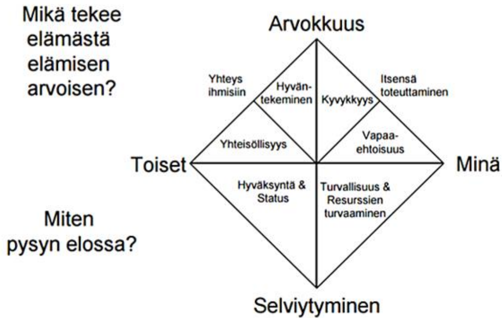
KUVIO 2. Motivaatiotimantti (Martela 2015, 54)

Motivaatiotimanttin alimmat osiot turvallisuus ja resurssien turvaaminen ovat elämän peruskulmakiviä, mutta se, kuinka paljon ihmiset antavat niiden määritellä omaa tekemistään, on oleellista. Omasta selviytymisestä kannattaa huolehtia ja siihen on Suomessa paljon paremmat mahdollisuudet kuin monessa muussa maassa. Pelko on yksi ihmisten toimintaa rajoittava tekijä ja myös liika realismi saattaa estää ihmisiä unelmien saavuttamiselta. Ihmiset tarvitsevat rohkeutta ja uskallusta omaehtoisen elämäntavan rakentamiseen. (Martela 2015, 184-185.)