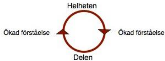
Figur 3. Den hermeneutiska cirkeln (Skoglund, 2012, s. 2).