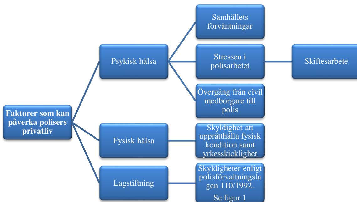
Figur 2. Sammanfattning av faktorer som i teorin kan påverka polisens privatliv.

I figur 2 sammanfattas vad som framkommit i detta kapitel. Faktorerna som i teorin kan påverka polisens privatliv delas in i tre huvudkategorier, psykisk hälsa, fysisk hälsa och lagstiftning. Varje kategori har också en eller flera underkategorier.