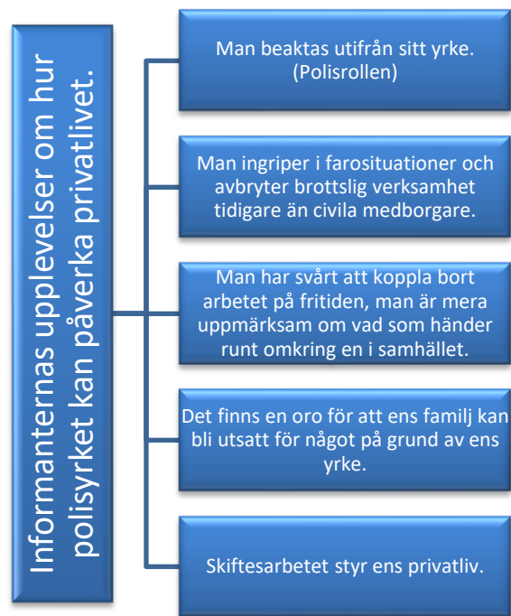
Figur 4. Faktorer som informanterna upplever att har påverkat deras privatliv.

Den andra forskningsfrågan i undersökningen lyder: kan polisyrket påverka privatlivet på ett negativt sätt? Vid analysen av intervjumaterialet så framkommer det att informanterna upplever att flera av de faktorer som de anser att påverkar deras privatliv upplevs som negativa. På frågan om informanterna upplever att polisyrket påverkar privatlivet på ett negativt sätt så framkommer det att det kanske inte är själva arbetet eller det man utsätts för i arbetet utan främst allt runt omkring som kan påverka privatlivet på ett negativt sätt. Bland annat informant 3 lyfter fram skiftesarbetet. Hen påstår att detta styr privatlivet helt och hållet, och att familjen i första hand påverkas på grund av att man kanske blir tvungen att arbeta under fester och högtider. I exempel 32 tar informant 2 upp polisrollen och att hen är polis 24 timmar i dygnet. Informanten tycker att det är jobbigt att man enbart ses som polis och att många vill diskutera polisarbetet när man träffas på fester. Detta tar också informant 1 upp i exempel 33. Hen upplever att polisrollen följer med en också på fritiden och att det ibland skulle vara skönt att kunna kasta av sig den rollen och ha ett vanligt arbete som inte så starkt färgar privatlivet.