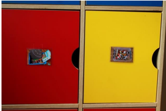
KUVA 7. Valokuvat lipaston ovissa

Kuvista 7, 8 näkyy, miten valokuvia hyödynnettiin eri ryhmien tiloissa. Kuva 7 on otettu kaapistosta, jonka oviin kuvat on kiinnitetty. Kuva 8 on kaapin ovesta.