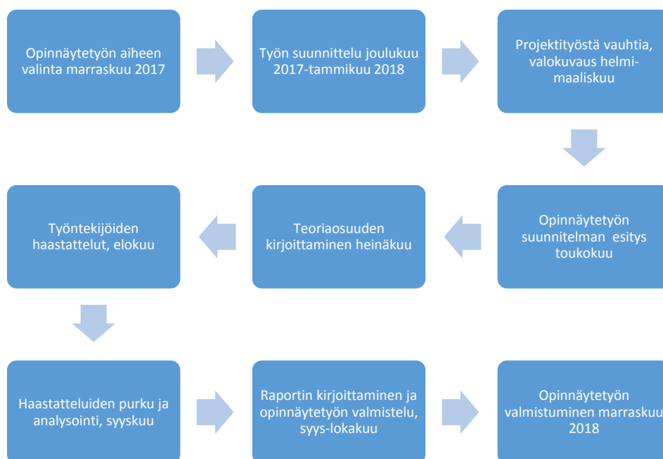
KUVA 9. Opinnäytetyön prosessi

Alla olevasta kuvasta (kuva 9) selviää opinnäytetyön prosessi alusta loppuun.