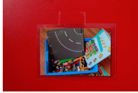
KUVA 6. Pikkulegoja

Kuvista 7, 8 näkyy, miten valokuvia hyödynnettiin eri ryhmien tiloissa. Kuva 7 on otettu kaapistosta, jonka oviin kuvat on kiinnitetty. Kuva 8 on kaapin ovesta.