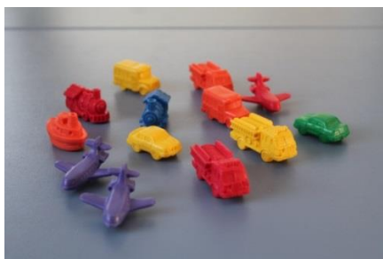
KUVA 3. Autoja ja lentokoneita

Opinnäytetyön toiveena työelämäkumppanin puolelta oli saada mahdollisimman nopeasti käytettäväksi valokuvat päiväkodin leikkivälineistä ja tiloista. Opintoaikatauluun luontuen valokuvaus toteutettiin sosionomiopintoihin liittyvänä projektityönä. Päiväkodin leikkivälineiden ja tilojen valokuvaus toteutettiin maaliskuussa 2018. Valokuvauksessa edettiin ryhmien omien toiveiden ja tarpeiden mukaan. Jokainen ryhmä sai kertoa haluamansa valokuvauksen kohteet. Osalla ryhmistä oli jo käytössään valokuvia leikkivälineistä, joten heille valokuvattiin vain pelkät leikkutilat. Valokuvat tulostettiin, laminoitiin ja leikattiin ennalta sovitun kokoisiksi päiväkodin tiloissa. Kuvissa 3, 4, 5 ja 6 on valokuvattuna erilaisia leikkivälineitä. Valokuvat toimitettiin yhdyshenkilölle, joka jakoi valmiit kuvat eri ryhmien käyttöön.