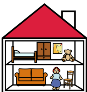
Kuva 1. Nukkekoti

Papunetin (2018) internet-sivuilla kerrotaan ACC- menetelmästä. Kyseessä on menetelmä, joka on puhetta tukevaa, täydentävää ja korvaavaa kommunikointia, jossa käytetään apuna tukiviittomia, kuvia tai blisskieltä. Kuvilla tai blissymboleilla tapahtuvassa viestinnässä käytetään apuvälineinä muun muassa kommunikointitauluja, kommunikointikansioita tai kommunikointiohjelmaa. Valmiita kuvia ja tietoa kuvien käytöstä on saatavilla mm. Papunetin internet-sivuilta. Papunetin kuvapankissa on valmiita kuvia yli 28 000 ja niitä voi tulostaa jokainen itselleen käyttöön. Valmiissa kuvissa on 2800 valokuvaa, 2000 viittomakuvaa sekä piirrokuvia ja piktogrammeja. (Papunet 2018). Alla on kaksi esimerkkiä piirretyistä kuvista, joita voidaan hyödyntää esimerkiksi leikin valintatilanteessa.