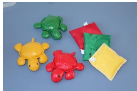
KUVA 4. Hernepusseja