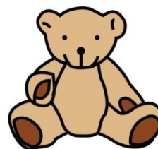
Kuva 2. Nalle

Kuten edellä on käynyt ilmi, kuvia ja valokuvia voidaan hyödyntää päiväkohteissa mm. erilaisten siirtymätilanteiden helpottamiseen, päivän toimintojen hahmottamiseen ja puheen tuottamisen apuna. Kuvilla voidaan tukea lapsen osallisuutta myös leikin valintatilanteessa. Heikka ym. (2014) kuvaavat kirjassaan tutkimusta, jonka aiheena oli lasten osallisuuden tukemisen pääkaupunkiseudun kunnallisessa varhaiskasvatuksessa. Heidän mukaansa osallisuuden koettiin toteutuvan erityisesti leikissä. Osallisuutta oli tuettu vapaaseen leikkiin varatuissa tuokioissa. Leikin valintaan oli monessa päiväkodissa otettu