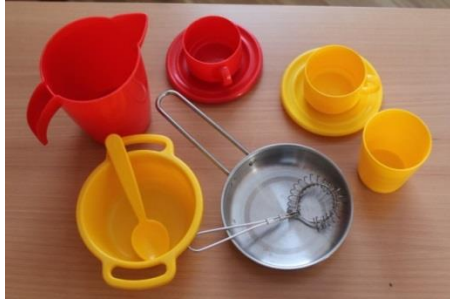
KUVA 5. Astioita