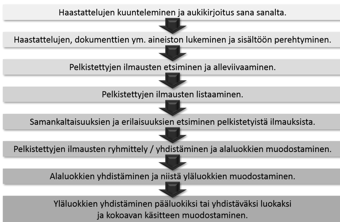
Kuva 2. Aineistolähtöisen sisällönanalyysin eteneminen (Tuomi & Sarajärvi 2018, 123).

Aineiston analyysissä käytin pohjana Tuomen ja Sarajärven (2018, 123) kuvausta sisällön analyysin etenemisestä (kuva 2). Liitteessä 7 kuvaan tarkemmin tämän opinnäytetyön analyysipolun. Aineiston keräämisen jälkeen kävin ääni- ja videonauhoitteet läpi ja valitsin opinnäytetyön kannalta olennaisen materiaalin. Toiminnallisen päivän nauhoitteesta jätin esimerkiksi pois ruokailun, jonka aikana opinnäytetyön aihetta ei käsitelty ollenkaan ja muutamasta haastattelusta esimerkiksi lapsen omista piirustuksista tai leluista keskustelun. Tämän valitun materiaalin litteroin, redusoin eli pelkistin ja karsin sekä tematisoin sen aineiston pohjalta esiin nousseisiin teemoihin. Aineiston järjestämisessä lähdin aluksi liikkeelle teemahaastattelun teemoista, jonka jälkeen järjestin lopun materiaalin yhteensopivien teemojen alle. (Eskola 2015, 197; Eskola & Suoranta 1998, 151—152; Tuomi & Sarajärvi 2002, 110—111.) Litteroituja sivua tuli kaikkiaan 27, Calibri -fontin koolla 11, rivivälillä 1.