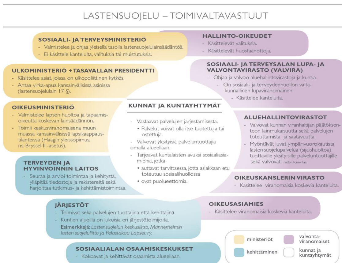
Kuva 1. Lastensuojelun toimivaltavastuut. STM 2018b.

Törrönen ja Vornanen (2004) käsittelevät ennaltaehkäisevää työtä lastensuojelun viitekehyksessä. Lastensuojelulain 3 a § määrittelee, että kunta järjestää ennaltaehkäisevää lastensuojelua silloin, kun lapsi tai perhe ei ole lastensuojelun asiakkaana. Ehkäisevän työn tukea annetaan esimerkiksi opetuksessa, neuvolassa, nuorisotyössä, päivähoidossa sekä muussa sosiaali- ja terveydenhuollossa. Kunnat vastaavat palveluiden järjestämisestä, mutta palvelut voivat olla kunnan itse tuottamia tai ostettuja (STM 2018b), jolloin yhteistyötä voidaan tehdä esimerkiksi järjestöjen kanssa (kuva 1).