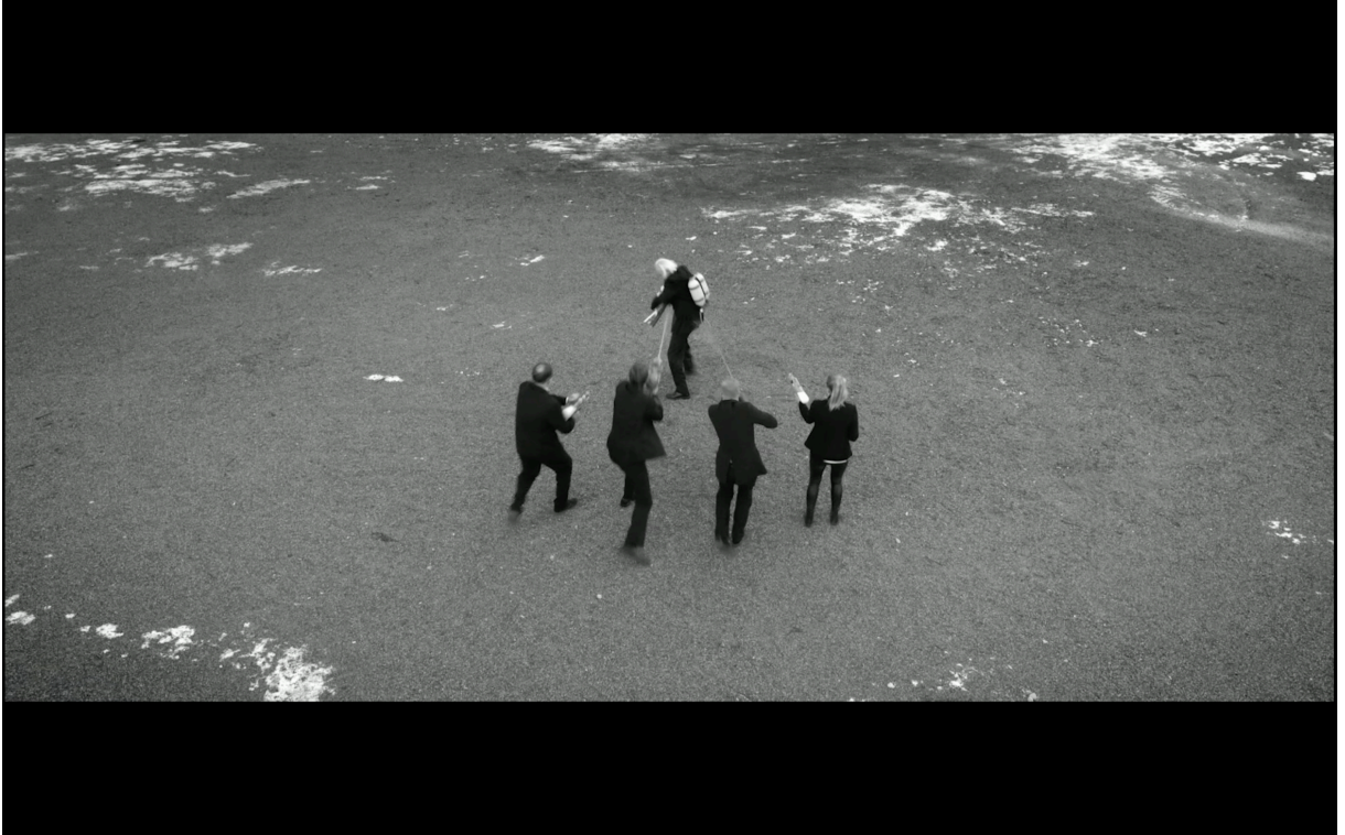
Figur 9: "Einar springer en bit framåt, svänger om och försöker skjuta..." (Kirvesniemi 2017)