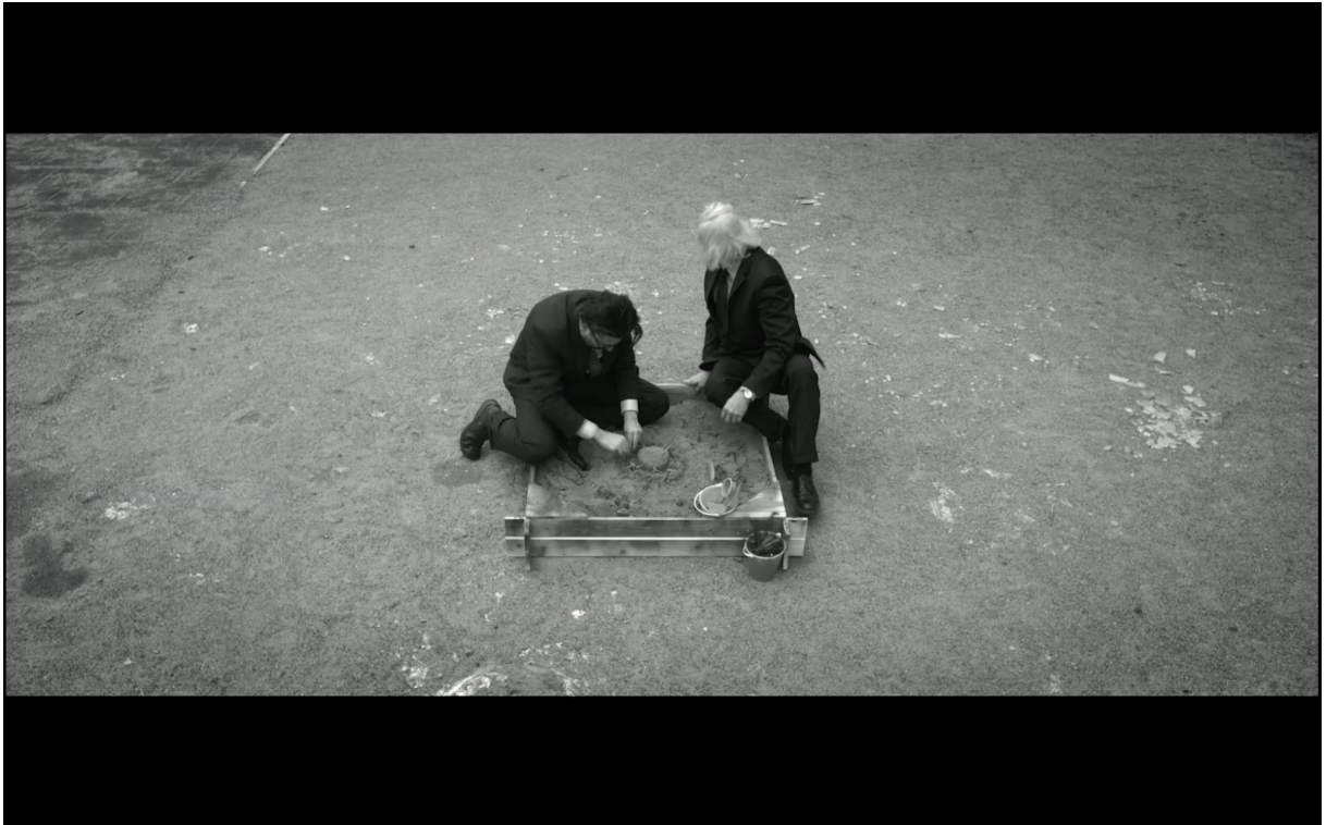
Figur 2: Höga bildvinklar. (Kirvesniemi 2017)