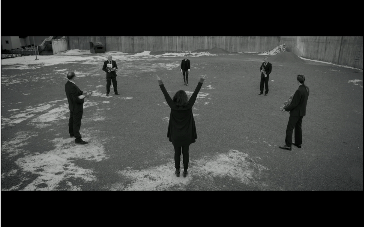
Figur 7: "Det är spänning i luften. Alla stirrar på varandra." (Kirvesniemi 2017)