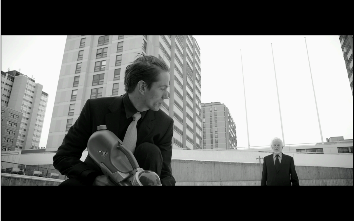
Figur 4: Placering av karaktärerna. (Kirvesniemi 2017)