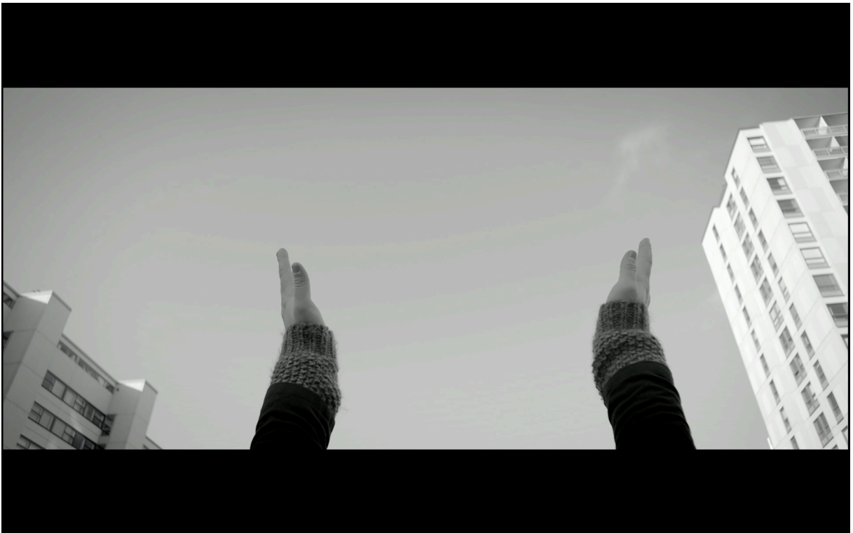
Figur 8: "Eva slår ihop händerna." (Kirvesniemi 2017)