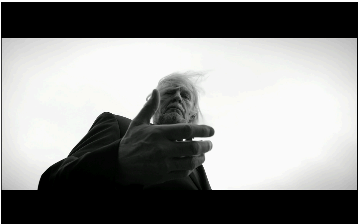
Figur 3: Låga bildvinklar. (Kirvesniemi 2017)