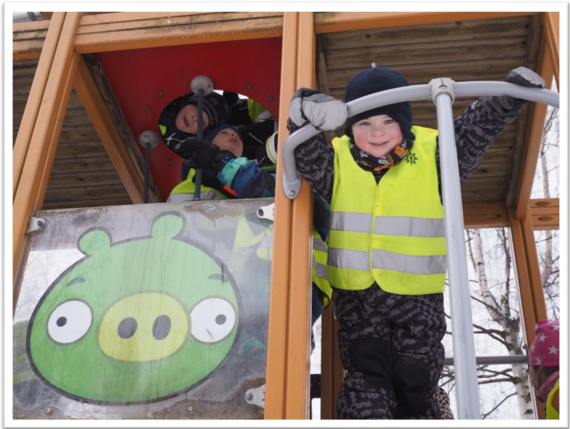
Kuva 10. Lapsen ottama valokuva kaverista kiipeilytelineessä.

Kevätretki Kirjurinluodossa oli alusta loppuun yhdessä pienryhmän lasten kanssa suunniteltu toimintapäivä. Halusin, että tekisimme pienryhmän sekä muiden esiopetuksessa olevien lasten kanssa viimeisellä toimintakerrallani jotain hauskaa yhdessä, mikä jäisi lasten mieleen.