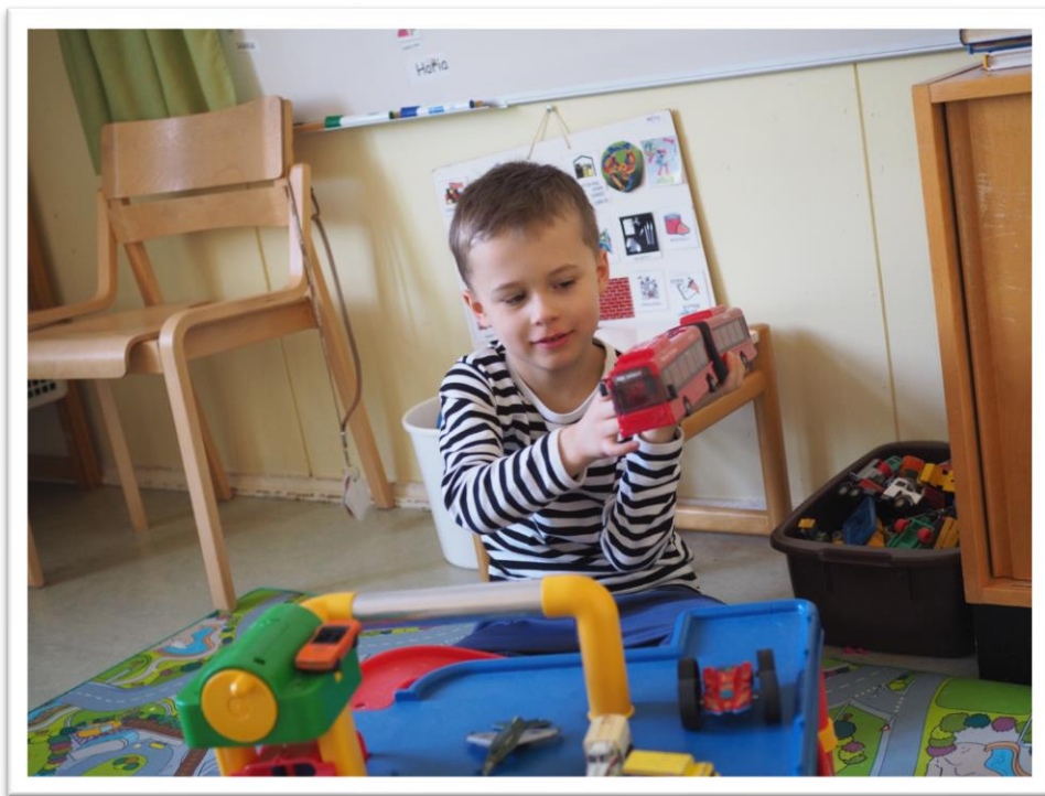
Kuva 6, 7 & 8. Lasten tallettamat valokuvat toisistaan.