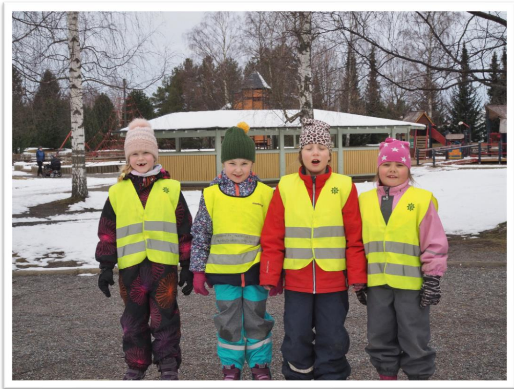
Kuva 11. Tyttöistä otettu ryhmäkuva.

Toimintapäivää suunnittelimme yhdessä pienryhmän lasten kanssa päiväkodin tiiloissa. Suunnittelu-aika saatiin sovittua päiväkodin kanssa lasten lepoaikaan. Pienryhmän lapsista kukaan ei nukkunut päiväkodissa päiväunia, joten ajankohta ei haitannut lapsia. Itse suunnitteluhetki oli kuitenkin rauhallinen. Piirsimme yhdessä lasten kanssa ja siinä samalla keskustelimme siitä, mitä lapset haluaisivat toimintapäivänä tehdä. Osa lapsista innostui heti kertomaan omia ideoitaan suullisesti, kun taas toiset lapset alkoivat piirtämisen avulla suunnittelemaan toimintapäivää. Kaikki lapset olivat samaa mieltä siitä, että toimintapäivä olisi ulkona. Kerroin lapsille, että meillä olisi mahdollisuus olla päiväkodin ulkopuolella ulkona. Aluksi lapset ehdottivat lähellä olevaa puistoa, mutta nopeasti kohde vaihtui Kirjurinluotoon.