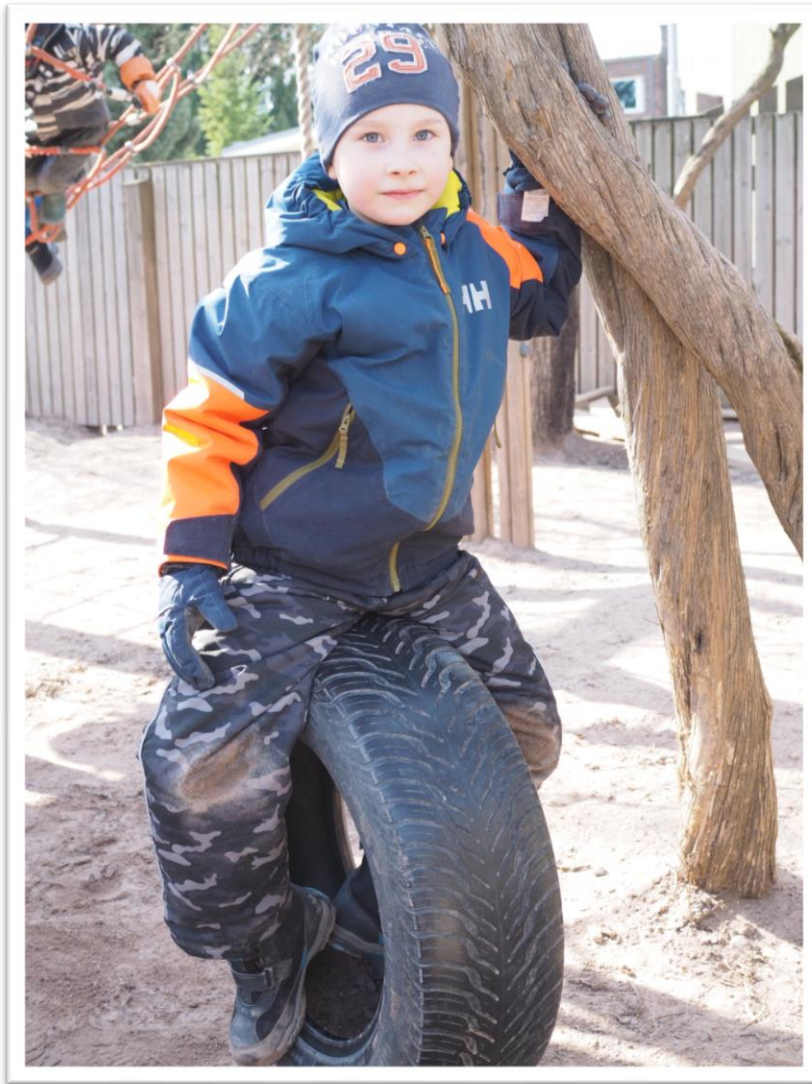
Kuva 9. Lasten tallettama valokuva toisistaan.