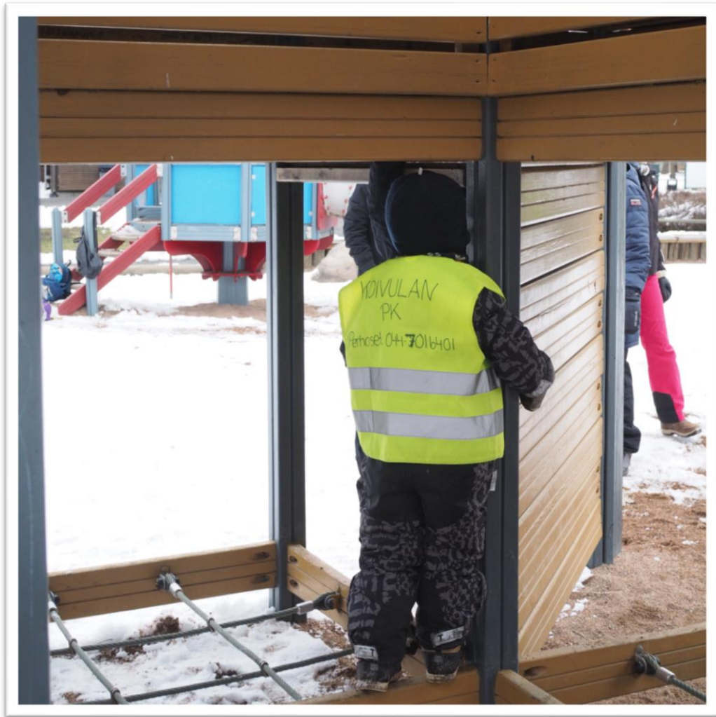
Kuva 12. Lapsi leikkimässä piiloleikkiä merirosolaivassa.

Leikkien jälkeen lapset alkoivat kiinnostua enemmän ympäristöstä ja huomasin, että he halusivat leikkiä vuorostaan vapaasti. Sovimme yhdessä lasten kanssa, että nyt olisi vapaan leikin aika. Lapset menivät riemastuneina tutkimaan ympäristöä ja aloittivat leikkimisen. Sillä välin minä dokumentoin lasten leikkiä valokuvaamalla ja samalla osallistin myös lapsia valokuvauksessa, kun annoin myös heidän ottaa valokuvia kevätretkipäivästä.