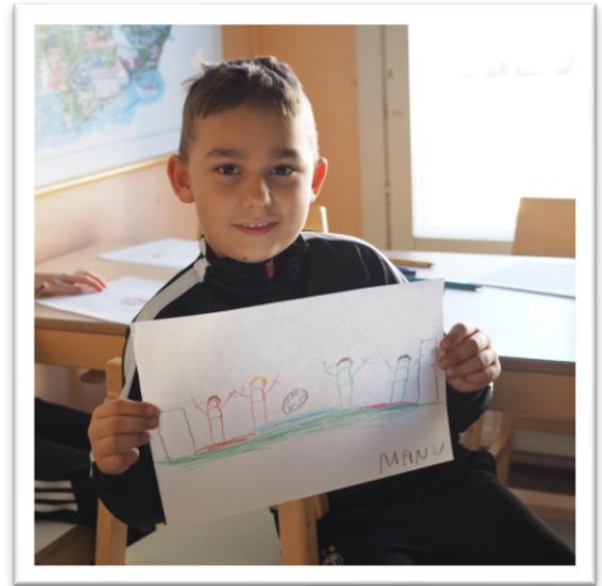
Kuva 2 & 3. Lapsen piirtämä lempiasia.

Loppujen lopuksi kuvien yhteenvedona tulkitsin, että pienryhmän lapset pitivät leikkimisestä, urheilusta ja ulkoilusta.