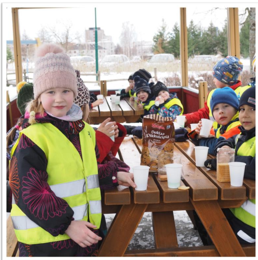
Kuva 14. Evästäuko ja apulainen.