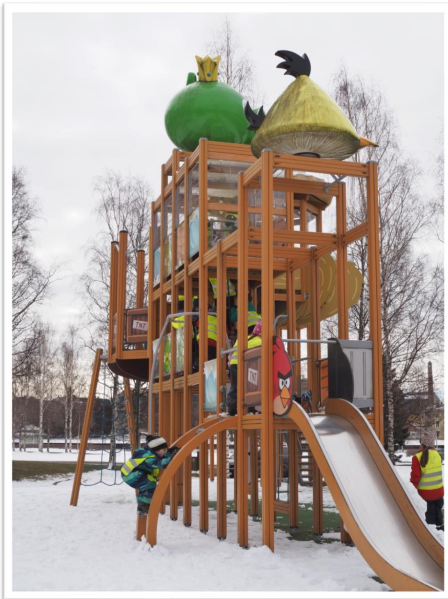
Kuva 15. Lapsen ottama kuva puistosta ja leikeistä.

Vapaan leikin jälkeen keräännymme yhteen evästauolle. Evästauolla valitsin lapsista itselleni muutaman apulaisen, jotka jakaisivat muille lapsille eväitä. Tällä tavoin myös lapset saivat osallistua. Vaikka kyseessä olikin ollut vain keksien jakaminen muille ryhmäläisille, niin se on lapselle aina hieno hetki auttaa aikuista. Kaikki eväät olivat juuri sellaisia, mitä lapset olivat toivoneet. Yllätyksenä otin retkelle mukaan myös suklaakeksejä. Eväiden syömisen jälkeen kello oli jo niin paljon, että meidän täytyi lähteä kävelemään takaisin päiväkotiin. Lapset leikkivät vielä hetken ” Angry Birds” puis-tossa ja sitten lähdimme parijonossa takaisin kohti päiväkotia.