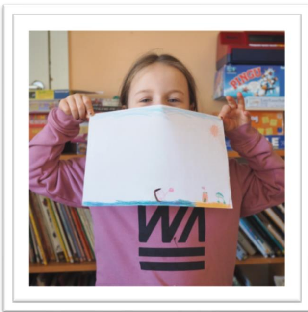
Kuva 1. Lapsen piirtämä lempiasia.

Menin iltapäivällä lasten lepohetken jälkeen ohjaamaan piirtämistä pienryhmään. Lapset sekä henkilökunta ottivat minut hyvin vastaan. Pienryhmä toiminta tapahtui vähän ”ripotellen” sillä, lapset olivat juuri heränneet. Olin alustavasti suunnitellut ottavani kaikki pienryhmän lapset samaan aikaan piirtämään, mutta käytännössä lapset osallistuivatkin toimintaan sitä mukaan, kun he olivat saaneet syötyä välipalan. Tämä ei loppujen lopuksi haitannut yhtään. Suunnitelmat muuttuvat ja päiväkodissa täytyy aina varautua siihen, että suunnitelmat elävät. Pystyin paremmin keskittymään lasten piirrokseen ja keskustelemaan heidän kanssaan, kun heitä oli ohjaustilanteessa vähemmän.