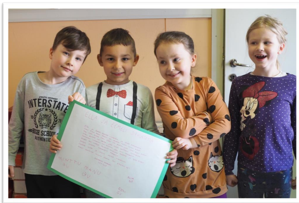
Kuva 4. Sadutuksen pienryhmä.

Suomalaista Liisa Karlssonia pidetään sadutusmenetelmän keksijänä. Sadutuksen avulla pystytään kehittämään lapsen ja aikuisen välistä vuorovaikutusta. Menetelmää voidaan toteuttaa niin päiväkodissa kuin kotonakin. Aikuinen pystyy lapsen kertoman sadun avulla havainnoimaan lapsen ajatuksia monipuolisesti, siksi sadutus onkin oivallinen tapa tutustua lapseen. Sadutuksessa lapsi on osana yhteisöä, jossa häntä kuunnellaan aidosti. Menetelmänä sadutus on hyvin yksinkertainen. Sen toteuttamiseen tarvitaan vain kynä ja paperia sekä kirjoittaja ja kertoja. Sadutus alkaa, kun aikuinen sanoo ”kerro minulle satu”. Lopuksi valmis satu luetaan lapsille ääneen ja halutessaan lapset voivat myös piirtää oman satunsa. (Hellman-Suominen ym. 2009, 178-179.)