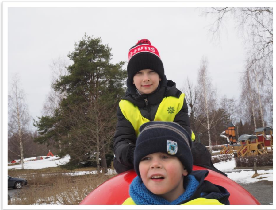
Kuva 13. Lapsen ottama kuva kavereista.