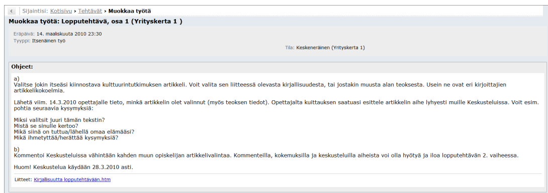
Kuva 6. Kulttuurintutkimuksen verkkokurssin lopputehtävä

Verkkokurssin lopputehtävässä on kaksi osaa. Ensimmäisessä osassa etsitään itseä kiinnostava kulttuurintutkimuksen artikkeli, esitellään se Keskusteluissa ja kommentoidaan myös muiden valitsema artikkelia ja aiheita. Toisessa osassa Kirjoitetaan oman artikkelin ja mahdollisen siitä käydyn keskustelun pohjalta essee, jossa peilataan omia ajatuksia artikkelin aiheisiin ja kurssilla käytyihin keskusteluihin. Tämä essee palautetaan vain suoraan opettajalle, ja siitä saa opettajalta kirjallisen palautteen. Lopputehtävässä, kuten muissakin tehtävissä on tehtävänannon lisäksi vielä linkki siinä käytettävään materiaaliin. (Kuva 6.)